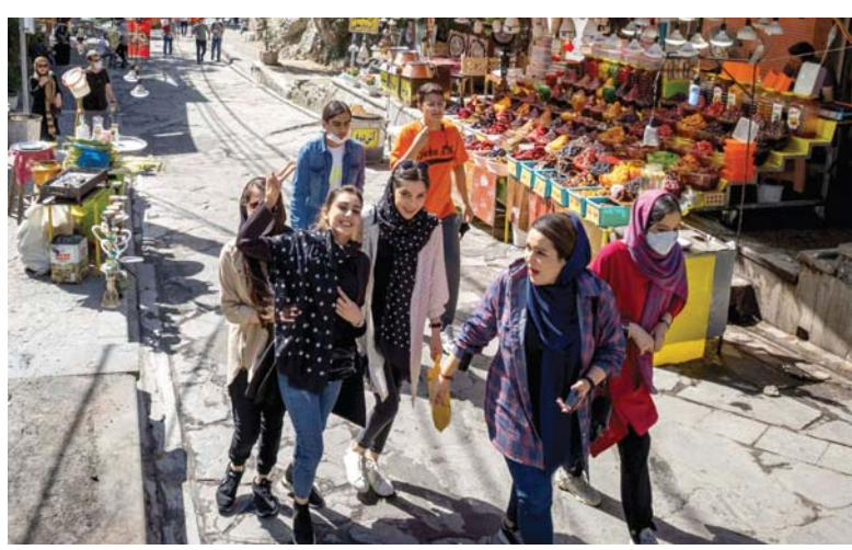
● أسرة إيرانية أثناء توجهها، أمس الجمعة، إلى صناديق الاقتراع للإدلاء بأصواتها، في انتخابات رئاسية ستعلن نتائجها، بحسب تصريحات المسؤولين الإيرانيين، اليوم السبت.

ويشارك في هذه الانتخابات أربعة مرشحين هم إبراهيم رئيسي ومحسن رضانوي وقاضي زادة هاشمي الذين