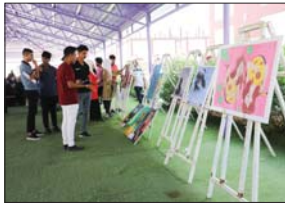
نتائج معبرة ومميزة للطلبة