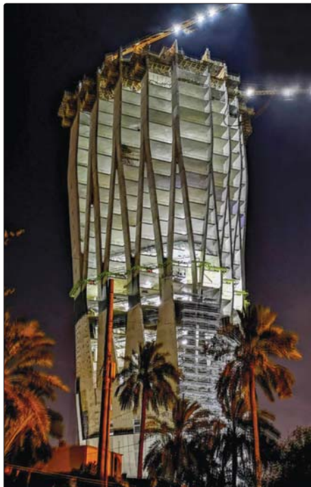
● نهاية البثك المركزي العراقي الجديدة ...