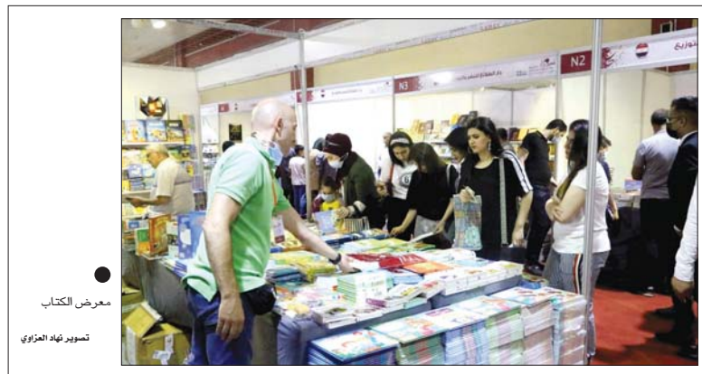
معرض الكتاب تصويره العزيزي

أعلن الأمين العام لمجلس الوزراء حميد الغزي المبادرة بالمشاريع التي توقفت منذ السنوات الماضية في بغداد والمحافظات، بينما أكد وجود توجه حكومي لاستحداث وزارة تعنى بشؤون المرأة. وقال الغزي، في حديث للصباح: 'إن من صلاحية المحافظات إعداد خطة بمشاريعها الخاصة ببرنامج تنمية الأقاليم، مشيراً إلى أن 'وزارة التخطيط باشرت إكمال إبراجها، فضلاً عن المبادرة بالمشاريع التي توقفت سابقاً في بغداد والمحافظات'. وبين أن 'وزارة التخطيط في طور إعداد وإدراج المشاريع الجديدة للمبادرة بها بعد إكمال جميع الإجراءات الخاصة بذلك، في حين ستبدأ وزارة المالية تدريجياً بإطلاق التخصيصات تلك الخطط'. وبتشان المشاريع المتوقفة في محافظة ذي قار، بين الغزي تكليفه من قبل مجلس الوزراء بمعالجة تلك المشاريع التي مضى عليها أكثر من 10 سنوات، إضافة إلى المشاريع المبرجة ضمن الخطط القوية. نظراً لظرف القصور الذي تعاني منه المحافظة والتي أدى إلى تأخر إنجاز المشاريع لسنة 2019، 2020، وبتات المشاريع بالاستئناف وافتتاحها من قبل المكونات المحلية والاختصاصية'. الغزي ألقى على 'مؤيد توجه من الحكومة لاستحداث وزارة تعنى بشؤون المرأة خلال المرحلة المقبلة، وهي ضمن أولويات إعداد دراسة عميقة بمشاورات الخبراء والباحثين، والوقوف على واقع المرأة في العراق، وربطها بالبلدان بعلاقات عريقة وعوامل مشتركة، منها مواجبة الإبراهيم والتطرف'. في غضون ذلك، أكد حميد الغزي ضرورة تفعيل اللجنة العراقية - الباكستانية المشتركة الخارجية، وذكر بيان إخراج أن وزير الخارجية التقى نظيره الباكستاني، وبحثا سبل تعزيز العلاقات الثنائية بين البلدين في المسائل والأهمية بالتعاون في مجال مكافحة الإرهاب والسياحة البيئية'.