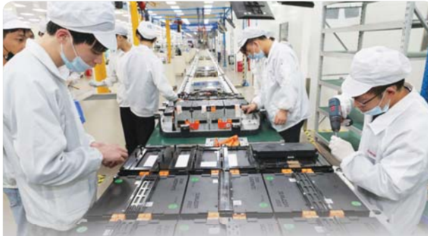
مجلس إدارة شركة فولكسفاغن في مصنعها في براونشفايغ، ألمانيا