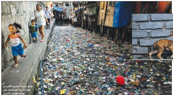
هل تستطيع الأروع التي تشاركها الكوكب التكيف بسرعة كافية لتواكب العالم الجديد الذي نسمعه له؟

مواقع التواصل الاجتماعي. قد يبدو هنا أمرًا غير ذي شأن من شخص واحد لكن تراكم مليارات من تلك الأفعال الصغيرة يحقق الكثير. تدعى كوريات شركات التكنولوجيا أنها تصبه للتقنيات الخضراء، أو تضع أهدافها لتجديد الكربون، لكنها تاروا ما تشجع الناس على فضاء، وقت أقل في التواصل الاجتماعي أو شراء منتجات أقل بل غالباً ما تعلن عن نماذج تجارية برسائل قوية تعزز مفهوم الاستهلاك ومزيد من الاستهلاك. هذه للزعة المادية الوحشية اللاعقلانية متأسفة وعمق التقاليد والرموز الثقافية العالمية. في عصر الأنثروبوسينية يدفع الناس لتعليق مآلهم على التكنولوجيا لحل مشكلاتهم، كي يتمكنوا من الاستمرار بنمط حياتهم. ذكرتنا جاتحة كورونا بنشاطها الضخمة والاستجابة السريعة وعدم استعادتها لمواجهة حتى ما نعرفه سابقاً، وبأننا نعرف، وعلمتنا أيضاً أن السلوك البشري قابل للتعديل بتصرفات بسيطة (كارتداء الكمامة) للتخفيف من حدة الوباء العالمي.