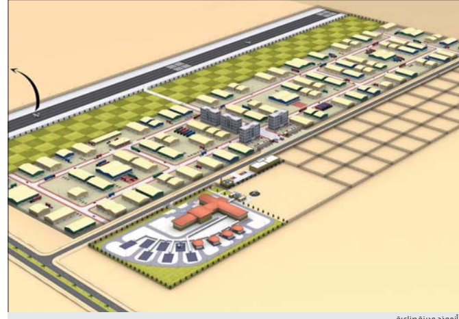
أموذج مدينة صناعية

بغداد/ حسين نقيب طرح مختصمون بالشأن الاقتصادي في جملة من الخطوات التي يمكنها إصلاح الاقتصاد الوطني والتفكير على المشكلات التي تحد من تنفيذ التوجهات التنموية، إذ ذهبت الطروحات صوب إنشاء مدن صناعية في مناطق استراتيجية، وإنشاء صندوق ثروة سيادي، ودعم نشاطات سوق الأوراق المالية لجذب رؤس الأموال الإقليمية والدولية. المختص بالشأن الاقتصادي باسم الإقليمي جدد دعوتهم لإنشاء صندوق ثروة سيادي يكون هدفه عن المورثة العامة والاقتصاد الكلي عن الصادرات الخارجية التي قد يتعرض لها الاقتصاد العالمي، وكذلك أسعار النفط العالمية ليسهم في الأبعاد عن عدم الاستقرار جراء الصدمات الخارجية، كما يتضمن حقوق الإيجال القادمة إلى جانب عده مركزاً مهماً للترويج والمشاريع ذات الأولوية الاقتصادية والاجتماعية على طريق تحقيق النجاح في عملية التنمية الاقتصادية.