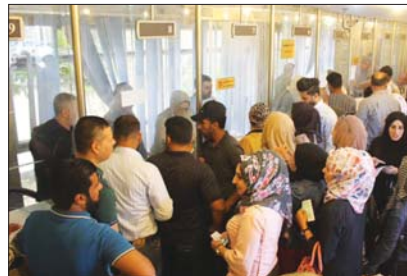
عاطلون يتسلمون المنحة للوجبة الأولى

الاجتماعية أو يكون موظفاً أو متقاعدًا أو طالبًا، مؤكدة على ضرورة أن يكون متفرغًا لخدمة الشخص المعاق بشكل كامل. وأردف المصدر أن وزارته أكدت أنه لا يشترط أن لا يكون المعاق موظفاً أو متقاعدًا أو لديه راتب حماية اجتماعية، كما لا تشترط القرابة بين المعاق والمعين.