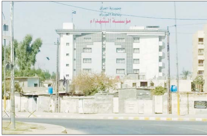
مبنى مؤسسة الشهداء في بغداد

دعت لجنة الشهداء والضحايا والسجناء السياسيين النيابية، الحكومة والبرلمان، الى عدم المساس باحتياجات ذوي الشهداء، بينما ردت مؤسسة الشهداء على قرار منع الجمع بين راتبين.