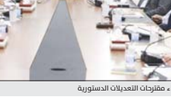
جانب من اجتماع اللجنة المؤقتة لإجراء مقترحات التعديلات الدستورية