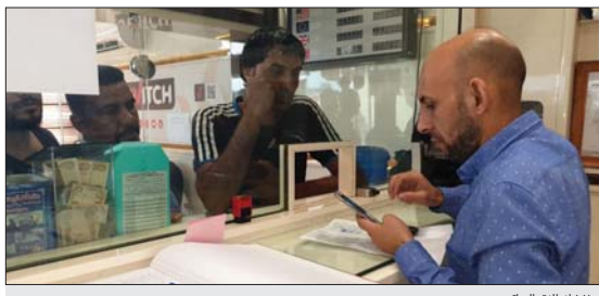
مفتد لإطلاق الرواتب