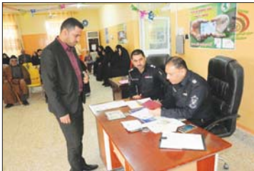
إصدار البطاقة الوطنية

إصدار البطاقة الوطنية في عدد من المحافظات بينها بابل وكربلاء، والتفج وديالى والديوانية بينما لم يتبق سوى دائرتين فقط في محافظة بغداد وأحدة في جانب الكرخ وأخرى في جانب الرصافة.