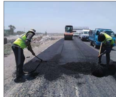
جانس من اعمال التليط