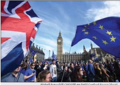
تحديات جديدة لبريكست تزامناً مع الانتخابات التشريعية المقبلة

بعد أن رُغم على طلب مهلة جديدة من ثلاثة أشهر من الأوروبيين - هي الثالثة - تعهد كورين بمعالجة هذه العملة "خلال ستة أشهر" إذا انتخب. وأعلن أنه يريد التفاوض مع بروكسل بشأن اتفاق جديد لبريكست في ثلاثة أشهر، يرض على تشكيل نوع من الوحدة الجديدة مع الاتحاد الأوروبي، وسيعرضه لاحقاً على استفتاء شعبي يقترح أيضاً على الناخبين إمكانية البقاء، في الاتحاد الأوروبي، لكنه استنق عن كشف خارجه الشخصي، وقال إن هذه المهلة "واقعية" مضيفاً "ما كنا لنقول ذلك لو لم نتعقد أن الأمر ممكن وقابل للتطبيق".