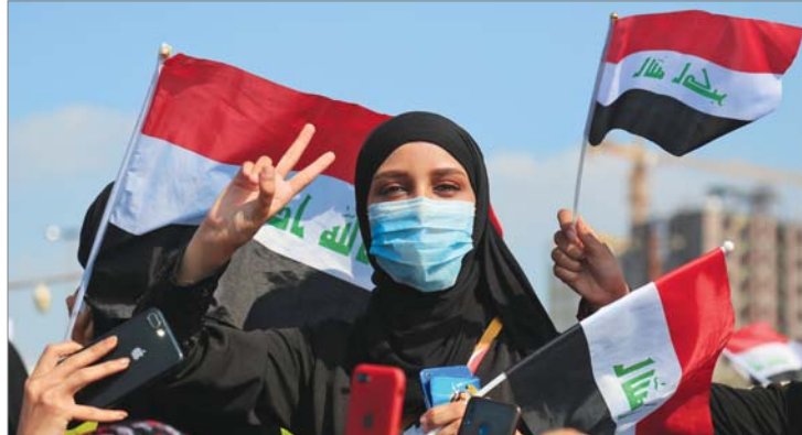
مشاركة نسوية كبيرة في التظاهرات التي شهدتها بغداد وعدد من محافظات الوسط والجنوب ... أ ف ب

واصلت الحكومة تحركاتها الهادئة إلى الاستجابة لطلب المتظاهرين، وتحقيق الدعوات الشروعة التي نادى بها المحتجون، فبينما ناقش رئيس الوزراء، عادل عبد المهدي، خلال اجتماع موسع ترأسه السبت موازنة 2020، إضافة للقرارات الحكومية استجابة لطلب المتظاهرين في موازنة 2020، تقرر خلال الاجتماع البدء بعملية التحول التدريجي نحو موازنة البرامج والأداء، وتزامنت التحركات الحكومية تلك، مع عزيم البرلمان عقد جلسة نيابية مهمة يوم السبت المقبل لمناقشة أربعة قوانين، وسط دعوات إلى الاستمرار بعقد الجلسات والعمل من خلالها على تعديل قانون الانتخابات، وتحديد مفوضية الانتخابات، والشروع بطرح استفتاء، لغرض تعديل الدستور العراقي، وهي الخطوات التي تأتي جزءاً من التحركات الأصلحية التي تبنتها السلطة التشريعية استجابة لطلب المتظاهرين. وتشهد العاصمة بغداد وعدد من المحافظات منذ أيام احتجاجات شعبية للمطالبة بتوفير الخدمات وفرض العمل والقضاء على الفساد، في ظل استجابة حكومية نيابية واسعة من خلال إطلاق حزمة من القرارات. وبينما أكدت القوات الأمنية على ضمان سلمية التظاهرات ومنع دخول المندسين الذين يحاولون