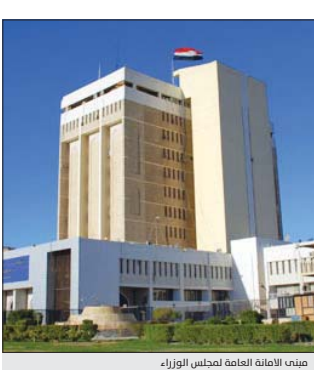
مبنى الامانة العامة لمجلس الوزراء