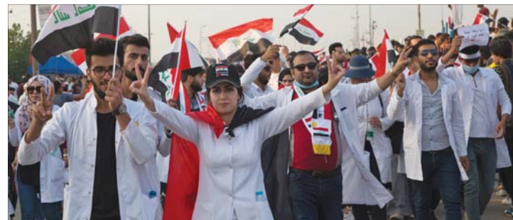
تظاهرة طلابية في البصرة، 6 أ ب

أما النائب المستقل عباس العطافي، فأكّد ان على "مجلس النواب الاستمرار بعقد الجلسات لغرض تعديل قانون الانتخابات وتجميد مفوضية الانتخابات والشروع بطرح استفتاء لغرض تعديل الدستور العراقي".