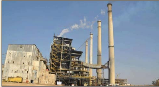
مجموع تشغيل العاطلين بوزارة الكهرباء