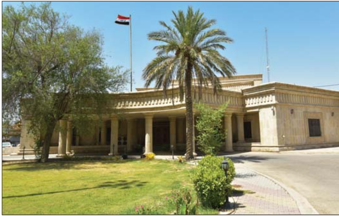
مبنى هيئة النزاهة