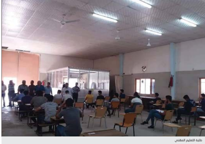
طلبة التعليم المهني

كشفت وزارة التربية عن قبول طلبة الاختصاصات المهنية ضمن قناة العشرة الأوائل في الكليات والجامعات، بينما شكلت لجاناً لاختيار مدرءا ومعاونين المدارس المهنية في بغداد والمحافظات. وقال مدير عام التعليم المهني بالوزارة سعد إبراهيم عبد الرحيم لـ"الصباح": ان المديرية نسقت مع وزارة التعليم العالي والبحث العلمي وتم قبول طلبة الاختصاصات المهنية ضمن قناة العشرة الأوائل في الكليات والجامعات، مؤكدا ان المديرية تعمل على تقديم الدعم لمخرجات التعليم المهني لاسيما ممن تفوقوا بالدراسة وسيتم قبولهم ضمن العام الدراسي 2019 - 2020.