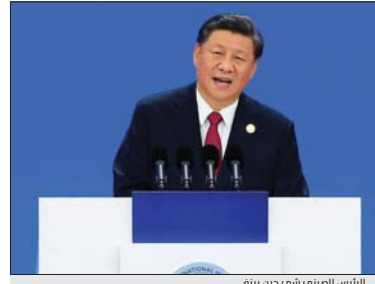
الرئيس الصيني شي جن بينغ

دون أن يسمي الولايات المتحدة بشكل خاص. وفي تصريحات أدلى بها بعد كلمة شي، انتقد ماكرون الحرب التجارية بين الولايات المتحدة والصين مؤكداً أنها "لا تخلق سوى أطراف خاسرة" وتؤثر سلباً في النمو العالمي. وأعرب عن أمله في أن تتمكن القوتان الاقتصاديتان العملاقتان من التوصل إلى اتفاق تحافظان على مصالح الشركاء التجاريين الآخرين، على رأسهم الاتحاد الأوروبي. وندد ماكرون باستخدام الرسوم الجمركية الجائز والمستخدم الرسوم كسلاح، دون أن يسمي ترابم مباشرة، لكنه أكد أن فتح الأسواق الصينية يجب أن يتم "بشكل أسرع وأكثر شفافية". أما شي، فقد أعرب عن أمله في أن يتم قريباً توقيع اتفاق تجاري أقليمي تدعمه الصين، بالرغم من إعلان الهند