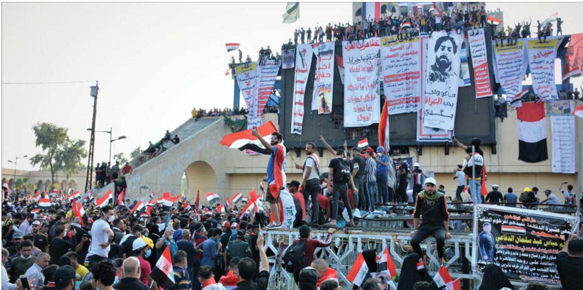
تظاهرات ساحة التحرير