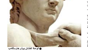
لوحة لفلان بيتر هيرسبك

استنكرين كل شيء، يخصني ويهتزون بك لو خربتني أنا، أنا الذي عليه أن يحزن وسط كل هذه الصور... أنا الذي فقد شعري بالدهون من جانب ما تبين كرجل للاحق بها.