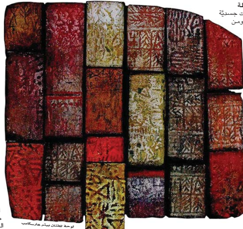
لوحة بيلتان بيتر هيرسبك

يكشف هذا النص عن وحدان مرتبة عذبة ولكن لا بد من التباين بين النص (Text) هنا، وهو المؤلف والراوي الضمني معاً، استخدم فعل "يرى"، أي أنه