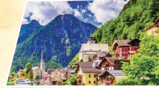
سيميان لا روتوند

هي قرية تقع على جبال الالب وقريبة من بحيرة هالشتات التي حملت اسم القرية التي لا يتجاوز عدد سكانها 1000 شخص وتعتبر من القرى المتساوية الصغيرة والهادئة .