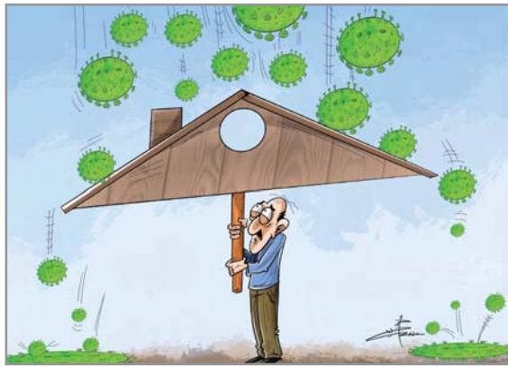
كاريكاتير: احمد خليل