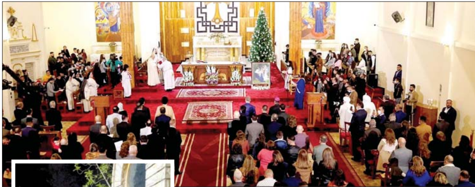
«المجد لله في الأعالي وعلى الأرض السلام وفي الناس المسرة» تراتيل الناس امتزجت فيها عبودية الأصوات مع هدوء الليل وتناثر قطرات المطر في جو روحاني، يملؤه الخشوع لاستقبال يوم مولد السيد المسيح. كانت هذه أجواء ليلة الخامس والعشرين من الشهر الحالي في رحاب كنيسة «تهنئة العذراء مريم» الصباح اختارت مشاركة الأخوة المسيحيين أفرحهم في هذه الليلة والتعرف على أهم طقوسهم.