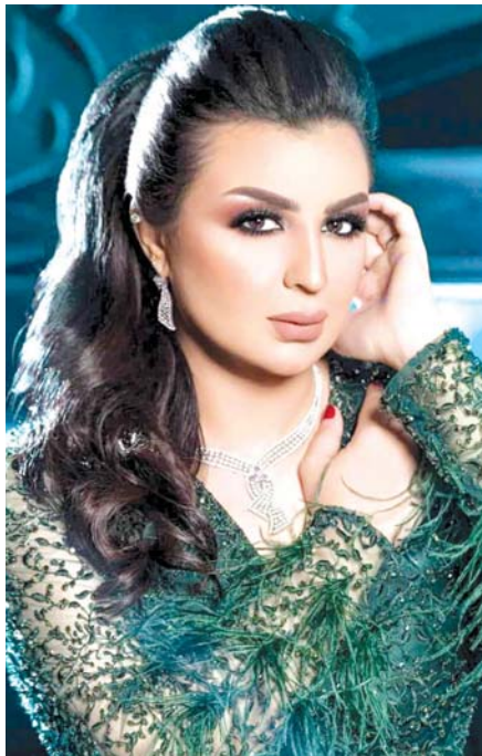
النجمة اصيل هميم تتألق على مسرح محمد عبدة بالرياض ضمن فعاليات موسم الرياض 2021 يوم الجمعة الماضي، وقدمت مجموعة من اغانيها التي لاقت تفاعلاً من الجمهور الكبير الذي حضر حفلتها.