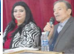
ناظم السماري متحدنا عن فؤاد سالم

بمناسبة الذكرى الثامنة لرحيل فنان الشعب فؤاد سالم، اقام منتدى «بيتنا الثقافي» يوم الجمعة الماضي، حفلاً استذكاريًا للراحل، وسط جمهور غفير وتوعي غسيت به قاعة المنتدى حضره وفاء لرمز من رموز الابداع العراقي، وقدمت الجلسة الثانية التذكيرية بشري سعييم التي بدأت كلامها عن الراحل يقول «فؤاد سالم او (فاج حسن) وجوده ناصعة كثيرة، فهو الفنان الملتزم الذي احترم فنه وصوته ولم يتاجر بموهبته ابدا وهو الملتفت الذي وعى عصره وحاول التعبير عنه بكل صدق وأمانة وهو الشاعر الغزوي والمحلن العذب وقيل كل ذلك هو الانسان الطيب النقي الذي ظل حتى آخر سواره مثالا للوفاء والتزامه والخلق الرفيع».