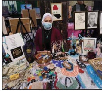
● من اعمال مهرجان لقاء الأشقاء للحرف

افتتح الاسبوع الماضي برعاية وزارة الثقافة والسياحة والآثار على قاعات المحطة العالية لسكان جديد، فعاليات مهرجان لقاء الأشقاء، الثامن عشر للهوايات والحرف المتنوعة التي حمل شعاراً واضحاً عالمياً أيقناه الحضارة والسلام، بمشاركة عربية واسعة وحضور مهني مميز. المهرجان الذي استمر لمدة ثلاثة أيام تضمن عرضاً لاصناعات نسجية واللباس التراثية وكبسولات وحلي فضلاً عن عرض مجاميع للطرايع اليدوية وأعمال تشكيلية شملت الخزف والنحت وصناعة المنمنمات وتحضير المسل والزبوت النباتية، وعرض للمصنعات وكسب ومطبخات، إضافة إلى صناعة الزهور.