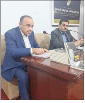
● شباب مع الحفل

أقام اتحاد أدباء كربلاء، حفل توقيع كتب عدد من شعرائه الذين صدرت لهم دواوين شعرية ضمن إصدارات اتحاد أدباء العراق ودون نشر آخرى. أمباء التوقيع على التوقيع المقيم على قاعة اتحاد أدباء كربلاء، وسط المدينة أراه الناقد الدكتور محمد عبد الباسري وقرئت على هامشه قصائد متعددة، كما تحدث المحقق بهم عن مواضيع ثقافية تخص مشاغلهم الإبداعية.