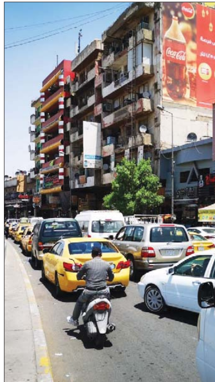
● زحام يخنق بغداد.

تقديم دعوى إلى مجلس القضاء، كونه يمتلك السلطة الحصورية لحل المشكلات الناجمة عن الانتخابات، إلا أن هذا الأمر لا يستأجر مصادفة المحكمة الاتحادية على النتائج. وأضاف أن المحكمة الاتحادية بعد مصادقتها على نتائج الانتخابات الأخيرة، سيدعو رئيس الجمهورية مجلس النواب الجديد لاتخاذ الجلسة الأولى بعد 15 يوماً. الخبير الانتخابي وادف الزبدي أوضح، في حديث للصباح: أن هذه هي المرة الأولى التي يُقدم فيها طعن لإلغاء نتائج الانتخابات من 2004 وحتى الآن. وأضاف أن المحكمة الاتحادية تعرضت إلى ضغوط من أطراف عدة لكنها صمدت أنها خيمت العراق وإن لا سلطان على القضاء، سوى القانون. أما استناد العلاقات البرلمانية الدكتور جاسم العمري فدعا عبر حديثه للصباح: جميع الأطراف إلى القبول بقرار المحكمة الاتحادية بصدور الطعن على نتائج الانتخابات. وأضاف أن أول اتجاهات المشهد السياسي في العراق القبول بقرارات المحكمة ما دام الجميع متفقاً على احترام السلطة القضائية. وقال في هذا الشأن: قال الخبير القانوني أمير الدعي للصباح: إن التعرضين يمكنهم