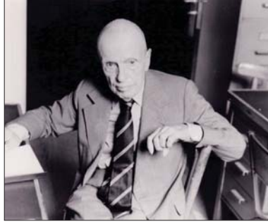
● ميشال ليريس