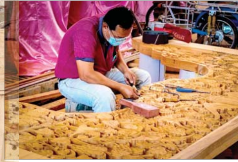
تمثل مطارقها ومساميرها وبقية أدواتها وشخصياتها وتاريخها، ذاكرة خالدة تتحدى لغة النسيان عبر نبع خالص يفيض بأصالة الموروث الشعبي وحكايات الزمن الجميل، حرفة اصطلحت بتقنيات العصر كحال غيرها من الحرفيين والمهن والحرف الشعبية الأخرى، والتي بمجرد أن اتسعت مساحات التطور التكنولوجي وعزوف زبائننا، حتى رفعت راية الانزواء والركون جانباً بكل خجل واستحياء.