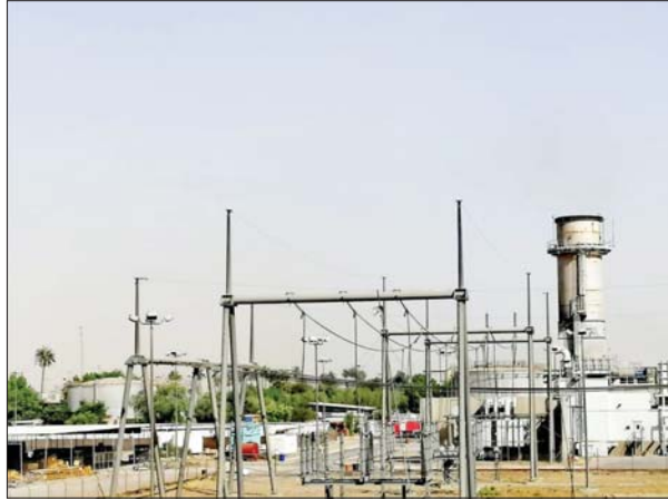
● تصوير خضير العتايبي