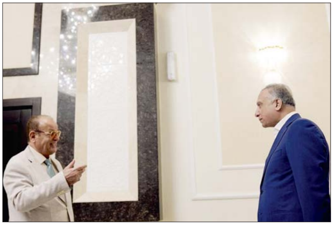
رئيس مجلس الوزراء مصطفى الكاظمي يستقبل الفنان حسين نعمة امس الاثنين، ويؤكد الثقافة والمثون وجه العراق الياسم امام العالم

شملت وزارة التخطيط 15 محافظة ضمن مرتين بمشاريع الصندوق الاجتماعي للتنمية ضمن ستراتيجية القضاء على الفقر ووضعت المخطط الرسمي باسم الوزارة عدد الزكرة الهندي (الصحة) ان المشاريع الاجتماعية للتنمية في اقلية من الوزارة العام 2016 ضمن ستراتيجية القضاء على الفقر، وبدأ تنفيذها في القرى التي تم دعمها بما يشمل إنشاء مشاريع بالنطاق القرى والثانية وتتضمن خطوط كهرباء، ومحطات ماء، وبناء مدارس وشبكات طرق ومن خلال اختيار شركات رصينة لتنفيذ تلك المشاريع. يشار الى ان المشروع الكون من ثلاث مراحل والموال يفرض من البنك الدولي بقيمة 300 مليون دولار لمدة خمسة اعوام بهدف الرفع مستوى الخدمات في القرى الثانية والنطاق معدومة الخدمات. وكشفت الهندي عن نجاح الوزارة خلال المرحلة الاولى من مشاريع الصندوق الذي شمل ثلاث محافظات هي المثنى وديور وسلاح الدين، من خلال 60 مشروعاً توزعت بين عشر قرى بهذه المناطق تضمنت بناء مدارس ومد خطوط كهرباء، ومحطات ماء إضافة الى إنشاء شبكة للمحرق. وذكر ان الوزارة تعمل حالياً في المرحلة الثانية منه وتشمل ثمانية محافظات هي بغداد والبصرة والسيمانية وديور وبابل، منها بانه يجري تنفيذ المشاريع منها من قبل اهالي المناطق بعد تشكيل فرق مجتمعية منهم لتأجيرها. وكانت الوزارة قد وضعت شبكات قرية الشهر الماضي، وفقاً لمبادرة ضمن المحافظات المشمولة بالمشاريع تضم برزات التخطيط والاصحاء التابعة لها والتي باشرت زيارتها الميدانية الى القرى التي تم اختيارها، والتقت بالسكان المحليين، وقدمت شرحاً تفصيلياً عن مهام الصندوق وآلية اختيار المشاريع ودور اهالي القرية في ذلك.