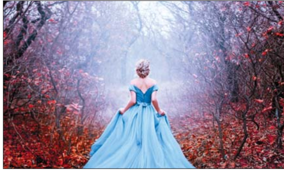
ليست مجرد قصة عن رغبة انثوية، وإنما شعور عام بالهروب من الواقع