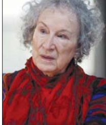
● مارغريت أوتود

صغيرة مؤشدة بخلاطة نثر وصخور مستنة من النزوع السدي إذ اهتمت باتجاهه السفينة فلها يتعطم والأمسر الخليلر بخصوص هذه الحوريات هو أنهن باهرات الجمال بشكل يفوق هذه هي الأغنية الفريدة التي لا تقام صغيرة مؤشدة بخلاطة نثر وصخور مستنة من النزوع السدي إذ اهتمت باتجاهه السفينة فلها يتعطم والأمسر الخليلر بخصوص هذه الحوريات هو أنهن باهرات الجمال بشكل يفوق هذه هي الأغنية الفريدة التي لا تقام