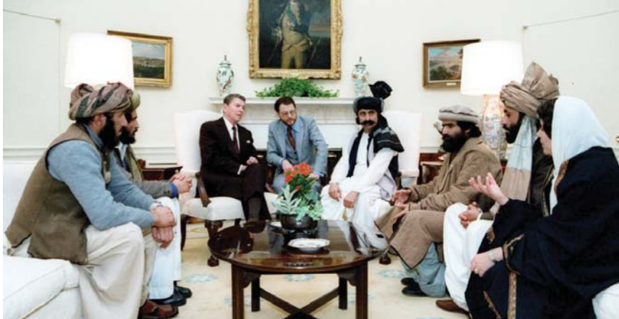
• الرئيس الأمريكي رونالد ريغان يستقبل ما يسمى بـ"المجاهدين" في البيت الأبيض