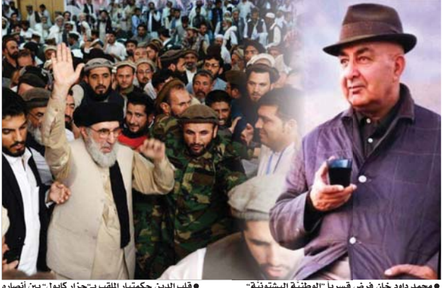
• محمد داود خان فرض قسرياً "الوطنية البشتونية"

سؤال الجميع، هل طالبان الحالية في نفسها طالبان التاريخيّة التي عرفها العالم بالبلاديّة والجمعيّة، إيان حكمها قبل ربع قرن، أو أنها استحدثت إلى وجود آخر، تترك الجواب إلى فرصة مستأنفة بإذن الله القدير.