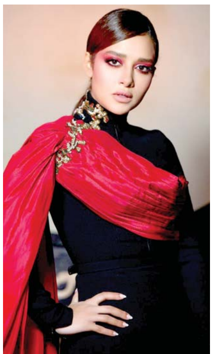
بدأت الاضائة اليمينية بلباس فتحي منذ أيام والترويج لعمل جديد يحمل عنوان «نتي»، بسلسلة صور نشرتها عبر حسابها على الانستغرام، فسرت بأنها تعني بها طليقتها وتشير الى انتهاء علاقتهم تماما.