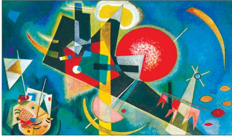
• لوحة لفنان فلسطيني