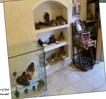
نماذج من الجسمات