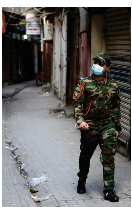
• الالتزام «يسود» شوارع بغداد..