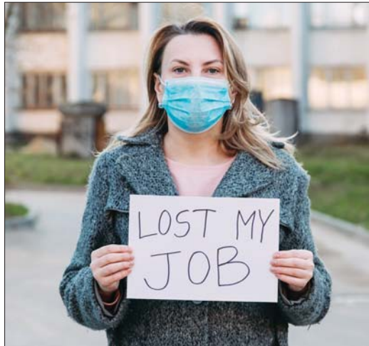
• بلغت نسبة خسائر النساء لوظائفهن 5 بالمئة في العام 2020