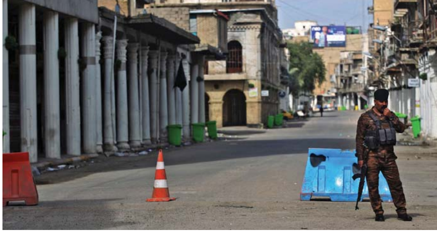
● إجراءات الحظر تدخل حيز التنفيذ حتى أوائل آذار المقبل. بعد اكتشاف دخول السلالة الجديدة من فيروس كورونا الى العراق... (أ ف ب)

● بغداد: هدى العزاوي ● المحافظات: مراسلو الصباح