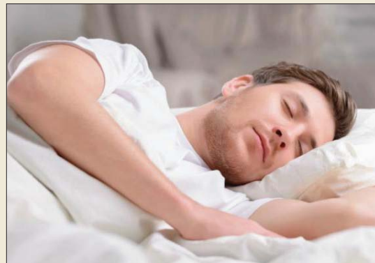
النوم يعزز الصحة

جميع مراحل النوم تُؤمن راحة المخ والجسم، خاصة وأن كل مرحلة تعد أعمق من سابقتها، وتنتهي الدورة باكتمالها بعد مرور الشخص بمراحل النوم الخمس. وفي الحقيقة، تعد المرحلة الأخيرة الأكثر تعقيدا بين جميع ونصف الساعة بعد مرور نحو ساعة ونصف الساعة من وقت النوم. وخلال هذه المرحلة، تتحرك العين بشكل سريع بشكل لا إرادي إذ يعجز العلماء ذلك إلى الأحلام التي يراها التام والتي تتضمن