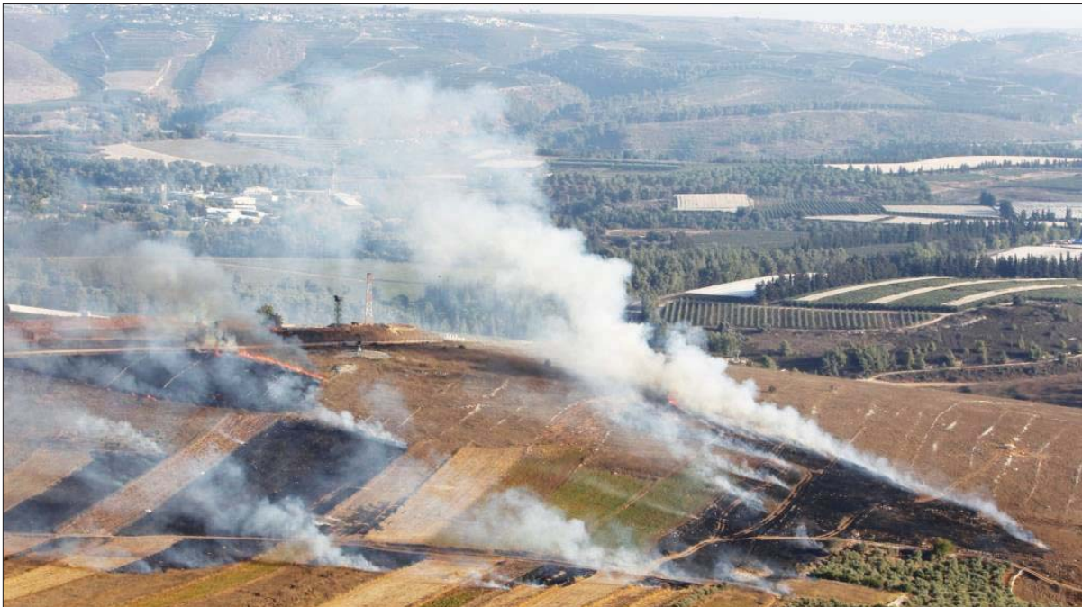
الحدود اللبنانية الفلسطينية