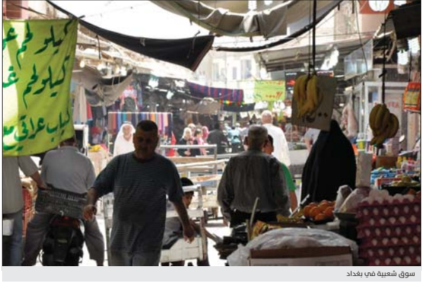
سوق شعبية في بغداد