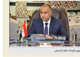
وزير الزراعة صالح الحسني

بغداد / الصباح وقوف مجموعة تجار عراقيين وراء زيارة السفير التركي إلى «علوة البيض» لافتاً إلى أن تحركات السفراء يجب أن تكون بالتنسيق مع وزارة الخارجية. وقال المصدر: إن «سفير تركيا يجب أن يبلغ وزارة الخارجية وأخذ موافقتها قبل التوجه في مشروع اقتصادي وطني عراقي مثل (علوة البيض) خاصة أن العراق رفض استيراد البيض من الدول الأخرى، واعتمد على منتجاته المحلي» وأوضح أن «زيارة السفير التركي إلى (علوة البيض) جاءت بعد قيام بعض التجار بالاتفاق مع السفير لزيارة الأسواق، وهناك بعض الإجراءات التي سيتم اتخاذها، إضافة إلى حضور البيض بالإنتاج المحلي».