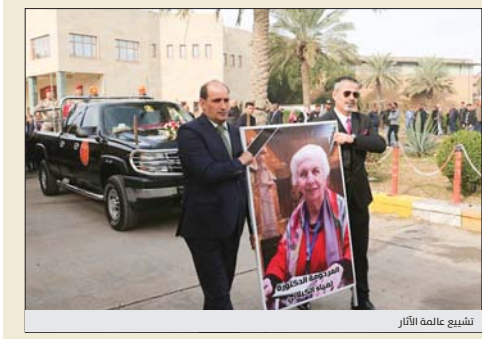
نشيع عالمه الأثار