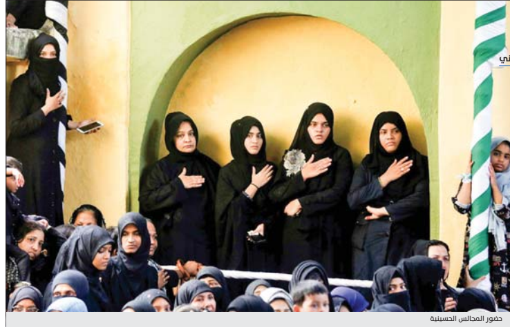
بيروت / فغان المشهاني

اعتاد محبو الإمام الحسين وأهل البيت عليهم السلام سنوياً على إحياء ذكرى عاشوراء، وفي لبنان ومع بدء شهر محرم غالياً ما تنظم سرادق العزاء في الشوارع، ويرتدي النساء الثياب السود ويقمن بمشاركة أصابع المواكب بتوزيع النور والعباءة والكحل وأجر العباس على الأيتام والعفراء، الذي يُعزى فيه الخبز والبيوت والمحاسن كما تقدم لهم "الوريس" أيضا على الأوزار وإفهام رايان الولاء للثورة الحسينية الخالدة.