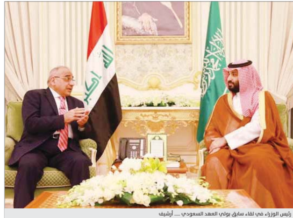
رئيس الوزراء في لقاء سابق بولي العهد السعودي... أريفي

محمد بن سلمان أجرى اتصالاً هاتفياً مع عبد المهدي، تطرق إلى مناقشة العلاقات بين البلدين