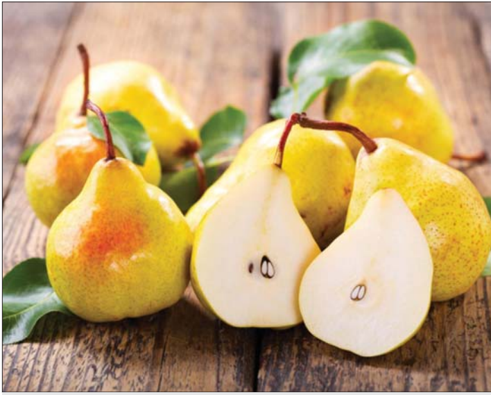
ثمرة غذائية ومناخ طيبة

واحدة من الكمثرى توفر 12 بالمئة من احتياجات فيتامين سي اليومية، و 10 بالمئة من فيتامين (ك) و 6 بالمئة من اليوتاسيوم وكميات من عناصر أخرى مفيدة