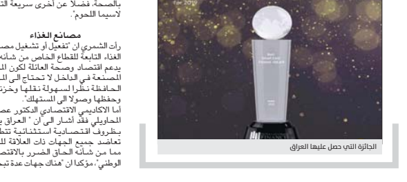
الجائزة التي حصل عليها العراق