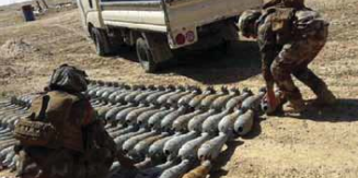
بغداد / الصباح

في غضون ذلك، تمكنت مديرية الاستخبارات العسكرية من ضبط كدس كبير من العبوات الناسفة بمنطقة القامح في محافظة الأنبار، وقال المتحدث في بيان تلقته العسكرية «أخري من الفرقة الثامنة استولنا على كدس كبير للعبوات الناسفة في منطقة القامح بمحافظة الأنبار».