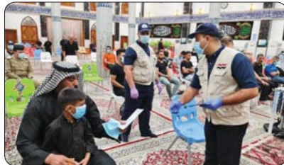
بغداد/ محمد اسماعيل

تتجلى عاطفة إيمانية عميقة، من إيقاع الكلمات التي تؤجج حب الحسين في نفوس المسلمين.. قصة إيمان خالدة في دموع الباكين، حزنًا على ذواتهم الأندة بعظمة أبي عبد الله عليه السلام.