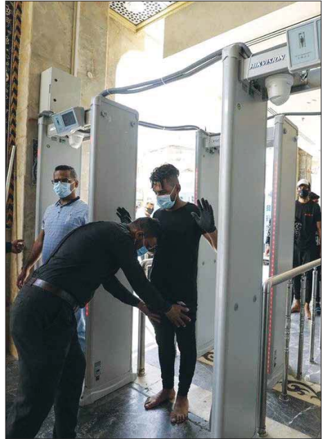
• بوابات الكترونية لفحص زائر الامام الحسين (ع)