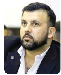
بغداد / هيثم كاظم

الثاني عشر من شهر ايلول المقبل موعنا لاجراء انتخابات اتحاد ادارة جديدة من قبل الهيئة العامة. مشيراً الى ان الاجتماع تضمن أيضاً مناقشة الجوانب المالية والادارية واهم السبل لتطوير فرق النادي ونهية جميع الاستقالات لها بغية نجاحها في الموسم المقبل.