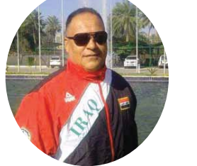
متابعة / محمد عجيل

وحرس جدا على التواصل معهم إلكترونياً من اجل اكمال مهامهم التدريبي التي يجمع لهم بمشاركة في اي بطولة تنام انا ما اعان الاتحاد الدولي، اياها مشدداً على ضرورة التزام الجميع بمقررات اللجنة الازمة الحكومية.