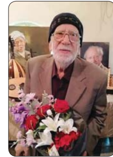
بغداد/ سرور العلي

مهم وهو ذكرى ثورة الحسين... عليه السلام، مشيراً إلى أن: «واقعة الطف كانت وما زالت تمثل قيمة كبرى للمسلمين». وأرضود، الربيعي، إذا فالحسين، مسرحي قائم على تنصي مؤثر، يتناول منذ 1400 عام ولم تتغير فيه كلمة وما زال مؤثراً. وتابع نائب نقيب الصحفيين الجاحث الإسلامي، ناظم الربيعي اللورث الشعبي العراقي غنسي يضم جلسات التمسك الشورية، إذاً الفاضلة الحسينية العاشورائية تخصصت بجانب