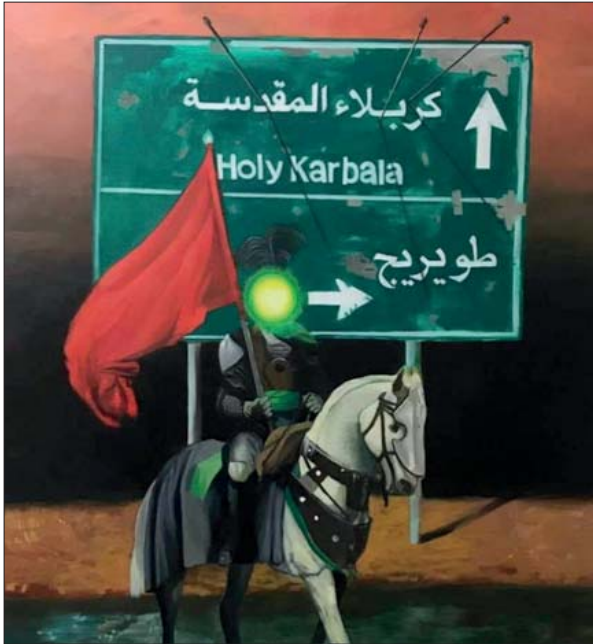
من اعمال الفنان محمود مشير