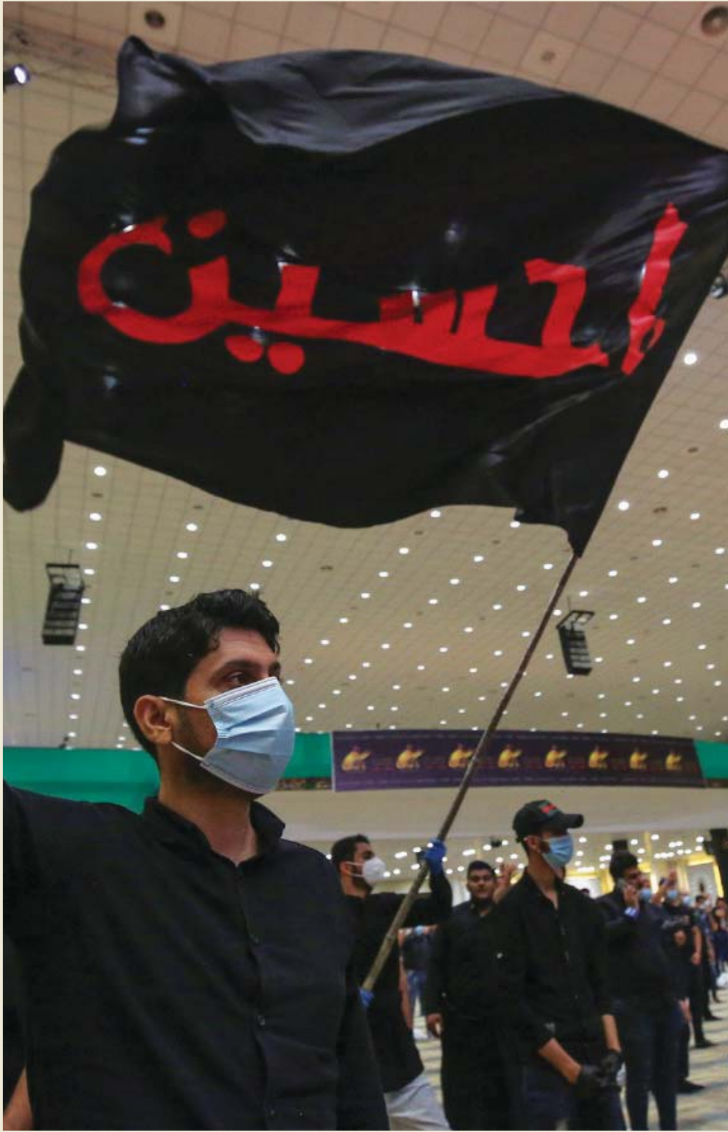
..الحسين.. عنوان للصبر والنصر...