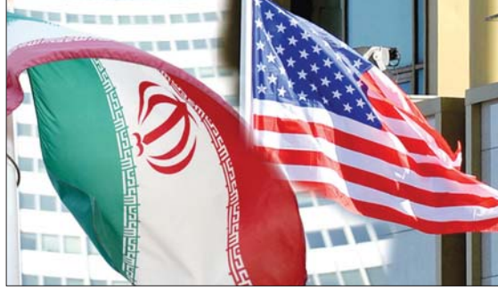
● طهران، وكالات

كثرت مصادر أميركية مطلعة موقع «أكسيوس» أن جهود إدارة الرئيس جو بايدن لإعادة التواصل مع إيران بشأن برنامجها النووي، تواجه ثلاث عقبات رئيسية: وارتض المسؤولون الأميركيون أن العقبات هي الانتقال إلى قنوات اتصال مباشرة واستفسارات داخل القيادة في طهران والانتخابات الرئاسية الإيرانية الوشيكة وأشاروا إلى أنه من خلال القنوات غير المباشرة تحاول الولايات المتحدة قياس ما يتطلبه الأمر لدى المبادرات وفي مرحلة ما، اعتقدت الولايات المتحدة أن الإيرانيين مستعدون لقبول نهج تدريجي، ثم أوضح الإيرانيون أنهم لن يقبلوا ذلك. وفقاً للمصادر، اقترحت الولايات المتحدة للولايات المتحدة بالغاء تجميد الولايات المتحدة للأموال الإيرانية المحترجة في