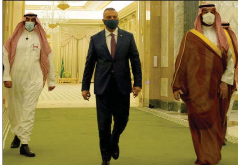
● بغداد: محمد الأنصاري

وقع الوفد العراقي برئاسة رئيس الوزراء مصطفى الكاظمي، أمس الأربعاء، خلال زيارته الرسمية الى المملكة العربية السعودية، عددا من الاتفاقيات ومذكرات التفاهم مع الجانب السعودي الذي رأس وفده ولي عهد المملكة العربية السعودية الأمير محمد بن سلمان.