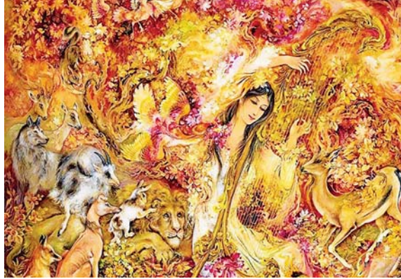
• لوحة (الفتن محمود مأمور)

الإنسان البسيط لا يستطيع أن يكتشف الإبهام والغموض في شخصية الكائن البشري، ويعجز عن التوغل في اكتشاف هيولى الطبقات البعيدة الغور في داخله. يرى مثل هذا الإنسان الواقع رؤية مسطحة، ويؤمن الحياة فيها سادجا بحسب الحياة شديدة الوضوح وكل ما فيها مكشوف، وهو لا يدري أن الحياة تجربة عملية لا تتكشف للإنسان إلا بالعيش فيها والصبر على اختياراتها القاسية، وخوض مساراتها الوعرة، والوقوف على محطاتها المختلفة، والتغلب على منطقتها الشائقة، والنجاح من مياغاتها الريمية.