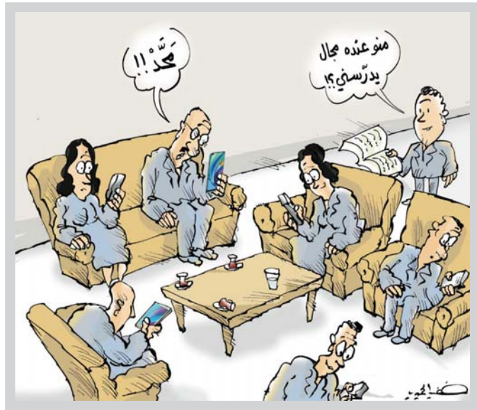
• كاريكاتير: خضير الحميري

لعمل قراره سريعة لتاريخ الشعوب وأزماتها تبين فداحة الحقيقة الصورية التي يمر بها لبنان، فهي من حيث تشاكرها وتقديراتها كذلك لا تشبه أيًا من المجتمعات السابقة، لذا، يصعب القياس عليها، أو التكهّن بما سيكون إليه ماؤها. يوما بعد يوم يشهد الخناق على المواطن من مختلف الجهات، تحاصره الأزمات الصحية، فضلا عن تدهور الأوضاع الاقتصادية، وانسداد الألق في ما يتعلق بتشكيل الحكومة، وما يرتبها عليها من تبعات. فيجد المرء نفسه في سراع حقيقي لتأمين قوت يومه، بينما في