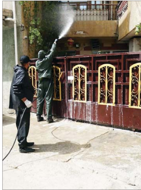
جانب من عمليات التعقيم التي تقوم بها هيئة الحشد الشعبي

فيما أعلن رئيس الوزراء الكلف مصطفي الكاظمي سير مشاوراته مع الكتل السياسية بشأن تشكيلته الوزارية في أجواء ودية، كشف مصادر برلمانية للصباح عن تأليف لجنة سياسية من خارج البرلمان، مؤلفة من شخصيات تابعة للكتل السياسية «السيعة» التي اختارت الكاظمي لمساندته ودعمه في