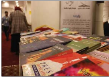
● من أجندة المعرض

هنا فحين إبداع الفكر ومثل، يكون الكتب منه، وإيجاد البائل النظرية أو ما ساند في الواقع، لا يعني جده أبداً في زحمة الواقع الإيجابي، هنا إن لم يؤثر به سلباً عبر إشاعة حالة الفتنة التي تأتي من عنق المفارقة بين الفكر الصحيح والواقع الخاطيء، في الآفاق نفسه تفهم سبب إخفاق المشاريع النقدية التي سادت الحظ العميق، الإسلامي منذ أكثر من مئة عام، فهي رغم ما تتسلل به من منافع محككة أحياناً ونظر عميق، إلا أنها تتسحق حول نفسها أفكاراً مفصولة عن الواقع، معزولة عمّا يحرك الناس فعلاً، فتدوى وتتلاشى وتختنق داخل الشرفة التي أحاطت بها نفسها.