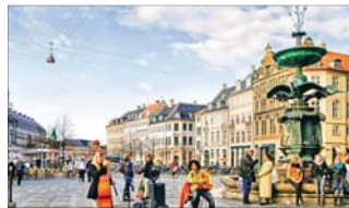
● كوبنهاغن مدينة الجمال