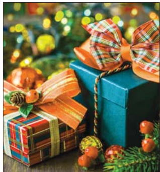
● نموذج من هدايا ملكة التتظلم.