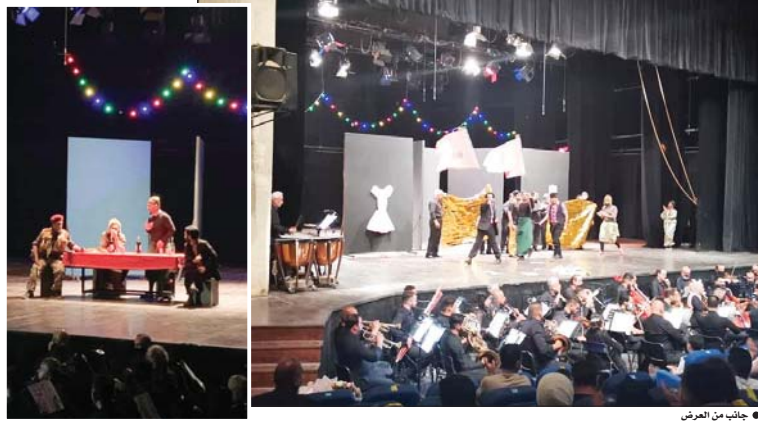
● جانب من العرض

على وقع أنغام الموسيقى يتوهفون، عرضت أمس الأول الخميس، على خشبة المسرح الوطني، المسرحية الموسيقية اللائانية - العراقية - يكمنون في العراق، إخراج وتصميم استريد فيشتدتن، عزف موسيقى الشرفة السمفونية الوطنية العراقية بقيادة المايسترو كريم وصفي، تمثيل فرقة المسرح العراقي.