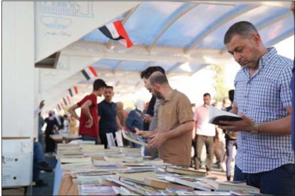
الرجعي رغم الفرق الكبير، ولكننا نعلم بأن شارع الرجعي هو مساحة تجارية له مكانة عند أهل الموصل، خاصة أنه في الجانب الأيمن من المدينة، وعمره نحو المئة عام.