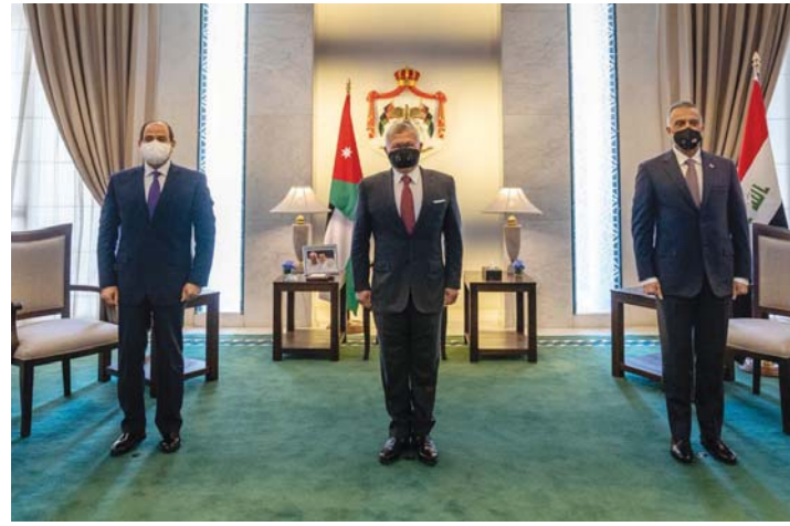
قمة ثلاثية صباحية

القاهرة، اسراء خليفة يرتقب ان تحتضن العاصمة بغداد غداً الأحد انعقاد القمة الثلاثية بين العراق ومصر والأردن بعد تأجيلها قرنين بسبب ظروف طارئة. وقال مصدر دبلوماسي مسؤول لمراسلة «الصباح» في القاهرة ان الرئيس المصري عبد الفتاح السيسي سيتوجه لبيد لعقد القمة الثلاثية التي تضم رئيس الوزراء مصطفى الكاظمي والملك عبد الله الثاني ملك الأردن. ويبين المصدر ان القمة تأتي لجميع الاتفاقيات للدول الثلاث التي تم توقيعها خلال الـ 14 الماضية، مبيناً انها تعد في بغداد استكمالاً للقمتين السابقتين في مصر والأردن. وفي السياق علمت «الصباح» ان سفر العراق في القاهرة والتدوير الماتاري جامعة الدول العربية لحمي نايف اليميني وصل الى بغداد للمشاركة في استقبال