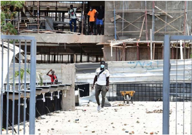
● مدخل جامعة أنطا ديبوب في دكار، خلال تظاهرة طلابية ضد التصويت على مشروع قانون جديد لمكافحة الإرهاب يعتقد المعارضون للحكومة السغالية أنه قد يتم استخدامه لوقف الاحتجاجات ضد الحكومة في الشوارع.

وقالت الرسالة في تعريفة عبر "تويتر"، إن ترامب أخبر عدداً من الأشخاص الذين تواصل معهم بأنه يتوقع إعادته إلى منصبه بحلول ذلك الوقت، مبيحة أن حديث ترامب، ربما يكون مرتبطاً بامتحالية صدور حكم بشأن لائحة اتهام جنائية ضدّه في مانهاتن.