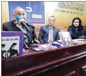
جانب من الاحتفاء

توم رافينسكروفت • ترجمة، مي اسماعيل قدم مصمم اللبسة الاميركي، «برجيل ايلوه» تصاميم لسترات رجالية تزينها معالم معمارية شهيرة عالميا، لصالح «لوي فيتون». ظهرت التصاميم الجديدة في مجموعة الخريف الشتاء المقبلين للاملابس الرجالية، التي قدمت في عرض محدود خلا من الجمهور بسبب قيود الجائحة. وفي فيلم تصويري للعرض مشى العارضون بين معالم تجريدية بنيت من الرخام الاخضر، عكست الخلفية المعمارية للمصمم، ووقفا على منصات كبيرة كانت تعزيرا للتصميم الجديد. تعطي تلك السترات (ذات النوع المنفوخ) نماذج ثلاثية الابعاد لعالم بارسيه شهيرة او ناطحات سحاب اميركية، فكانت السترة التي قدمت معالم باريس حيث للبيئة، التي تعيش فيها المصمم الآن ويعمل، وكان من اسمها: كاتدرائية نورترام ليرج ايل