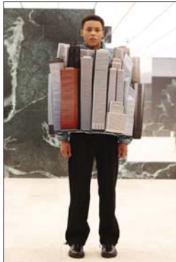
معالم مدينة نيويورك الشهيرة على سترات رجالية

غيب الموت الفنان المصري الكبير عزت العلابي، صباح اسب الجمعة، عن عمر ناهز 86 عاماً. واقيمت صلاة الجنازة وتشييع الجثمان، بعد صلاة العصر، من مسجد المرة في مدينة 6 أكتوبر بمنطقة «دمرد لاند» في جنوب القاهرة. وتعى الفنانين العرب العلابي، ونشروا عبر حسابهم بمواقع التواصل الاجتماعي، تذكيراتهم مع الراحل، مشددين على ان الفن العربي فقد واحدا من ابرز قدامته. يذكر ان الفنان الراحل عزت العلابي سبق وان زار العراق، ويحفظ بصداقات جسيمة مع الفنانين العراقيين، كما وان الراحل قد عبر في اكثر من تصريح عن حبه للفن العراقي، وله يستعمل في الاعاني العراقية، خصوصا ناظم الغزالي وكاظم السامر.