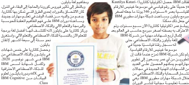
ولم تكن شركة IBM مترح عندما قالت إن الطورين من أي عمر يسعون إلى تطوير مهاراتهم ويكتفون بالحصول على العديد من الشهادات المهنية الجديدة في مجالات تشمل السلامة والذكاء الاصطناعي من خلال شركة مهارت مطوري IBM، وهي منصة تعليمية مجانية لتدريس الدورات

وتنقل وبتشكيل BlastDoor جرم تلك الحماية الأمنية الجديدة، وذلك وفقاً لجروس إلى حال التغييرات التي تم تنفيذها على مدار السبعين ضمن مشروع الهندسة المعمارية باستخدام Mac Mini M1 العامل بنظام iOS 14.3، والذي يتضمن حملات أمنية جديدة.