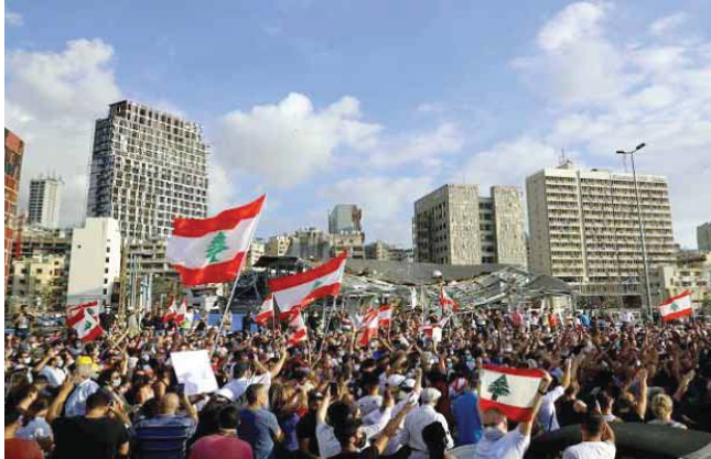
أميركية - أوروبية وتمجيد حسابات.

كشفت تقارير صحفية في تونس عن أن حركة النهضة تعيش على رقع الانقسام شامه كافة تشكيلات كتونكوفاط من قبل رئيس الوزراء الكلف هشام المشيشي. إذ لم يجبه «الأخوان» على موقف موحد بشأن دعمه أو الوقوف في تشكيل حكومة كتونكوفاط في تونس، لكن هذا الرأي لا يسلم من الانقسام من قبل إخوان الغدوني حتى إاز جرى تبنيه بشكل رسمي. ويصعب من نقل موقفه المشيشي بتسيرون. عن مصادر مقربة من حركة النهضة فإن الانقسام حصل من بين ريدو تاليد حكومة المشيشي على نحو حد، ومن منطلق الانقسام للعاصمة وإيرانك للصعوبة الوضع، ومن يرفض تاليد الحكومة المنسلة لان الحركة مستحضر خاوية الرفض. وأضاف المشيشي أن اللبانيين عن تاليد 80 بالمئة، ويقول هؤلاء أنه لا يريد في معارضة السلطة بشكل مؤقت، من أجل العودة بوقفة في وقت لاحق. ويغزو هؤلاء رأيهم إلى صعوبة الوضع الراهق في تونس، لأن فترات صعبة يسجدي اتحادها في الفترة المقبلة، ومن الأفضل في رأيهم، ألا يجري ربطها بالحركة لدى الرأي العام. في المقابل، يبدى انصار راشد الغدوشي رفضاً شديداً لحكومة المشيشي المرتفة، والسبب هو أنهم لا يريدون الذهاب إلى مؤتمر «النهضة» المغلق من بين مكاسب سياسية. أي وهم المعارضة، جرى تعيين هشام المشيشي، وزير الداخلية السابق في تونس، من قبل رئيس الجمهورية سعيد، لأجل تشكيل الحكومة. بعد استقالة إياس الفخفاخ، يقرب الشارع التونسي ميلا الحكومة، وسط هزات واسعة على الصعيد، في ظل أزمة اقتصادية توسفت بالاختلاف لاسمياً بعد استقار فيروس كورونا وتأثر قطاعات حيوية مثل السياحة.