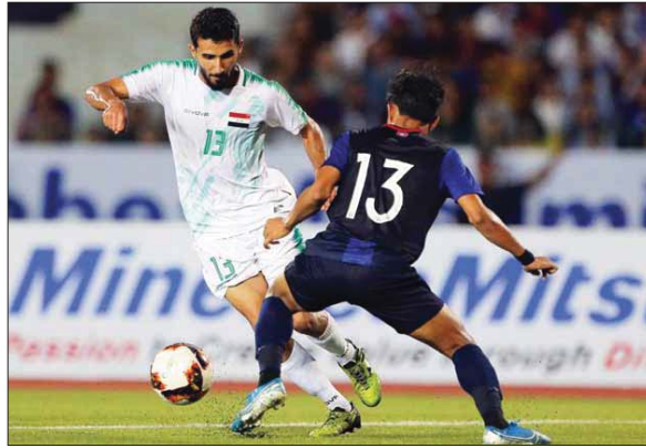
الحالي الجائحة كورونا المسجد في دول عدة، قرر الاتحاد الدولي والآسيوي لكرة القدم تأجيل المباريات المقبلة في التصفيات الآسيوية لكأس العالم 2022 في قطر وكأس آسيا 2023 في الصين، التي كانت مقررة