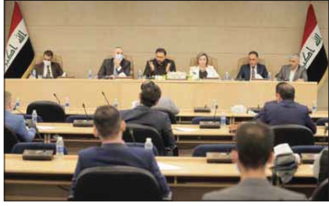
الكعمى خلال حضوره المنتدى الشبابى القائم على مجلس النواب

توزعت ما بين القطاع السياسى والتنفيذى والاقتصادى والاجتماعى تناورات العديد من المقترحات والمطالب التى تفتق لآول النواب الذين أكدوا أن محور اهتمام السلطة التشريعية فى الفترة المقبلة، خاصة أن جميعها قابل للتطبيق ولاهم هو أنها، كل الشكالت التى يعانى منها الشاب بشكل جزئى. وأشار النبان إلى أنه «تم الاتحاق على عدة توصيات من أهمها تشكيل لجنة مشتركة خصم السياسة شران لجنة الشباب والرياضة وممثلا شابا واحدا عن كل محافظة عراقية للعمل على تنفيذ بنود الوثيقة أملا، والسعوى لتنظيم ورش عمل والمقاب مع الوزراء والجهات ذات العلاقة حول بعض القضايا الهمة وتتابعه نتائج الفروض الشبابية والتشاور ومعدى فأعليتها، إضافة إلى فمناحة الحكومة لإعادة ارتباط مبريات الشباب والرياضة فى المحافظات بالوزارة كونهما من الوزارات السياسى وترعى شمرحة واسعة من المجتمع.