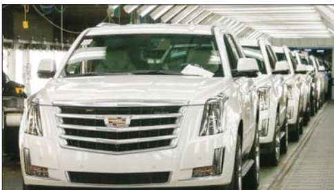
اتحاد عمال السيارات روي غامبل استعداد أعضاء النقابة البالغ عددهم 150 ألف شخص للعودة إلى مصانعهم في الولايات المتحدة وكندا.

عادت عملة صناعة السيارات لتترو مجدداً في مصانع ثلاثة من كبار شركات صناعة السيارات في الولايات المتحدة وهي «فورد»، «جنرال موتورز»، و«فيات كرايسلر»، إذ جرى فتح وتشغيل مصانعها في عيد الولايات بعد إغلاقها منذ أواخر آذار الماضي، بسبب إجراءات جائحة كورونا. لكنّ بعض الشركات كـ «فورد» تواجه مشكلات في سلاسل الإمداد لم تتمكن من تجاوزها حتى الآن وشرعت الشركات المذكورة لتطبيق إجراءات السلامة المهنية والصحية الجديدة للمساعدة في وقف انتشار الفيروس بما في ذلك قياس درجة حرارة العمال والزاهم بارتداء الكمامات الواقية وتنظام غسل الأيدي وتعديل دورات العمل، فضلاً عن تركيب جهاز يصدّر إشارة تنبيه في حالة تقارب العمال من بعضهم البعض باكتر مما يجب، وفقاً لقواعد التباعد الاجتماعي، كما سيستمر إغلاق الكافيتريات وغرف الاجتماعات وغيرها من أماكن التجمّع في المصانع لمنع تفشي الوباء.