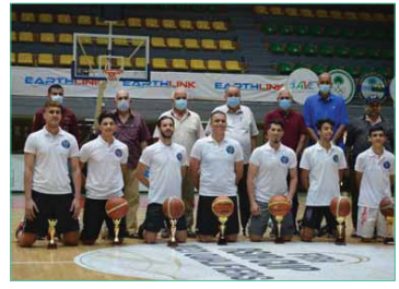
المنافسة بين لاعبي كرة السلة في مهرجان يوم الشباب العالمي

تعد بادرة جيدة لاستئناف النشاطات الرياضية، لاسيما انها شهدت مشاركة لاعبي المنتخب الوطني والشباب لافقا الى ان السابعة تضمنت فعاليتها البانك والرميات الثلاثية، من جانبه اشار مدرب منتخب الشباب محمد النجار الى ان المبادرة التي اقيمت ضمن مهرجان اليوم العالمي تعد الاولى التي يقبها الاتحاد المركزي، موضحا بانها ستسهم كثيرا في عودة الحياة الى الرياضة بصورة عامة والى كرة السلة ممارسة للعبة، مقدما شكره بضرورة خاضعة مستندا على اتجاح هذا التجمع الرياضي