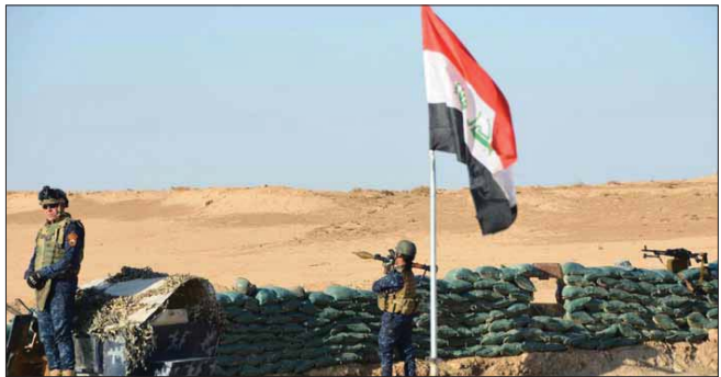
بغداد / شيماء رشيد / القاهرة / إسرائيل خليفة

بغداد / الصباح مجلس الأمن الوطنى، خلال اجتماع ترأسه رئيس الوزراء، القائد العام للقوات المسلحة، مصطفى الكاظمى، أن الاعتداءات التركية بعد تجاوزا كبيرا لكل معايير التعامل بين الدول ومرشا العلاقات حسن الجوار، وتهددا كبيرا للأمن الوطنى. وأكد أنه لا يكون مررا أو مررا فى العراق، وبمستخدام أراضيها منطلقا للقيام بعديات إرهابية ضد الدول الجاورة وبمخصوص تركيا.