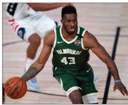
ما قدم باتيس اعترافه بقوله، لو عدت الى الوراء قليلا لما قسنت بما قمت به، مشيرا الى انه قام برد على اشر المنافس في دفاع واشنطن ويزاردز.

يواجه نجم ميلووكي باكس اليوناني باتيس انتيكوكومبو إمكانية الإيقاف على أسباب مشاركة فريقه في الوداع الاقصائية من اليليا أوف ضمن دوري كرة السلة الأميركي للمحترفين، بعد نطحه احد منافسيه خلال مباراة فريقه ضد واشنطن ويزاردز في مطلع الشوط الثاني من مباراة باكس ضد اشر مشادات كالمية ضد اشر الأخير موريس فائز، قام اليوناني بتوجيه نطحه الى منافسه، فما كان من الحكم الا طردهما من الملعب وسرعان