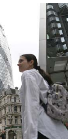
لندن / آ ف ب

ولكن من الممكن أن يحصل تغيير في النهج، على غرار ما فعل رئيس الحكومة «باركليز» جيس ستانلي، فستأخذ التي اعرب عن استيائه من كون 60 ألف شخص يعملون على طاولات المطبخ، في يومهم، تبنى أن يعود الموظفون إلى أعمالهم، واعتبر حتى أن قمة «مسؤولية جيسال» أماكن كاتاري وارف ومانشستر وغلاسغو.