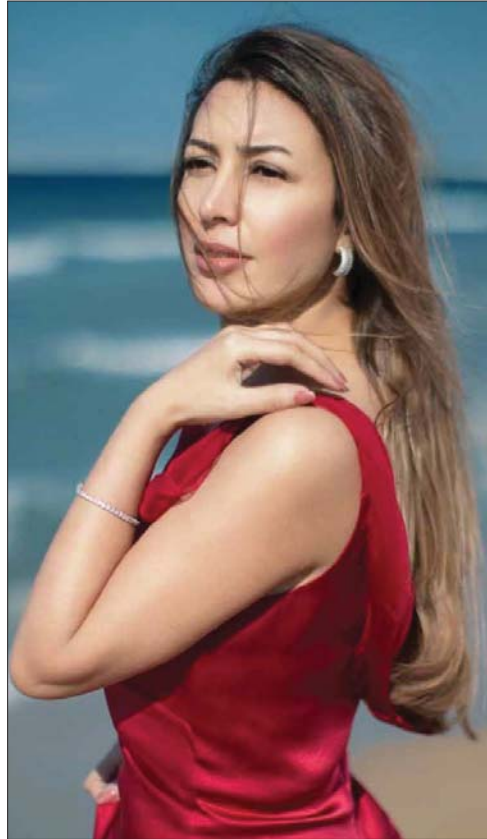
تستعد المطربة جنت لطرخ أغنية جديدة بعنوان "أنا في انتظارك" خلال الأيام القليلة المقبلة.

هذا كان في زمن يخترع التخصص ولا مقاساته الحادة، إلا أن هؤلاء الملحنين لم يستطيعوا أن يكتبوا رغباتهم من النفاذ إلى ناظمة الجمهور. لم تشوق هذه الظاهرة عند تخوم عقد السبعينيات إنما امتدت إلى فترة الثمانينيات والتسعينيات وبرزت بشكل أكبر وظهرت على الساحة الفنية ظاهرة "المطرب الملحن" مثل الفنان كاظم الساهر ورائد جورج ومهند محسن ونديم عبد الحسين وحسين البصري وصباح الخياط وباسم العلمي وقاسم ماجد وعائذ اللمشد، وغيرهم. أما في الفترة التي تلت عقد التسعينيات، فلم يعد الملحن يشعر بالحرر وتجاوز الحدود الفاصلة بين منطقة التلحين والغناء، ففسل إلى ساحة الغناء، الكثير من الملحنين ومنهم: علي بدر وصابر ونصرت البدر ووليد الشامي وسيف عامر وسيف نبيل وسامر أحمد، وغيرهم. النقطة الجديرة بالاهتمام، إلا أن الملحن المؤهب والذي يمتلك خيالاً وروية، إلا توفر مع هذه المؤهلات صوت جميل، فإنه يسهم في تأكيد حضوره على الساحة وانتشار اغانيه، لذلك برزت أسماء، وحيد أخرى، رغم قوة مؤهلاتها اللحنية، لأنهم لا يمتلكون الصوت الجميل والوئس الذي يمكنهم من تقديم أعمالهم، مثل الملحن محسن فرحان، فقلبه أغنية أعمال كبيرة ومهمة في اللحنية العراقية، لكنه لم يزل شهرة وحضور أقل.