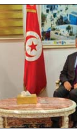
● جانب من اللقاء

البلدين، وإن الخبرات التونسية يمكن أن تدعم قطاعات الصناعة والتجارة في العراق» لافتاً إلى أن «التعاون بين البلدين يخلق تكاملاً