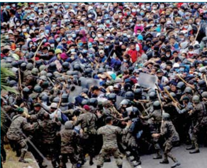
• صدامات في حرس حدود غواتيمالا والمهاجرين الهندوراسيين