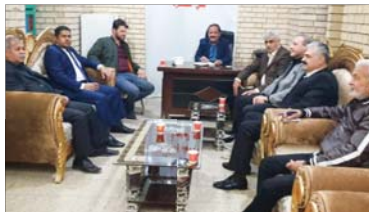
• اللجنة التحضيرية للمهرجان