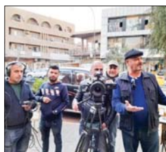
• من كواليس الفيلم

يواصل المخرج سمير النجم العمل بتصوير فيلمه الروائي «أنا احب الكراة»، سيناريو كاظم مرشد المسلمون وانتاجه رائسة السينما والمسرح. تدور فكرة العمل حول التعايش المجتمعي في الكراة على مر الأزمان والعلاقات الرصينة بين مختلف الانبائ والطوائف والأماهب، وكشفت النجم عن ان الكراة تنبش بالحمية في كل زمان رغم الازهار التي طأها والتفجيرات، الا انها اصرت ان تبقى على قيد