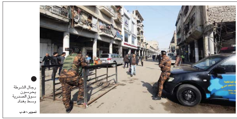
رجال الشرطة يحرسون سوق الصدرية وسط بغداد

طالب الأمين العام لمجلس الوزراء، حميد نعيم الغزي، الفريق الاستشاري للجنة الحكومة الإلكترونية بوضع برامج الخدمات العامة ضمن أولويات خطة العام الحالي لتطبيق مشروع الحكومة الإلكترونية على أن تشمل خدمات واقعية أصححة المواطن، جاء ذلك خلال ترؤسه