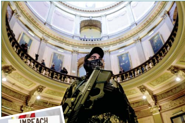
• متطرف يمشي خلال احتلال مبنى حكومة ولاية ميشيغان

شهد استعراض نفوذ غينغريش لخصلاته رئيسا لمجلس النواب والمحاربة الفاضلة لعزل الرئيس بيل كلنطن وحرب جورج بوش غير القانونية على العراق، وتسبب كل ذلك بتقويض الأيمان بالطبقة السياسية، وأدت نهاية الحرب الباردة إلى إزالة القوة الموحدة للعدو المشترك، وجاءت بعدها الأتمتة والعولمة وأزمة 2008 المالية لتدمر مجتمعات كثيرة وأجعت نيران الاحساس بالظلم والغضب من الشعب. سادت بعد ذلك الحكمة العليا قانون «الوطنون التخنون» عام 2010 والذي رفع قيودا كثيرة على الجماعات الخارجية المؤهلة للانتخابات، ويقول المتفقون أنه وجه الثغور السياسية نحو التشريعين نيويورك والشركات والصالح الخاصة، ويوجد تقرير من مركز بريان المستقل بجامعة نيويورك أن مجموعة صغيرة جدا من الأميركيين يملكون «نحو أكبر من أي وقت مضى منذ فضيحة ووترغيت، بينما يتعد الآخرون عن السياسة» بينما كلفت انتخابات 2020 نحو 14 مليار