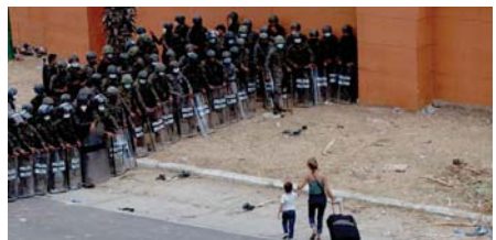
• مهاجرة هندوراسية وأولادها يوجهان حاجز أمني بشرى من شرطة غواتيمالا