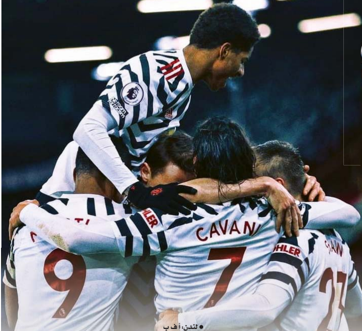
● لندن: أ ف ب

يخوض مانشستر يونايتد تحدياً جديداً عندما يضيف في ملعب الاولد ترافورد شيفيلد يونايتد في سعي من الشياطين لمواصلة الحزف نحو استعادة اللقب الغائب عن خزائن النادي منذ رحيل مدربه الاسطوري السير اليكس فيرغوسون.