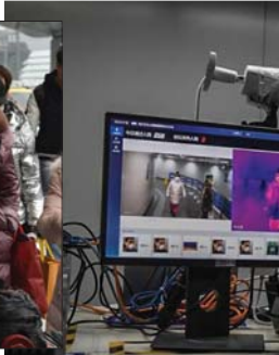
يكن / أ ف ب