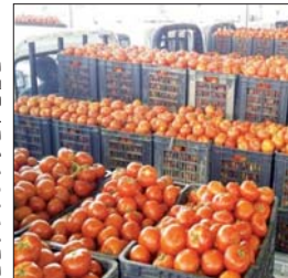
● محصول الطماطم المعرض في الأسواق المحلية

ويين رئيس الهيئة الدكتور كاظم العقابي في بيان صحفي تلقى "الصباح" نسخة منه أمس الأحد أن بآثره اتخذت إجراءات عدة بعد مناقشة مزارعي محصول الطماطم في قضاء الزبير بمحافظة البصرة، مبيّنة أن الأجراء تأتي للحد من هذه التجاوزات والالتزام بالوزنات الزراعية المقررة من خلال التنسيق مع الجهات الرقابية ممثلة بالجريمة