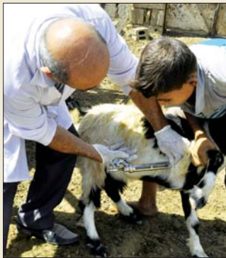
● حملة لتلقيح الأشغال والماعز