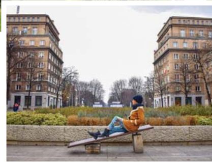
منظر من المدينة اليوم

أصبحت "نوا هوتا-Nowa Huta" (التي كانت يوما ما المدينة الجديدة الأكثر صلوحا على الإطلاق) الآن منمنقة متهاككة في كراكوف، وهي التي كانت تعرف "بجنة عدن الاشتراكية". عندما حل عالم ما بعد الحرب العالمية الثانية حظيت بريطانيا بدمن جديدة مثل "باسيلدون" و"هميل هامستيد" و"ميتون كينز" وغيرها، أما بولندا فقد حظيت بمدينة "نوا هوتا". ولدت تلك المدينة في ذات الحقبة التي أعطت لبريطانيا نظام التأمين الصحي الوطني ودولة الرفاه الحديث، وكان قانون المدن الجديدة لسنة 1946 برنامجا طموحا لتخطيط التجمعات السكنية. إذ خطط للمدن الجديدة عموما أن تكون علاجا لانتكاظ المدن الصناعية الكبرى، ومنع نمو وتوسع لندن إلى الخارج، وأخيرا (ويشكل حاسم) توفير مساكن لمن فقدوا منازلهم بعد القصف وثيران الحرب.