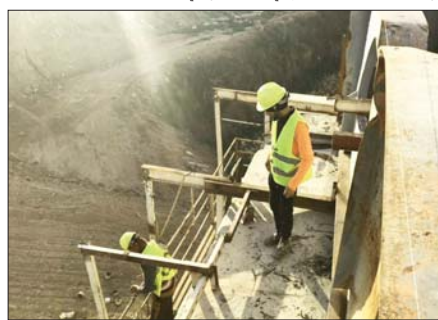
● أعمال تأهيل لأحد الجسور

وأردف المصدر أنه تم بهذا المجال توزيع 36 ألفاً و 205 قطع أرض بين ذوي الشهداء والجرحى، فضلاً عن بيع الألاف من قطع الأراضي في الوطنيين وفق البداة 25 ألفاً مبيعاً وإيجار أسواق الدولة، علاوة على إنجاز 21 مشروعاً مختصاً بقطاع الإسكان في