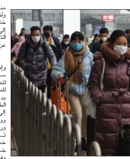
النظام صافرة انذار تستدعي عملية فحص أخرى من قبل موظفي الحطة.

ورغم أن المدينة تخضع لحجر صحي تام منذ 23 كانون الثاني، إلا أن نحو خمسة ملايين مسافر غادروا وهان خلال مهرجان رأس السنة القمرية، وفق حاكم المدينة، وهو ما دفع السلطات للقيام بعمليات بحث على مستوى البلاد عن كل من زاووا وهان مؤخراً. ومع ذلك، لا تزال معظم عمليات تفقي الأثر التي تجريها السلطات المحلية في الصين بحاجة إلى قوة بشرية كبيرة، رغم أن البعض يتخلل البيانات عبر الإنترنت للمساعدة الخاصة في تسجيل المعلومات خصوصاً مع عودة السكان بعد العطلة.