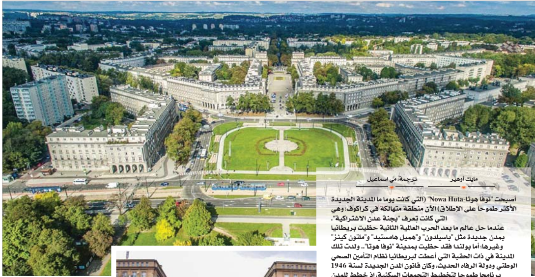
مايك أوهير ترجمة: مي اسماعيل

أصبحت "نوا هوتا-Nowa Huta" (التي كانت يوما ما المدينة الجديدة الأكثر صلوحا على الإطلاق) الآن منمنقة متهاككة في كراكوف، وهي التي كانت تعرف "بجنة عدن الاشتراكية". عندما حل عالم ما بعد الحرب العالمية الثانية حظيت بريطانيا بدمن جديدة مثل "باسيلدون" و"هميل هامستيد" و"ميتون كينز" وغيرها، أما بولندا فقد حظيت بمدينة "نوا هوتا". ولدت تلك المدينة في ذات الحقبة التي أعطت لبريطانيا نظام التأمين الصحي الوطني ودولة الرفاه الحديث، وكان قانون المدن الجديدة لسنة 1946 برنامجا طموحا لتخطيط التجمعات السكنية. إذ خطط للمدن الجديدة عموما أن تكون علاجا لانتكاظ المدن الصناعية الكبرى، ومنع نمو وتوسع لندن إلى الخارج، وأخيرا (ويشكل حاسم) توفير مساكن لمن فقدوا منازلهم بعد القصف وثيران الحرب.