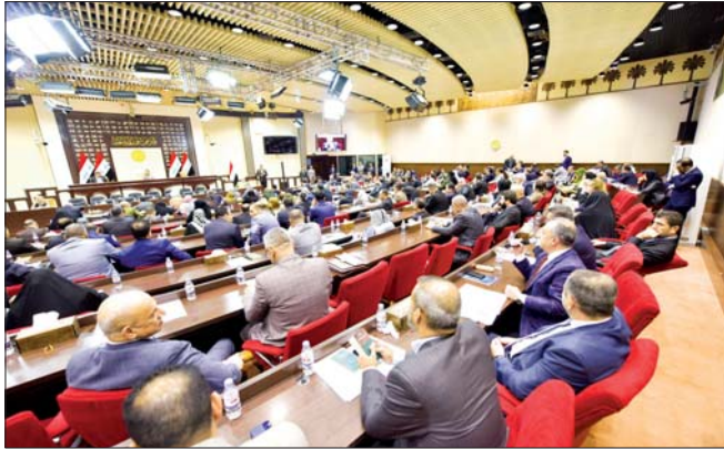
جلسة برلمانية سابقة... أوشية