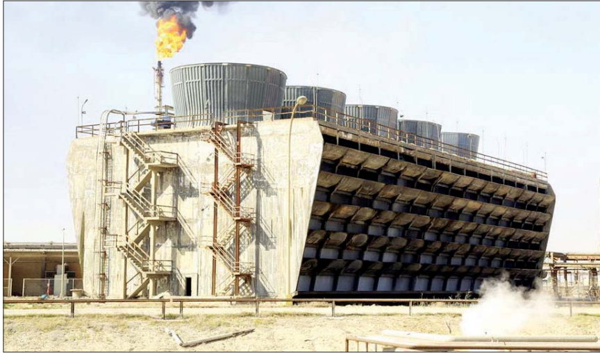
● مصنع البتروكيمياويات في البصرة

مثيلة لما موجود في دول هولندا وبريطانيا، مشيراً إلى أن المنشأة المتحركة التي اعتبرها الاعراب في الشرق الأوسط تتكون من برجين يرتفع 60 متراً ووزن 150 طناً لكل منهما، أما الجسر الوسيط المتحرك فيبلغ وزنه 300 طن، ويمكنه الارتفاع إلى 60 متراً لتر من تحت السفن، ويعاود التزول ليصبح جسراً في حال عدم وجودها.