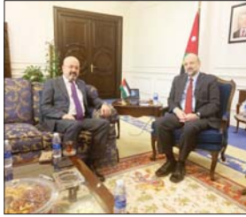
عمان / يعرب السالم

التقى السفير العراقي في عمان، حيدر العزاوي، رئيس الوزراء الأردني عمر الرزاز، في إطار مساعي تعزيز التواصل والعلاقات الثنائية بين البلدين الشقيقين. وأكد الرزاز على عمق العلاقات بين البلدين والعمل على تحقيق المزيد من التعاون والشراكة بما يخدم مصالح الشعبين مشيراً إلى أهمية تدليل العقبات في مجال التبادل التجاري والفرص الاستثمارية المتبادلة والنشاط الاقتصادي. من جانبه لفت العزاوي إلى أن العراق حريص على المضي قدماً لاجل علاقاته مع الأردن الشقيق أكثر مثانة وفاعلية لا سيما في المجال الاقتصادي، مستعرضاً حجم التبادل التجاري بين البلدين بناءً على البيانات التي تتوفر لدى السفارة العراقية في عمان.