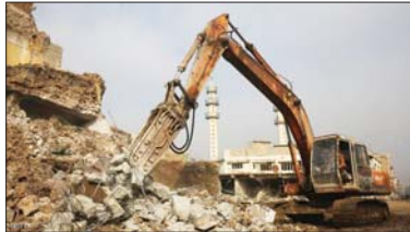
مشروع عمرانية في الموصل