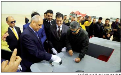
جانب من وضع الحجر الأساس للمشروع

وضع وزير النقل عبدالله لعبي، أمس الأحد، الحجر الأساس لمشروع (نفق الحرير) في محافظة البصرة / خور الزبير، بينما أشار إلى أن النفق مصمم بعرض ثلاثة مترات بكل اتجاه مع ممر خاص بالخدمات والطوارئ. وقالت الوزارة في بيان تلقت "الصباح" نسخة منه - أن وزير النقل وضع الحجر الأساس لمشروع (نفق الحرير) في محافظة البصرة / خور الزبير، بحضور وزير التخطيط ورئيس لجنة الخدمات الترابية". وقال لعبي خلال البيان: "سنباشر المرحلة الأولى من مشروع إنشاء نفق قناة الزبير (حوض تصنيع القطع الخرسانية) بموجب العقد المبرم مع شركة دايور الكورية وبإشراف شركة تكتال الاستشارية الإيطالية". مبيناً أن "النفق يعتبر الأول من نوعه في الشرق الأوسط كنفق للمركبات تحت الماء، بطريقة صب وتعيم القطع الخرسانية وتزويرها إلى قاع القناة".