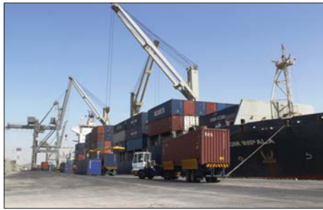
● حركة البضائع في ميناء ام قسر

من جهة، وبتعم استيراد المواد التي تنتج محلها وكذلك التي لا تطابق المواصفات العراقية". واكد الشهباني "ضرورة ان توفر شركات رصينة لدى القطاع الخاص، وان تكون لديها تكنولوجيا تفحص من فحص البضائع"، مبيها ان "ذلك التوجه يأتي لصالح دعم القطاع الخاص".