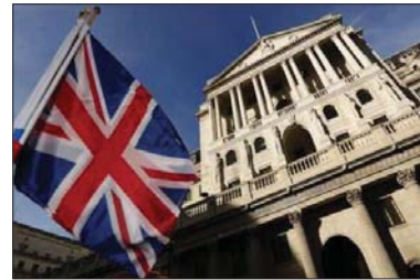
● الاقتصاد البريطاني

وكشف البنك المركزي برنامجه لشرء، السندات الى قرابة 900 مليار جنيه إسترليني في تشرين الثاني، وقال