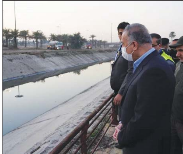
● رئيس الوزراء يطلع ميدانياً على مشروع قناة الجيش