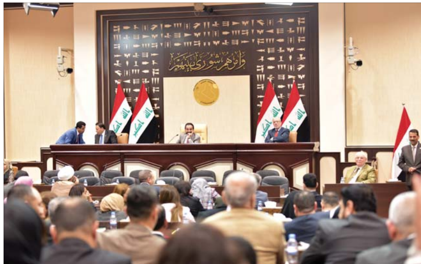
جلسة برلمانية سابقة. إرشيف