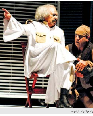
الطفن مع مسرودة عزرايف - ارشيف

أ.د. باسم الاسم ساد في الآونة الأخيرة، نط من الأعمال الفنية التي يعطل عليها جرفاً (مسرحية) وهي في منى عن المسلمات البيديه للعرض المسرحية التي في حدودها الدنيا، وقد تراحت بين الإعداد والتوليف والانتاج وسوى ناله، بدعوى الخروج على توابت النص بدافع الحدائة وما بعدها، وإن التشظي وعدم الضوح واللا انتظام وانفلات الإيقاع والرقابة والأداء العشوائية وغيب العنفة والجمال، أهم ما يميزها. وربما يسأل القارئ ويقول: لماذا الذي بقي فيها بعد كل ذلك المخذ الفنيّة والنقدية؟ أقول: لم يبق سوى الفوضى العارمة والصراع والنفق أو الدوران حول الأواء والتشابيه... إلخ. إن العروض المسرحية المنتج يفسر - بالضرورة - كرافة وعي المخرج وغنى الشخصية، وكثافة حسه وقوة بصورته، وجمال بصوره، وعظم ثقافته وسلامة نوقه، ولقد كشفت لنا العديد من العروض التي شارك بعضها في المهرجانات، ضحلة مستسوها، وفقر صومونها، وسرعة إنجازها، وضعف ماعناتها الفنية والجمالية والفكرية. وتجدر عرض أغلبية الطلبة التي لم يكتمل نضج بعد كل ذلك الإطّار لما تمّ تأسيره هنا، والسبب واضح جداً، إذ أن الطلاب بما في ذلك الذي يدرس في معاهد أو كليات الفنون الجميلة، من غير المعقول أن يخرج عرضاً مسرحياً يبين للجميع لوقه إخراجه وكأنه قصة، وجالية سينوغرافية، وإن وكان الاستنقاء، وإرادة ولكنه خضع جداً على صعيد الواقع التطبيقي. في حين إن اكتشاف الطلبة على مستوى القدرة والإخراج والتخييل والالتزام، فلا يكون مغزاهم بأسماءهم، ممن تخرجوا في معاهد وكليات الفنون الجميلة سابقاً، وكذلك الاستنقاء، فحمة فقرات فورية، واضحة، ومبهمة، مما يتعكس ذلك على وطأة إنتاج المسرحي، مع يقينا المطلق