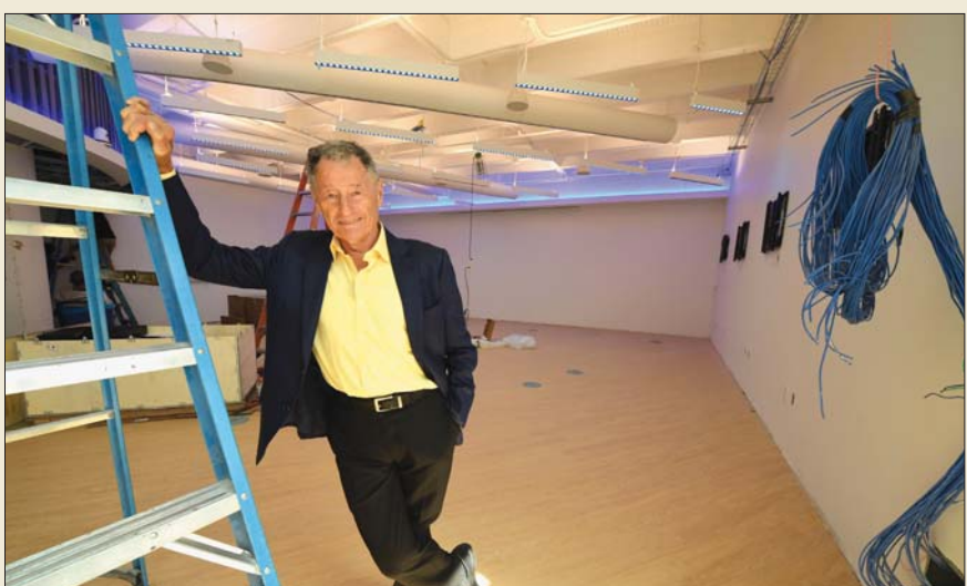
الدكتور ليوارد كلاينبروك يقف بجانب أول معالج لواجهة الرسائل (MP) في مختبر، في جامعة كاليفورنيا في لوس أنجلوس.