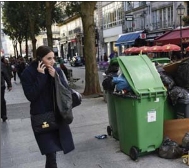
أينما تسير ستجد أممات أكوام القمامة وقد ملأت الشوارع

برونو ريث < ترجمة: ايندا ادور > في باريس، انطلقت وبشكل جدي حملة الانتخابات البلدية، فإن كان هناك شك بسلامة أي شخص من ذلك، فما عليه سوى الألق نظرة على ردد الأفعال التي أثارها مقال صحيفة الأوبريفر البريطانية مؤخرا حول "مخاداة" العاصمة الفرنسية والذي أدار عنوانه مدينة باريس بوصفها "رجل أوروبا القدر". فقد كتبت كيم ويشير، أنه وبالرغم من جهود سلطات المدينة لتحسين نظافة الشوارع، إلا ان تلك القضية لا تزال تروق للبريسيين.