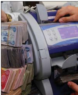
قروض متنوعة لكثافة شرائح المجتمع