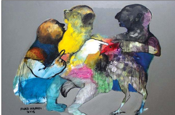
من أعمال الفنان فؤاد حددي

الغفساتيون ويقول معهم مذبذب افكارهم ده. لو رويت، عن اصنام الغرافيتي التي لم يسبق فيها غورها، والتي تتطلع إلى ساعة تتحدر يسير في المسقط؟ لا نحنا كبريانا العديدة وتزمتنا، إلا نشعر جميعاً في يوم، في ساعة برقية لأن نهم، لا نتسكك؟ خطاً أن نرى الظاهرة بسيطة غير مهمة، في نزوع انساني للاحتفاظ بسلامة الذات وقد تصل للاحتفاظ بانسانية الانسان لا احد يريد أن يُفقد عليه، وآل أي رزق، وإضحا وسواء بين زملاء العمل أو زملاء الكتابة أيون الناس، هو يريد ذاته الواضحة التي لا تنمو في العمل يصل حدًا تنهض عنده الروح لتقول "كفى، أريد أن أستريح" لا أريد أن أفرق، لا أريد أن أمشي وأعيب، أريد نفسي سبياً آخر، طريقاً، لنجد انفسنا متفرقة بكون هذا التسكع جماله وبيضاة ومنه في الزحام، تريد، ناهيا الثقافة المتحررة تريد "لا تشابهها" أو "استبدلها" تريد أن تكون "رقماً" في حشد مائل أو قائم شبيهة بسواها في زحام كبير؟ قد ألم يقل