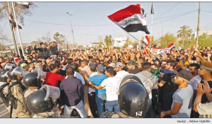
تظاهرات سابقة - شريف