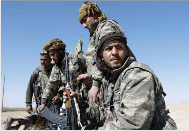
مردّد مقاتلي قوات سوريا الديمقراطية في طريقهم إلى ساحة العمركة

ملحين وانفصاليين. واستخدمت تلك الفصائل القوة لإساءة التعامل مع السكان. وأورد الناشطون المحليون عشرات الحوادث المتعلقة باعتقالات غير قانونية وحالات تعذيب واختفاء، للأفراد، بحسب منظمة هيومان رايتس ووتش. ويعد ساعات من بدء القوات الأميركية بالانسحاب من موقعها داخل سوريا، أصعد قسماً جلياً يتهم فيه الأميركيين بعدم الإيفاء بمسؤولياتهم تجاه مدنييها. وأضاف البيان أن الهجوم تركيا غير اللبرد على أرضنا سيترك سبباً له تأثير سلبي على قتلنا ضد "عاشق" وعلى الاستقرار والسلام الذي أوجدناه في المنطقة خلال السنين الأخيرة، ولكننا نطالب قوات تحمي أرضنا، نحن مسمون على الدفاع عن أرضنا مهما بلغت التضحيات. وصرّح كينزو جرينل، المتحدث باسم قوات سوريا الديمقراطية، خلال لقائه بأحدى القوات الفصائلية العربية، أن قرار تراس بالانسحاب قد مثل صدمة للإكراد، وأصفا إياه بأنه "طعنة في الظهر".