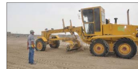
فوز اراض / ارفش

تدخل حين التنفيذ اليوم الاثنين مبادرة السكن الوطنية التي أطلقها رئيس الوزراء عادل عبد المهدي والخاصة بتوزيع قطع الأراضي السكنية بين المواطنين من المستحقين، إذ أعلن مدير عقارات الدولة الهادي الربيعي أنه سيجري توزيع أربعة آلاف سند لقطع الأراضي المخصصة لبناء محافظة البوثنانية كدفعة أولى ضمن المبادرة، ليها محافظة البصرة غداً الثلاثاء، بالبعد نفسه من قطع الأراضي، كما أعلن وزير الداخلية ياسين الياسري تخصيص 3 آلاف دونم لتوزيعها كقطع أرض سكنية بين منتسبي الأجهزة الأمنية في البصرة، بينما كشف وزير العمل باسم عبد الزمان عن توجه الوزارة لتنفيذ مبادرة مجلس الوزراء الخاصة بمنح مستفيدي الحماية الاجتماعية ودوي الإعاقاة أراضي سكنية. وقال مدير عقارات الدولة احمد الربيعي في حديث لوكالة الأنباء العراقية (واع) إنه اليوم الاثنين سيتم توزيع أربع آلاف سند قطع أرض مخصصة لأبناء محافظة البوثنانية كدفعة أولى ضمن مبادرة السكن الوطنية (في المحافظة). وأضاف أن يوم غد الثلاثاء سيتم توزيع سندات أربعة آلاف قطعة أرض مخصصة