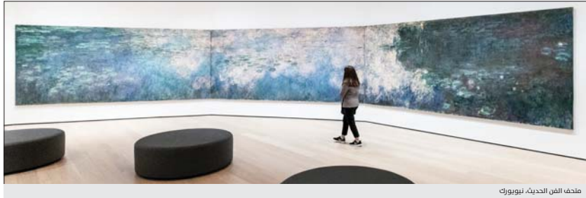
متحف النوبل، نيويورك