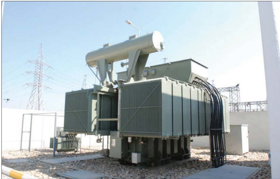
محطات لتوليد طاقة متجددة متوقفة الشبكة