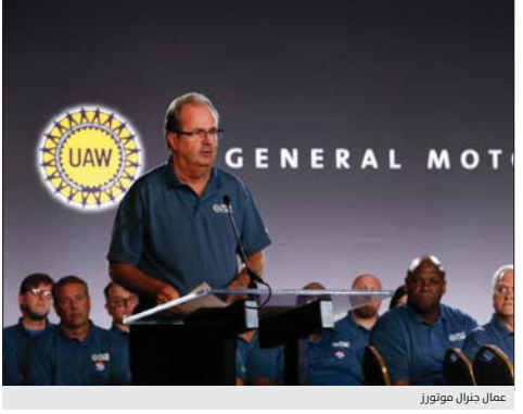
عمال جنرال موتورز 5400 فرصة عمل جديدة وينهم الطرفان أيضاً لصفقة عمالة جديدة في الساعات الأخيرة قبل انتهاء مدة العقد الحالي لكن النقابة أوضحت أن اقتراح جنرال موتورز ليس الحل في الحالات الرئيسية بما في ذلك الرعاية الصحية، واستخدام العمال المؤقتين وطول المدة التي يستغرقها الأعضاء، الأخصر مدة الوصول إلى أعلى الرواتب، وتسعى النقابة إلى الحصول على رواتب أعلى للعمال البنتيين الذين يصلون حالياً بأقل من 20 تقديماً للفروض. قائلًا أن جنرال موتورز ليس لديها خيار آخر غير التفاوض، ويصنعون في لورديستان في الساعة خلال 4 - 3 سنوات، تبلغ نحو 30 دولاراً في الساعة.

عروض استثمارية ردت جنرال موتورز بأنها قدمت لقناة العمال عمالاً مرساً سنخياً للاستثمار في ثمانية فصائل في أربع ولايات، بما في ذلك إنتاج سيارة جديدة (سيان) في مصنع سيارات ديترويت-هامترايم، الذي كان من المقرر أن ينتهي الإنتاج بـ مطلع العام الجديد. كما تحفظ الشركة لإقامة أول مصنع لبطاريات السيارات الكهربائية في الولايات المتحدة في مصنعها في لورديستان (أوبايو)، إذ سبق وطلعت جنرال موتورز مصنعاً الذي كان فيه ثلاث نباتات عمل مؤقتة لتصنيع سيارات شيفروليه كروز الجديدة، كما عرضت «موتورز» على العمال مكافأة بقيمة قدرها 3 ملايين دولار لكل عضو أول صادقوا على الصفقة، بالإضافة إلى مكاسب الأجور و 20 مدفوعات المبلغ الإجمالي في كل السنوات الأربع القادمة، وتقول الشركة إنها تقدم عرضاً إيجابياً، مع سمات الأعضاء، في الرعاية الصحية كما هي في العقد الحالي.