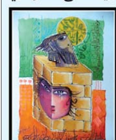
عدنان الفتوية علاف الكتاب

الخصمة بالمرأة الباكور والمنزوجة والمطلقة، ولم بأسفر حورباي عن تشريح قوانين تخص المرأة