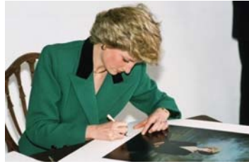
أميرة ويلز توقع في قمة سانت جورج في شبونة

وكان التغيير الصادم في وصية ديانا هو التغيير في خطاب رغباتها، فبدلا