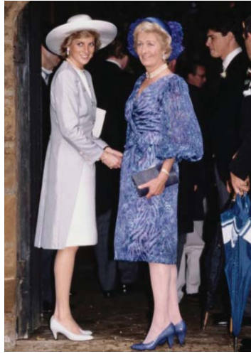
ديانا، أميرة ويلز مع والدتها فرانسيس شاند كيد في حفل زفاف تشارلي ديانا

وكان التغيير الصادم في وصية ديانا هو التغيير في خطاب رغباتها، فبدلا