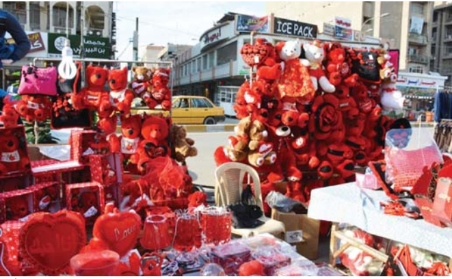
● منظر عيد الحب في بغداد

أقرت منظمة "إنهاء الإفلات من العقاب" بأن الانتهاكات التي ترتكب ضد الأسرى في بعض المناطق سببها (مجموعات محسوبة على القوات الأمنية، في حين طالبت مفوضية حقوق الإنسان في العراق بضرورة تفعيل القوانين العقابية الرادعة في المؤسسات العسكرية والأمنية لمنع تكرار مثل هذه الحالات. وقال رئيس المنظمة عن الجيزاني: إن الانتهاكات التي ارتكبتها مجموعات (محسوبة على القوات الأمنية العراقية كثيرة، وتداولها الإعلام الغربي ومراكز الدراسات وشككت ضغطاً على الحكومات العراقية السابقة التي كانت تتحجج وأتصفاً بتعديلات الحرب على (داعش). وأضاف الجيزاني في حديثه للصباح: أن "الجميع يعلم بوجود سلف المجرمين قسراً والقبائل المماثلة التي عززت عليها المبادئ الدولية، وهذه الانتهاكات بقيت رهن التعتميم والتسويات السياسية، والعراقيون هم من يدفعون الثمن". وسبّح أن التقدم (عمر نزار) هو مهم واحد في منظومة تمتد على مقبلة الأجل وإماتة الناس وتطبيق القوانين، ويمكن الخارج على العديد من الآلة الموقفة لهذه الانتهاكات من مصادر مختلفة".