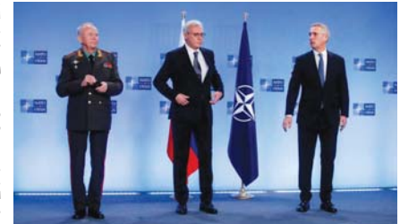
ينس ستولتنبيرغ مع مسؤولين روسيين

مثل أوكرانيا، وتريد موسكو أيضا أن يسحب الناتو قواته من دوله الأعضاء بالشرق. يجد الحلف من الصعوبة قبول هذه المطالب، وأكد ستولتنبيرغ أن لكل دولة الحق بالاختيار مسارها الخاص بها، وهذا المبدأ الأساسي جزء من أساس الأمن الأوروبي، وفي الوقت نفسه،