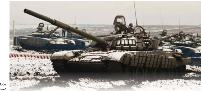
ديابرة روسية على الحدود الأوكرانية

الم تكن واضحة؟ على الرغم من أن رغبات الأميرة ديانا