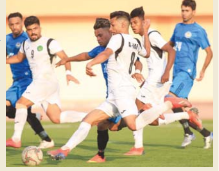
بغداد / طه كمر

ولغت كاظم إلى ان بقاء الدوري واستمرارية مبارياته مضيبان بغائفة فنية كبيرة على المنتخب الذي أخفق مؤخرا في خطف لقب خليجي 24 بعد ان كان يتنازل اليد، عاذا شجاعة الاتحاد المركزي لكرة القدم تتجسد باستمرارية الدوري الذي يعد العمود الفقري لجميع رياضات العالم، فضلا عن ان استمرارية الدوري ستجر البلد وما يعاناه الاحاد ان يسرع في اقرب وقت لاستئناف الدوري بحلول من شأنها ان تعيد الحياة للاعبينا.