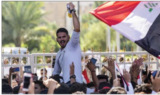
تظاهرة طلابية في البصرة... الرشيد