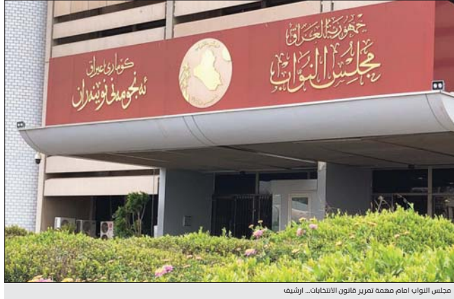
مجلس النواب امام معمة تمرير قانون الانتخابات... ارضيف

يخضع مجلس النواب اليوم الأربعاء جلسته الاعتيادية للتصويت على مشروع قانون الانتخابات، وأكد رئيس المجلس محمد الحلبوسي خلال اجتماع مع رؤساء الكتل النيابية على ضرورة التوصل إلى اتفاق على قانون يلبي طموح الشعب العراقي وتطلعاته، ويعيد بناء الثقة المتأخرين، وبما يضمن عملية انتخابية نزيهة وفتحاً حقيقياً للمواطنين العراقيين في عموم أنحاء العراق، وكشفت مصادر برلمانية عن حصول توافق على خيار اعتماد أن يكون الفائزون في الانتخابات من الحاصلين على أعلى الأصوات بغض النظر عن فوائضهم ونسبة 100 بالمئة.