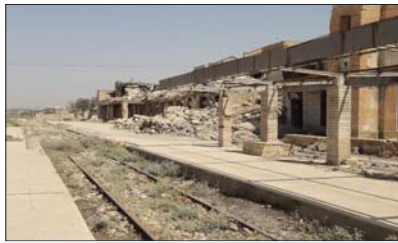
آثار الدمار الذي لحق بمحطة قطارات الموصل جراء أعمال داعش الإرهابي... الرشيد

وتعاون مع شركة السعد الهندسية لفتح المسور الجيوي الرباط بين الكسك وناحية ربيعة التي تسيطر بعد تخيرونه خلال العمليات المسلحة لتحرير ناحية ربيعة والكسك من جردان داعش الارهابي، لاقت الى ان الفرق الهندسية تستعد لاعمار الجسر الرباط بين قصاي لتفقر وسنجان مطلع العام المقبل.