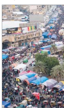
جمود برلمانية لتبرير قانون الانتخابات استجابة لدعوات الشارع والمدرعية...

بأعلى الأصوات، فضلاً عن تمديد نوابي متعددة في المحافظة الواحدة» مؤكداً ان «جميع هذه المطالب تمثل إرادة الشعب».