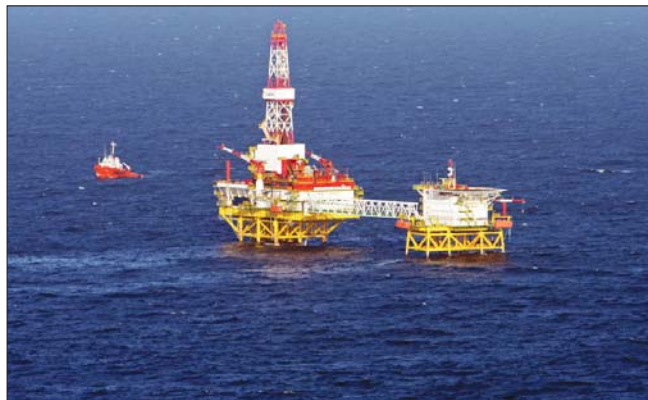
حقل غاز في البحر الأبيض المتوسط

تحجّل "دعاش أوروبياً" الى ذلك والاصوات برارة الخلفية التركية تحجّل عناصر داعش الإرهابية من حملة العمليات الجوية الأوروبية الى دولهم وقالت الوزارة في بيانها منفصلة: انها رحلت ارمينيا الى اليونان، كما رحلت 11 ارمينيا آخرين الى فرنسا، واقدمت المناخلة التركية منذ 11 تشرين الثاني الماضي على ترحيل ما لا يقل عن 72 ارمينيا الى دول اوروبية وغربية قدموا منها الى مناطق الصراع في سوريا والعراق قبل ان يقفوا في قبضة القوات التركية.