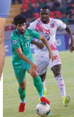
بغداد / ف ب

الفوز والكلاسيك الودي بولندا والباية الهندية وتكون اياها الثلاثة الاولى لعم التدريب واليومان التقنيان للتكريم وبحق للشرق التسجيل في التدريب والتحكيم لأمدة واحدة فقط ويمنح اشترك شهادة لكل دورة مصدقة من قبل الاتحاد المركزي لبناء الاجسام، وتتضمن شروط المشاركة في الدورة ألا يقل عمره عن 23 سنة وان يكون مشتركاً في دورة او بطولة سابقة او خريج تربية رياضية وتشمل رسوم كل دورة 150 ألف دينار ويكون مجموع اشترك الدورتيين 300 ألف دينار.