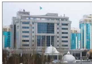
العاصمة الكازاخية نور سلطان

اعلن المتحدث الرسمي باسم الخارجية الكازاخستانية، ابيباك سعادياروف، وصول جميع الوفود المشاركة في الجولة الـ 14 من مفاوضات صيغة أستانا حول سوريا إلى العاصمة الكازاخية نور سلطان. قال سعادياروف الصحفيين لقد وصلت جميع الوفود، وستبدأ اللقاءات الثنائية والثلاثية قريبا". وأشار الى ان سفير الأون في كازاخستان سيرس ودف بالرده التي تشارك كطرف، وفقا للمتحدث الرسمي باسم الخارجية الكازاخستانية، فان احمد التوما ورئيس وفد المعارضة السورية في اللقاءات ويتكون من 12 شخصا، جدير بالذكر ان لقاءات الجولة الـ 14 من مفاوضات صيغة أستانا حول سوريا ستستمر يومى اسس الثلاثاء، والأربعاء. ومن للفر وشراكة وقود الدول الضامنة (إيران وروسيا وتركيا)، وكذلك والحكومة السورية والمعارضة المسلحة السورية. كما يشارك ممثلون رفيعي المستوى من الأردن ولبنان والعراق، وكذلك وفد الأمم المتحدة برئاسة المبعوث الخاص للأمم العام للامم المتحدة إلى سوريا، غير بيترزسون.