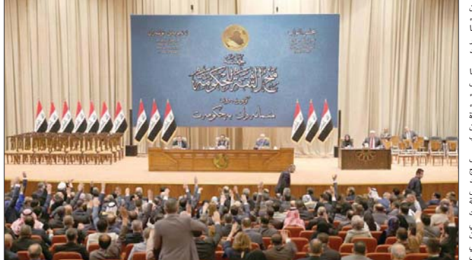
جهد ورئاسة برلمانية لتسمية رئيس الوزراء الجديد...