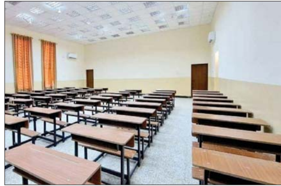
• صف في مدرسة تم افتتاحها حديثا

في بغداد، طالبوا وزارة التربية في خلال رسالتهم التي تسلمتها 'الباب المفتوح' ببناء مدارس جديدة