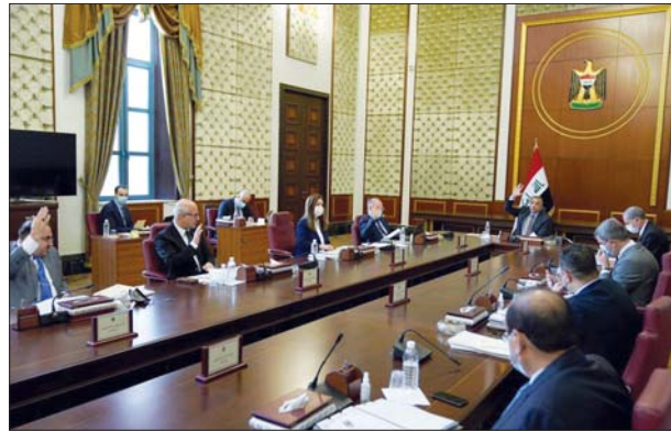
● جلسة مجلس الوزراء أمس

وافق مجلس الوزراء، بجلسته الاعتيادية الرابعة والعشرين التي عقدت، أمس الثلاثاء، برئاسة رئيس الوزراء، مصطفى الكاظمي، على شطب وزارة المالية المبالغ المالية ووافقها كافة التي ترتبت بضم موظفي مؤسسة السجناء، السياسيين ممن استشهد منهم جراء العمليات الارهابية حصراً بدلاً من اطفائها، استناداً إلى أحكام المادة (46) من قانون الابرارة المالية الاتحادية (6 لسنة 2019) المعدل، وقرار مجلس الوزراء (28 لسنة 2020)، وضعت الجلسة بيان الكتب الاعلاني لرئيس الوزراء، استعراض الاجراءات الحكومية في مجالات الوقاية والسيطرة الصحية التوعوية للحد من انتشار فيروس كورونا وتأمين اللقاحات وتوزيعها بين المؤسسات الصحية في بغداد والمحافظات لتكون متاحة أمام جميع المواطنين. وفي السياق نفسه، قال المتحدث باسم مجلس الوزراء، حسن ناظم، في المؤتمر الصحفي الأسبوعي لمجلس الوزراء، إن "مكنا اجراءات لحد الحكومة للاهتمام بملف الإسكان" لافتاً إلى أن البنك المركزي يبادر بتحويل المصفوف العقاري وصندوق الإسكان بأكثر من تريليون و800 مليار دينار". وأضاف أن "المبادرة ستتم قروضا للمواطنين بلا فوائد لشراء وبناء وحدات سكنية، موضحاً أن "عدة تسديد القروض تصل إلى 20 عاماً وستحفظ المواطنين على شراء الوحدات السكنية".