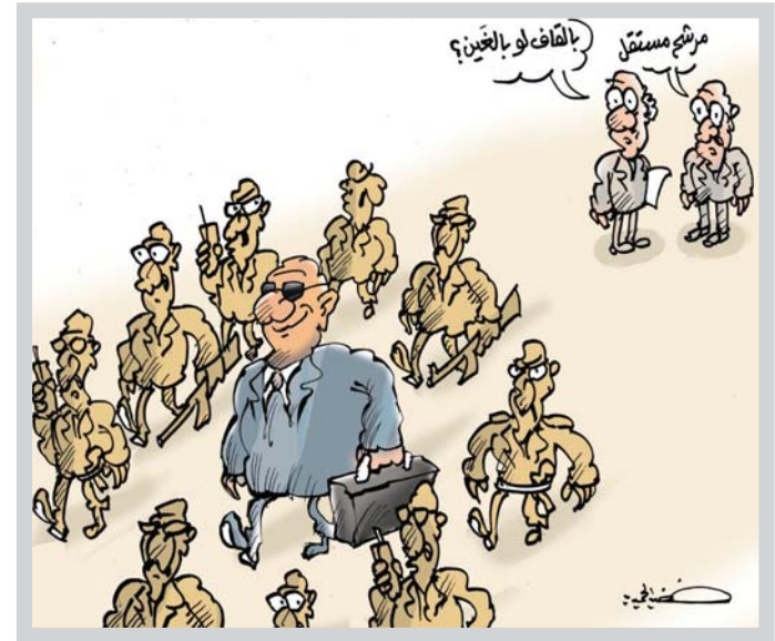
• كاريكاتير: خضير الحميري

قلّة هي تلك الكتابات التي تبحث بدواع الكشافية في التخصصات الثقافية والسياسية والاقتصادية والرياضية والفنية وغيرها، فإذا كان بعض الصحفيين يتباعد عن الكتابة في الشأن السياسي لأسباب أمنية أو بسبب تهديدات وضغوطات قد يتعرض لها، فإن الكتابة في المجال الثقافي لا توجد لها هكذا مصداق، بل بالعكس فإن المثقف العضوى الفعال هو من يستمر في عمائه الثقافي ومنجزه الإبداعي تحت كل الظروف. الملتل النظر بروز ظاهرة جديدة هي تحول العديد من الروائين والشعراء وكتاب القصة والقصة القصيرة، إلى الكتابة في الشأن السياسي وانسلاخهم شيئاً فشيئاً عن واقعهم الثقافي، فتمر السنون والأعوام فلا نجد لهم منجزاً ثقافياً، والسبب هو الانشغال في التحليلات والكتابات السياسية. قد يعود السبب في هذا التحول خاصة ان الهالة الثقافية التي يتمتع به والأديب على تطويق اللغة واسكانية الكتابة في جميع التخصصات وسهولة سير انوار اي تخصص دون عناء، ومنها الكتابة في الشأن السياسي، خاصة ان الهالة الثقافية التي يتمتع به تطبيعاً وتبعاً ورضاً انتقبل الآخرون ما يشهرون في هذا المجال حتى ان كانت هذه التحليلات السياسية بسيطة ومحاثة في أحيان كثيرة، داهيك عن إمكانية ظهوره الى الاعلاسي الواسع والمكرر عبر وسائل