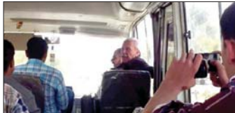
• ركاب في إحدى الكوسترات

يعاني الكثير من المواطنين الذين يتفكرون بوميالى استقلال سيارات بشتكاليهم في سماعهم الى الركاب صاحب السيارة يتصدق على الركاب لايضاصلهم مجانا. من هنا بعد احد المواطنين الذين يناشدون وزارة النقل بوضع حد لتجاوز السائقين ومساعدتهم