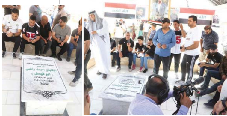
حزن ووجوم عند قبر الاسطورة الراحل

شهدت مقبرة الكرخ امس الأول الاثنين، حضوراً غفيراً لعدد من محبي وعشاق الكابتن الرياضي الراحل احمد راضي اسطورة الكرة العراقية، وذلك في الذكرى السنوية الأولى لوفاته على اثر مضاعفات فيروس كورونا الذي اصيب به العام الماضي، اذ اقيم مجلس عزاء وزع فيه الثواب على روحه الطاهرة من قبل رابطة عشاق القيصصر كاظم الساهر بالتعاون مع مجموعة من جمهور الراحل واصدقائه.