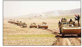
قواتنا ترمز الحدود مع سوريا، أوشريف