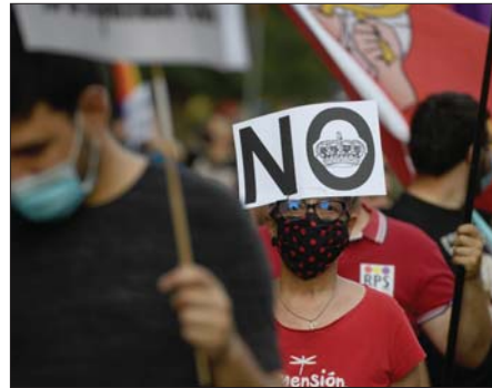
مدريد/ أف ب

المطلوبة لكي يحسنوا بين العاطلين عن العمل.