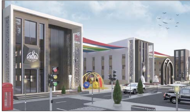
بغداد/ سها الشيلخي

طالب رئيس هيئة الاستثمار في بغداد شاكر الزامل جميع الجهات المعنية بالتعاون وتقديم التسهيلات لإتمام المشاريع الاستثمارية وتحريك سوق العمل المحلي للشركات الاقتصادية الزممة