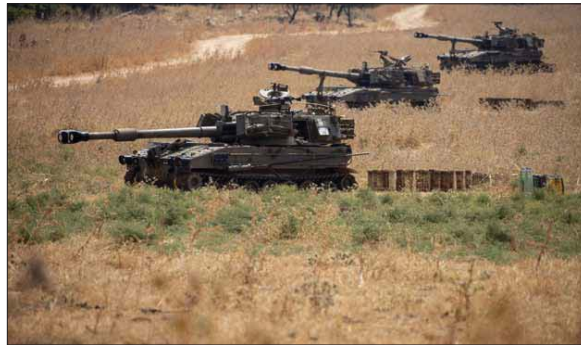
تواصل التوتر على الحدود اللبنانية الإسرائيلية. أرشيف

الأحداث الأمنية الخطيرة التي شهدتها جنوب لبنان التي أسفرت عن مقتل الأثنين، أقتت بظلالها على جلسة المجلس الأعلى للدفاع اللبناني الذي التأم أمس الثلاثاء برئاسة الرئيس اللبناني ميشال عون في قصر بعيدا في بيروت والذي شدد خلالها على إيدائه للاعتناء الإسرائيلي على جنوب لبنان، مؤكدا أن ما حصل يمثل تهديدا متناخا لاستقرار في الجنوب لا سيما أن مجلس الأمن سيبحث قريبا تجديد مهام اليونيفيل.