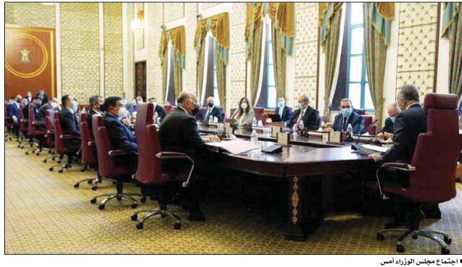
اجتماع مجلس الوزراء أمس

وأضاف: إنه «لا تراجع عن نقوية مؤسسات الدولة والعمل جار على توقيتها، ونحن بصدد اتخاذ قرارات وطنية لتلبية مطالب أبناء شعبنا». وأكد أن القوات والأجهزة الأمنية ملزمة بحماية حركة التطاهر الطبي من أي استفاد أو محاولة لخطف الأرواق، من أي جهة كانت. وناقش مجلس الوزراء، في جلسته الاعيادية التي عقدها أمس الثلاثاء، برئاسة رئيس مجلس الوزراء، مصطفى الكاظمي، مستجدات عمل لجنة تعزيز الإجراءات الحكومية في مجالين الوفاء والسيطرة الصحية والتوقية بشأن الحد من انتشار فيروس كورونا، الملقبة مؤخرًا بـ«المرض الجديد» 2019-2020. وأتى المجلس توصيات المجلس الوزاري للتنمية البشرية وإرفاق على إنشاء وحدات جديدة لمعالجة الإحساس السرطانية، وفقًا للقرارات التالية: إنشاء وحدات إضافية لمعالجة مرضى السرطان في مستشفى الأمل الوطني، وأخرى مضافة في مركز لوبي الأمراض السرطانية فضلاً عن التركيز على معالجة الأنواع الأخرى من الأمراض السرطانية، وأمراض العدة الوراثية وإنشاء مراكز للطب النووي في محافظات (البصرة، النجف، نينوى، بابل، الأنبار)، وفقًا للخطط التي أعاد لمناقشة النجف، وتكليف وزارة التعليم العالي والبحث العلمي، بآثار معالجة المواد الخطيرة، وميريات الطاقة الذرية بإنشاء منظمات تصريف الفضلات المشعة، على وفق النموذج الذي سبق تطبيقه في