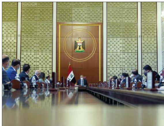
الكاظمي يترأس اجتماع مجلس الوزراء أمس