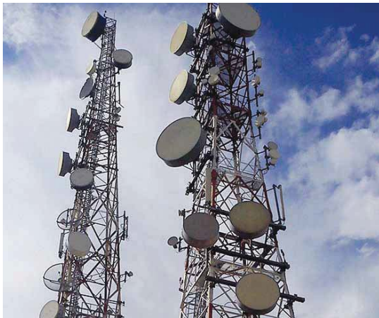
بغداد / اسراء السامرائي

كشفت وزارة الاتصالات المهريين لسعات الانترنت قضائيا كاحدى النتائج المتحققة لعمليات الصدمة، التي جرت بالتعاون مع جهاز الامن الوطني والمخابرات، فضلا عن استعدادها لتقييم بچواتها في عموم المحافظات.