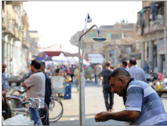
ارتفاع حاد بدرجات الحرارة في العراق