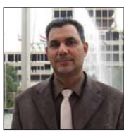
صباح يحسن كالمصنعة