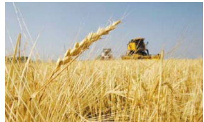
• زراعة الخنطة

انضم اتحاد الجمعيات الفلاحية في صلاح الدين عن تأخر تسليم مستحقات مسوقي محصول الخنطة من قبل الحكومة