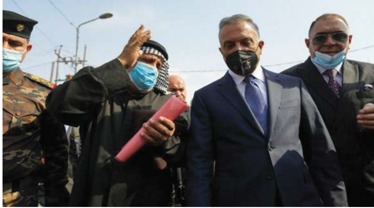
• الكاظمي في جولة تفقدية بمدينة الناصرية

• ذي قار - الصباح: حازم محمد حبيب قرر مجلس الوزراء أمس الاثنين، تأسيس صندوق خاص بإعمار محافظة ذي قار، كما أصدر أمراً باستئناء المحافظة من اجراءات تمويل المشاريع وتراش رئيس مجلس الوزراء، مصطفى الكاظمي عقب وصوله مدينة الناصرية صباح أمس، الجلسة الاستثنائية لمجلس التي خصصت لمناقشة الوضع الاقتصادي في المحافظة، وسواء الإدارة، متعهداً بمعالجتها قدر المستطاع، كما التقى الكاظمي مجموعة من أسر شهداء تطامرات تشرين، وأكد أن شهداء تشرين هم فخر للعراق، لأنهم خرجوا من أجل الوطن. في سياق متصل أوضح الأمين العام لمجلس الوزراء، حميد الغزي في حديث لـ «الصباح»، إن فكرة مشروع وإقامة في حيها مدينة الناصرية الإسراع بإنجاز مشروع مستشفى الإسراع والمستشفى التركي الإسراع في إجاز (الديلة الصناعية) ومشروع مصفى ذي قار. كما قرر المجلس تشكيل فريق