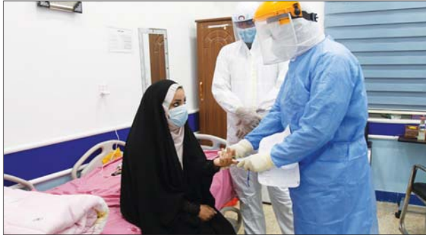
• مختبر حكومي

بالفراس للحصول على نتائج دقيقة. وأضاف أنه منذ صدور قرار الحجر المنزلي من قبل وزارة الصحة في الأول من حزيران الماضي انخفض عدد الراجعين الشبه مصابين بالجلحة إلى المستشفيات نتيجة اختلاف آراء الناس وضعف ثقافة المجتمع وتخوفهم من زيارتها بسبب انتشار الوباء كما يدعي البعض فضلاً عن ضعف التشفيف في التأكيد منها من خلال الفحوصات المخبرية الحكومية. وأكد أن هناك فرقا طيبة تنفذ حملات بالتنسيق مع عيادات الأطباء والمختبرات الخاصة بالأشعة والسونار والفراس في القطاع الخاص لارسال البيانات والاحصائيات المتعلقة بالمصابين ومطالبة الأطباء قانوناً بإجراء مسحات في المختبرات الحكومية للحصول على احصاءات حقيقية باعداد الحالات.