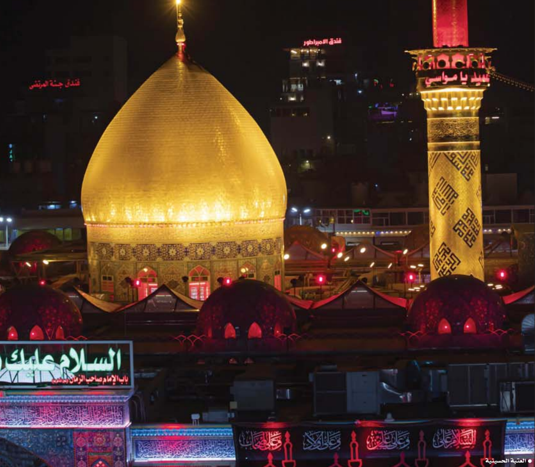
• العتبة الحسينية

أم الحنعمات لقد علمتنا الدنيا، بأزأ أمهاتنا من الفريديت في صناعة الجمال، من اقرب الكائنات الي الحنة، المدارس والكتب والمعلمات الإرائل لكل البشرية منذ فجر الولاية، من صناعات الاجيال، ومالكات المستقبل، وامهات المجتمع، ومن قبلهن السيدة زينب بنت علي بن أبي طالب، عليهم السلام، تلك الحوراء الزكية التي عشقتنا السن العفة، وطوقتها ورود اشهاره، فهدية الرسول الاعظم، وابنة الامام الحكيم، واخت الشهداء، فقد سطر ملاحم العنقوان والكربلاء، بأسمى صورها في