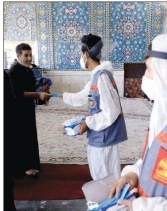
● حملات تطوعية في اربعينية الإمام الحسين (ع)

الأساتذة افتشروا الطريق الحسيني وقصدوا توعية الزائرين بمختلف الطرق ضمن حملة تطوعية وتوعوية، تهدف إلى الرد على الشائعات المغرضة حول الفيروس وحث الناس على الالتزام بالوقائع والأحداث الصحيحة فضلاً عن توعية وتثقيف العاملين بالمواكب والالتزام بإجراءات الحكامات في التجمعات وتطبيق قواعد التأمين الاجتماعي، علاوة على تشجيع عمليات التنظيف والتطهير والتعقيم والتخلص من المخلفات والحكامات المستخدمة في أماكنها المخصصة. قال مدير إعلام الجامعة الدكتور عامر الزبيد: "حاولنا المن خلال هذه الحملة أن نجعل طريق الإمام الحسين