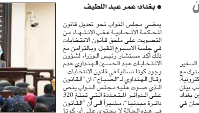
● جلسة سابقة لمجلس النواب