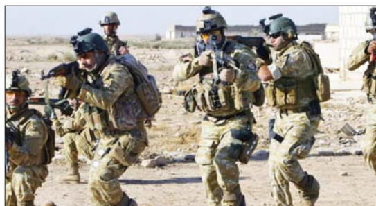
● مهامات امنية

وصول قواتنا الامنية إلى الشبكة المكلفة بتوزيع ما تسمى (الكالات) أي رواتب عصابات داعش الارهابية عملية نوعية تتميز بالبرصد المستنصر لتحركات وصول تلك الاموال اضافة إلى تدمير مخابر الاسلحة وعجلتين بانزلق نفذته قوة محمولة جوا. عملية الاطاحة بشبكة "رواتب الاربابيين" نفذتها الاستخبارات العسكرية بعد أن تمكنت مفارزها من اعتقال احدى الاربابيات المكلفات بتوزيع تلك الاموال في محافظة صلاح الدين. بيان الاستخبارات اوضح ان "الاربابية تم اعتقالها بالجرم المشهود في منطقة كنعوس خلال توزيع "الكالات" بين أسر الدواعش من التمتين ما يسمى د (لاية نينوى)، ومن سكنة مخيم الجعدة سابقاً". وهي الاستخبارات، تمكنت من العثور على مخبأ خفية ملياً من المواد على مخبأ للاسلحة جنود قضاء الرطبة.