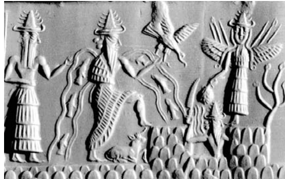
• تاجح العموري