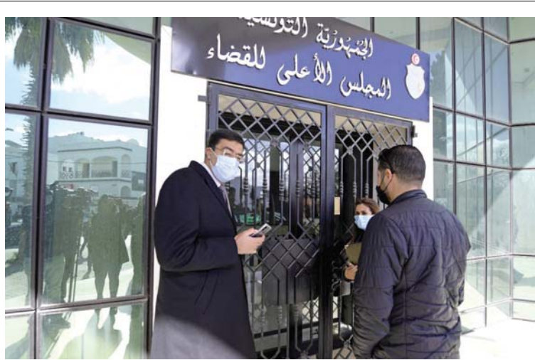
أغلقت الشرطة التونسية أمس الاثنين مقر المجلس الأعلى للقضاء، في إجراء ندد به رئيسه باعتباره "غير قانوني"، وذلك بعد يومين من إعلان حله بقرار من الرئيس قيس سعيد. وقال رئيس المجلس يوسف بورخر: إن قوات الأمن منعت الولوج إلى مقر المجلس الأعلى للقضاء.