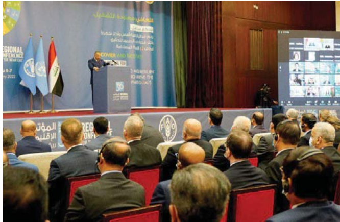
● الكاظمي يلقي كلمته في مؤتمر (فاو) الدولي

أفاد خبراء في القانون ومحللون بأن طلب رئاسة البرلمان أسس الأثنين من الحكومة الحالية إرسال قانون الموازنة العام الحالي 2022 غير صحيح ويتعارض مع القوانين كون الحكومة تحولت إلى تصريف الأعمال والأمور اليومية، وليس من صلاحيتها إعداد القوانين الاستراتيجية ومنها قانون الموازنة. وعلى الرغم من توجيه رئيس مجلس النواب محمد الحلوسى بمخاطبة الأمانة العامة لمجلس الوزراء لإرسال الموازنة الاتحادية لعام 2022 إلا أنه تراجعا مع فشل مجلس النواب في الإنفاق والتخابر من مجلس الجمهورية، فإن