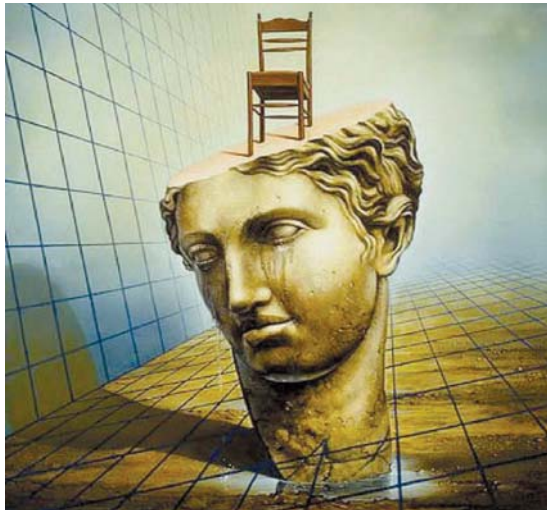
لوحة لرسام الأثيني سيغفريد زامبات

يقول إن القيادة لا يمكن تعلمها من الكتب، بل يمكن تطويرها من خلال التجربة. القيادة هي القدرة على إلهام الآخرين وتحفيزهم لتحقيق أهدافهم. القائد هو الشخص الذي يملك الرؤية والقدرة على تنفيذها. القيادة هي فن قيادة الآخرين لتحقيق أهدافهم. القيادة هي القدرة على إلهام الآخرين وتحفيزهم لتحقيق أهدافهم. القيادة هي فن قيادة الآخرين لتحقيق أهدافهم.