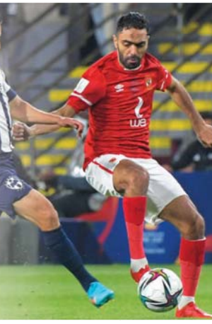
فك الأهلي عقده البرازيلية

وفي نسخة 2006 في اليابان سقط الأهلي، حامل الرقم القياسي في عدد الألقاب في مسابقة دوري أبطال إفريقيا (10 مرات)، أمام إنترناسيونال 1-1 قبل أن ينهبها في المركز الثالث بفوزه على كايوتو أيسركا المكسيكي 2 - 1، وفي نسخة 2012 في اليابان أيضاً خرج على يد كورينثيانز صفر-1 قبل أن ينهبها وأجعا خسارته أمام مونترير المكسيكي صفر-2.