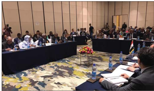
اجتماع سابق بين الرفقاء بشأن سد النهضة