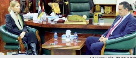
محافظ كركوك خلال لقائه سفيرة النرويج

وذكر السائق الاعلامي ان السرس بيتن، ان "الخطط المستقبلية ستقدم الدعم لتنفيذ مشاريع اخرى تخص الخدمات الاساسية".