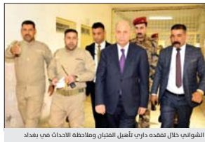
الفتيان خلال تفقده داربي تأهيل الفتيان وملاحظة الأحداث في بغداد