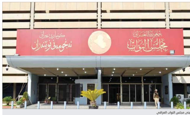
مبنى مجلس النواب العراقي