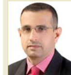
ناصر عمران الموسوي:

القاضي ناصر عمران الموسوي يرى ان العنف الاسري مشكلة اجتماعية وثقافية قبل ان تكون قانونية لكون الكثير من العنف تجاه الشركاء والارلاء اصعب بعد ثقافة سلوكية يمتلكها رب الأسرة او اصحاب القرار واحيائاً المنتفد داخل العائلة، وهو غالباً ما يكون مؤيداً بمفاهيم اجتماعية وثقافية بنجحة له، ولكن القانون يعطي الضحية الحق بالشكوى على من قام بفعل الضرر والتعنيف في ابي مركز للشرطة سواء كان قريباً ام بعيداً مع وجود الأدلة