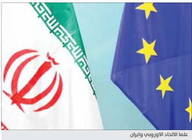
علم الاتحاد الأوروبي وإيران

الهندي في المستقبل القريب، مضيفا أن تصميم وتخطيط التدريبات تم الشهر الماضي، واستبعد لها حاليا أساطيل هذه الدول الثلاث، سعيها إلى أن التاورات ليست عملا عدوانيا ضد أي دولة". وتابع: "عندما نتكلمنا أسماء، بعض الدول العظمى والقوية مثل إيران وروسيا والصين في مثل هذه التاورات فإن ذلك يعتبر حدثا مهما، "موضحا أن التعاون مع روسيا والصين سيعزز الأمن الجماعي في البحر بعد صيف من التوترات البحرية المشتركة بين العديد من الدول، سواء على اليابسة أو في البحر أو في الجو، تشير إلى توسع ملحوظ في التعاون".