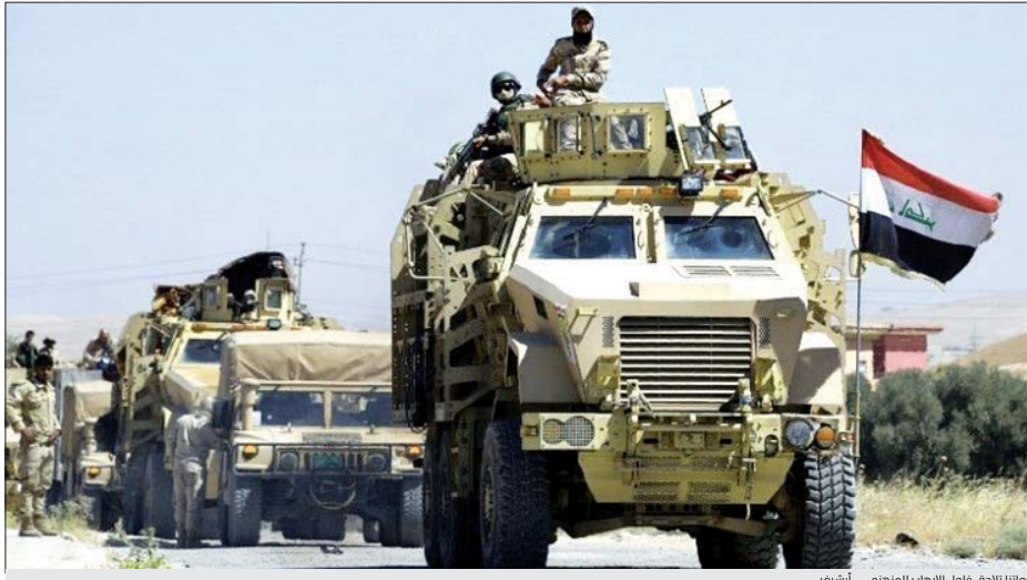
قواتنا تلاحق بقول الأرباب المنهزم... أرشيف