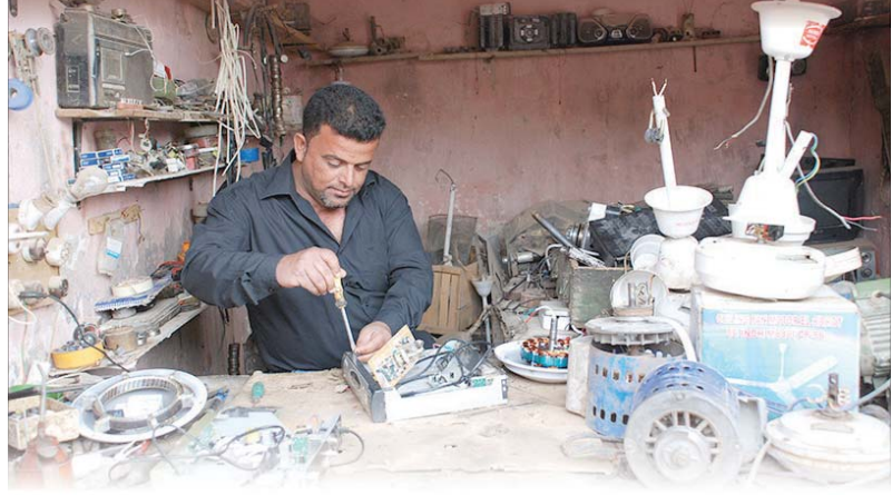
بغداد/ عماد الامارة

ولفت: «تعتمد المؤسسات المتوسطة والصغيرة في أغلب الأحيان على الموارد المحلية والمواهب العرضية للمؤسسات الكبيرة، وبذلك تسهم في الحد من هدر تلك الموارد وتقليل الاعتماد على الاستيرادات من المواد الأولية والمساعدة في زيادة الناتج المحلي الإجمالي». وتكرّر أنّ «المؤسسات المتوسطة والصغيرة يمكنها تجاوز أهم العقبات التي تقف أمام إنشاء المؤسسات الكبيرة ومن أهمها انخفاض حجم التراكم الرأسمالي وتخلف الفن الإنتاجي ونقص الخبرات الفنية المتخصصة ونزرة الموارد المالية اللازمة لإقامة مؤسسات كبيرة وفق أسس اقتصادية وفنية متقدمة كما أنّ المؤسسات المتوسطة والصغيرة تتناسق ومختلفة السوق المحلية، خصوصاً إذا كانت السوق تحتاج بمنتجاتها أو انخفاض القدرة الشرائية لدى المواطنين، لذا تعد وسيلة لدعم الصناعات التقليدية التي أصبحت تلقى رواجاً لدى شعوب العالم المختلفة».