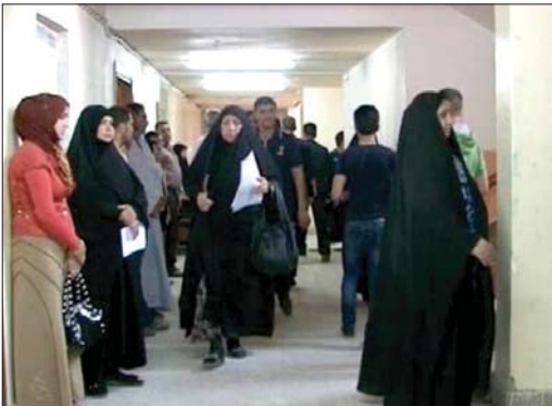
في اروقة المحاكم