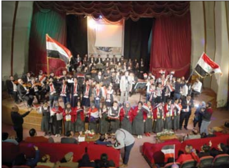
جانب من الاحتفالية