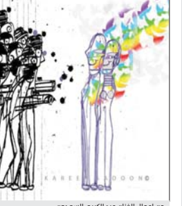
من أعمال الفنان عبد الكريم السعوف

في أيّ شجار، في أيّ معركة، في أيّ حروب، يتصارع طرفان، ويصالح ما يقف بينهما طرف ثالث. طرف غير مرئي، وحشٍ رابضٍ في ظلام الكهفٍ السحيق للقاتل، يهض فينبض جعاً من ذلك الظلام، وحشٌ هو من يأتي إليهما بالسكين ويأتي بالمدم، فيحيل الاختلاف شجاراً