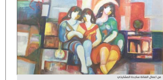
من أعمال الفنانة ساجدة المشايخي

الفنانة ساجدة المشايخي تميزت باستلهاها للفنون عبر عصور ما قبل التاريخ، وصبوراً ممكنات الفن السومري، فقد عملت على دمج العالق في الذاكرة البصرية، بما تنتج مشاهداتها الأنيقة، مستفيدة كثيراً من طروحات جماعة بغداد للفن الحديث، فهي من الموابكين لحركتهم وعظائمهم الأثري، يظهر على لوحاتها التعشيق بين ما هو موروث وما هو متحقيق من رؤى معاصرة، فهي إذ تتعامل مع الواقع بهذه الحساسية الفنية لا تغادر ما هو موروث، سواء كان الحراك الفني القديم في تشكيلات الجسومات أو حكايات ومرويات ألف ليلة وليلة