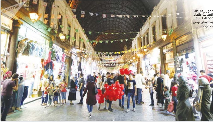
التعايش حركة التسوق في سوريا

أحبطت وحدات الجيش السوري العاملة على محور ريف إدلب الشرقي هجوما نفذته عمليات جبهة النصرة الإرهابية باتجاه مواقع الجيش على محور بلدة إجراج بينما اتخذت الحكومة الإجراءات عملية اعتماد بطاقة ذكية بدل الرقمية لضمان توفير المواد الغذائية للمواطنين السوريين بأسعار مدعومة.