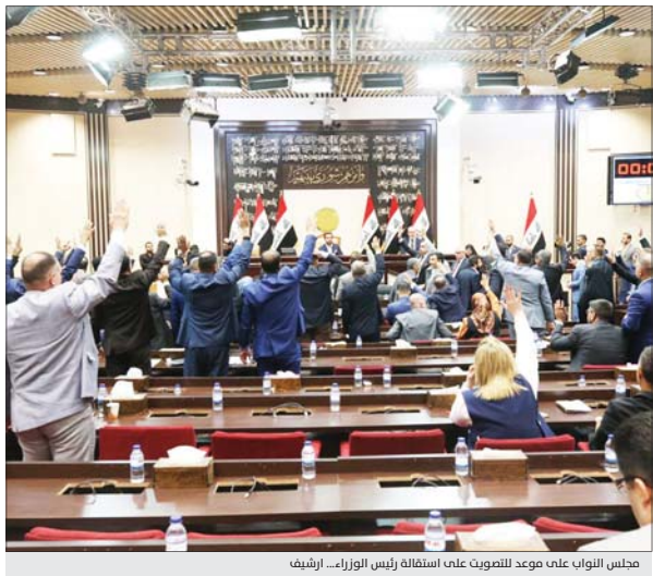
مجلس النواب على موعد للتصويت على استقالة رئيس الوزراء.. أوشيك

عبد المهدي؛ تحقيق مصالح الشعب هدف يهون أماله كل شيء