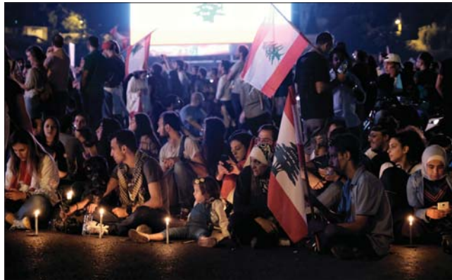
الأزمة اللبنانية لا تزال تراوح مكانها اثر تفرغ تشكيل الحكومة