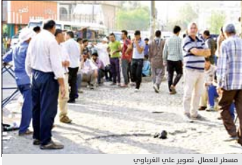
مسار للعمل

بالإضافة الى تجهيز مشاريعهم بالمواد الخام لخدمة شريحة ذوي الاعاقة. واعرب عن الاستعداد الكامل لهيئة لتوفير الدعم اللوجستي لهذه المراكز الخاصة بهذه الشريحة فضلاً انه يوجد سنوياً تخصص مسالي من اجل اقامة وتأهيل هذه المراكز بشكل دوري من اجل ميومنتها بالشكل الذي يتناسب والاكتفاء المادية المتوفرة.