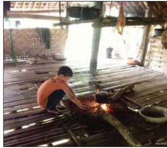
الطيروف، فغني كل صباح يسلح الحلق ثم يعود إلى العمل في الحقل بالفصل على من درجته هوائية والبيت.

للعيش في قرية أخرى، وهكذا صار الطفل وحيداً من دون أي معيل. ويعدسا لاحظ المدرس أن الطفل يعيش لوحده، قام بإخطار السلطات، لكن الطفل رفض أن يتنقل إلى أسرة تتيبناه، وأصر على أن يواصل العيش القاعد، وتحمل مسؤوليات شاقة، رغم حداثة سنه. بنفسه، إذ يعتمد الطفل أيضاً على ما يوجد به الجيران من الطعام مثل الأرز لكنه يعمل في الحقل ويقوم بحصاد ساق الهامبو، فضلاً عن زراعة الخضار. لكن الطفل لا يخفي أن النوم بمفرده داخل البيت ليس بالأمر السهل، ويجري تربيته وأصر على أن يعمل ويسأل مما يسرع، بعدما رحلت والدته عن الحياة، بينما لقي الأب مصرعه في حادث بعدما ذهب إلى المدينة كي يعمل في مجال البناء. أما الجدة، وهي القرد التتقي، التي المرسدة، رغم قساسة