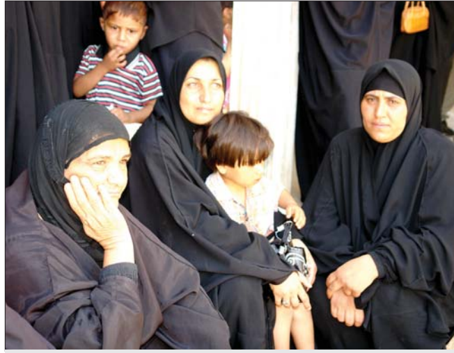
في دائرة الرعاية الاجتماعية

في البداية كنت اتحمل من اجل طفلي الصغيرة لكن بمرور الزمن بدأ صبري ينهد، لذلك قررت ان ارحبه واحصل وضع حد لثوراته ولفسوته والعنف الذي يصف به ايضاً وفي احدي المواجهات فقد صوابه وبدأ يضربني بقسوة لذلك هربت انا وابنتي وتوجهنا الى بيت اهلي .