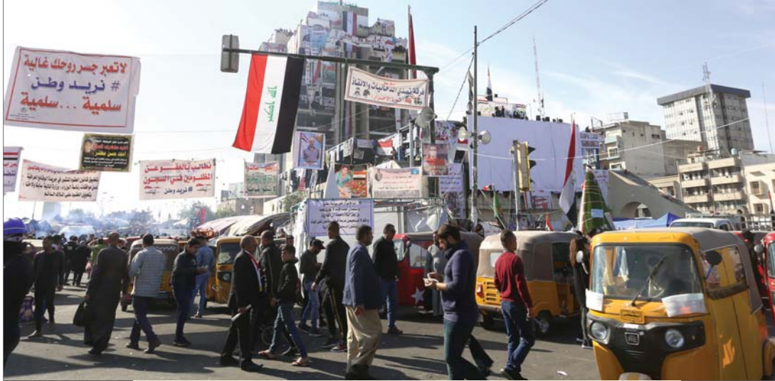
ساحة التحرير...