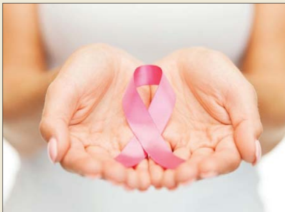
سرطان الثدي يمكن اكتشافه مبكراً

كشفت دراسة بريطانية حديثة أن فحصاً جديداً وبسيطاً للدم، يمكن أن يكشف عن سرطان الثدي مبكراً، قبل خمس سنوات من ظهور الأعراض السريرية للمرض. وأجرى الدراسة باحثون بكلية الطب جامعة نوتنغهام في بريطانيا وأوضح الباحثون أن فحص الدم الجديد، يحدد استجابة الجسم المناعية للورم التي تنتجها خلايا الورم في الثدي، قبل ظهور الأعراض السريرية. وأضافوا أن الخلايا السرطانية تنتج بروتينات تسمى مستضدات تحث الجسم على تكوين أجسام مضادة لمقاومة هذه المستضدات، ووجدوا أن هذه المستضدات المرتبطة بالورم هي مؤشرات جيدة لكشف البكر عن السرطان قبل خمس سنوات من ظهور الأعراض السريرية للمرض، ولتحسين الفحص الجديد، أخذ الفريق عينات دم من تسعين مريضة بسرطان الثدي في وقت تشخيص إصابتهن بالمرض، ويطبقها مع عينات مأخوذة من تسعين امرأة لا يعانين من سرطان الثدي.