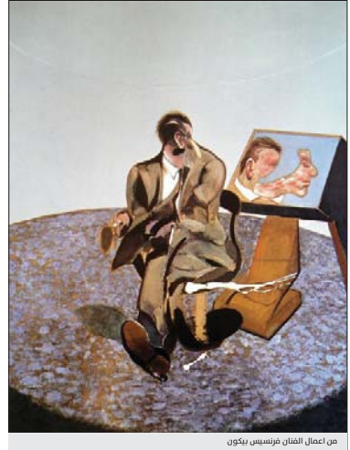
عمل عمل الفنان فرسيس بيكون

لم تكن المفردين بهذا القتل، تلك العملية مجرد اشياء! أما هنا العنقا، التي استنعت له من ابنتي الرابدة، فنحن نعلق قلبه وعلى مسليات أخرى أكبر بكثير منها من ربة الزمن ويعد تزوايتها)، ص 57 ومع هذا العالم الجنون الذي يبع بين الإنسان والاعتذار بعبء المسؤولية تعيش تلك الأحداث الذي تناوله القاص بروية فنية حديثة مستخدماً كل المؤثرات التي من شأنها أن تحيد قضا، النص بهالة من التفرقة والالتفات الكبيرة لتوضيح أمام من يدبر هذه البلاء، وكأنها استغفلة تنطلق من مخزون هذه الحكاية.