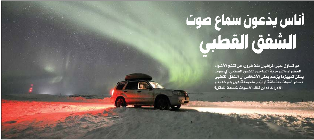
● قد ينتج عن الشفق القطبي راحة معدنية أيضا إضافة إلى الأصوات

هو تساؤل حير المراقبين منذ قرون، هل تنتج الأضواء الخضراء والقرمزية الساحرة للشفق القطبي أي صوت يمكن تمييزه؟ يزعم بعض الأشخاص أن الشفق القطبي يصدر أصوات طقطقة أو أزيز ملحوظة، فهل هم شديدي الإدراك أم أن تلك الأصوات خدعة للمقلد؟