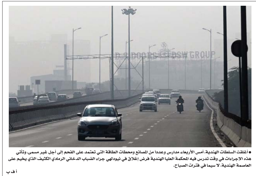
● أغلقت السلطات الهندية، أمس الأربعاء، مدارس وعدداً من المصانع ومحطات الطاقة التي تعتمد على الفحم إلى أجل غير مسمى، وتأتي هذه الإجراءات في وقت تدرس فيه المحكمة العليا الهندية فرض إغلاق في نيودلهي جراء الضباب الدخاني الرمادي الكثيف الذي يخيم على العاصمة الهندية، لا سيما في فترات الصباح.