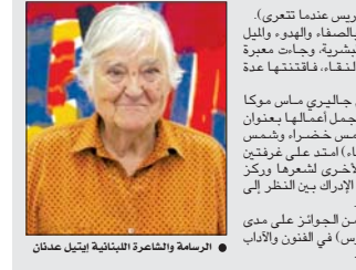
الرسامة والشاعرة اللبنانية أنيل عدنان

أولها، وبدأت لاحقاً في دمج اللغة العربية إلى تصوير الطبيعة البشرية، وجاءت معبرة في عام 1977 نشرت رواية (الست ماري روز) عن الحرب الأهلية اللبنانية وحققت العمل جائزة كبرى بالعالم. وفي عام 2018 أنام جاليري ساس موكا الأميركية عرضاً لجمال أعمالها بعنوان (شمس صفراء، وشمس خضراء، وشمس حمراء، وشمس زرقاء)، استمد على عرقتين لإدخالها للوحاتها الأخرى لشعرها وركز على الاختلافات في الإراك بين النظر إلى اللوحات وقراءة الشعر. حصلت على العديد من الجوائز على مدى حياتها منها لقب (فارس) في الفنون والآداب من الحكومة الفرنسية.