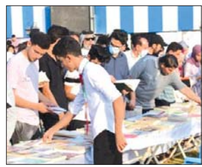
جانب من المهرجان

بجهود شبابية طوعية أقيم في قضاء الحسيونة بالمعاصرة بغداد «مهرجان الحسينية تقديراً، بحضور عدد كبير من أهالي القضاء، وتم توزيع أكثر من 500 كتاب متنوع على الحاضرين وسط العديد من الفقرات والأنشطة الفنية مثل معارض الرسوم والصور الفوتوغرافية والـ (الجايزات) فضلاً عن عروض رياضية من (الكيك بوكسينج) والباركوري. كما وتم توزيع شتلات لزراعة في القضاء، حيثما توزعت الساعات في القضاء، على المنظر، واختم المهرجان بتأسيس «نادي المعرفي للكتاب، الذي سيواصل نشاطاته لاحقاً.