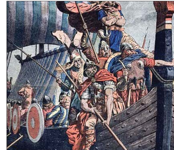
● الفايكنغ استوطنوا شواطئ الأزور المحتلة قبل عدة مئات من السنين

هذا ما توصلت إليه مجموعة من الباحثين الذين نجحوا في اكتشاف أدلة تدعم الفكرة التي تقول بأن الفايكنغ استوطنوا شواطئ الأزور المحتلة قبل عدة مئات من السنين من وصول البرتغال إليها في العام 1472.