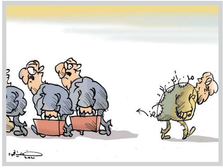
• كاريكاتير: خضير الحميري

• د. نازك بدير* تعرضت الكثير من الدول عبر التاريخ إلى الانغلاق نتيجة أسباب عديدة، نتيجة للتصاوية، عرقية، سياسية، عسكرية... وقد نالها العجز، ولا تزال في سبيل استعادة حريتها واستقلالها، ولكن هل يجوز الأعتلال مع خروج جنودها من البلاد، ما هي جياضاً من خلال القوات، ومؤسسات، وقوات، وبرامج، ومناجج، وعملاء؟ يمكن القول إن الانغلاق العسكري، كما تثبت التجارب التاريخية، على مَرِّ الزمن، لا بد أن يتحدّر، وتعود الأرض إلى أصحابها الأصليين، مهما طالّت المدة الزمنية للاستعمار، وبلغت تضيحات الشعب في سبيل تحرير بلاده من أي عدوان يصيبها. إلا أن ثمة أزمة تحصل، كما هو الحال في لبنان على الرغم من أنه نال استقلاله منذ 22 تشرين الثاني 1943، إلا أنه حتى اليوم يبدو أن هذا الوطن لم يعرف من الاستقلال سوى الاسم، ولم يبق من العيد سوى الذكرى. على أي استقلال يمكن أن نتحدث في لبنان الذي منذ تأسيسه إلى يومنا هذا لم يشكّل حكومة بشكل مستقل من دون تدخل؟ ما ثمة استقلال حقيقي، بشؤون الثورة تطبع في