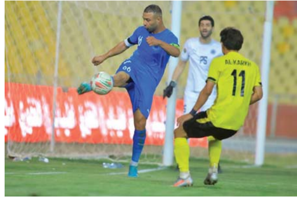
● بغداد، حيدر كاظم

والمرحوم أن تحتتم الجولة قبل الأخيرة عدداً الخمسين بإقامة أربع مباريات.