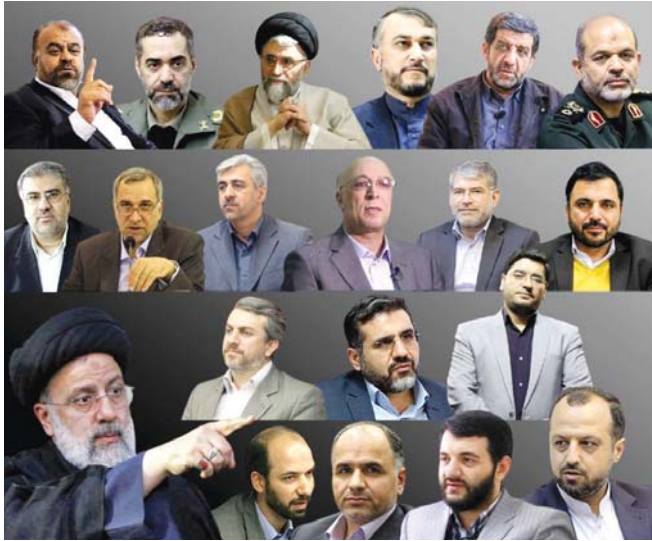
حكومة الرئيس الإيراني إبراهيم رئيسي