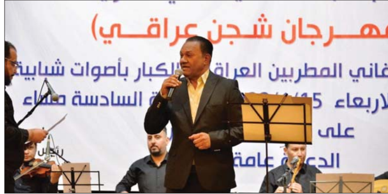
جانب من مهرجان شجن عراقي

حضر رواد الأغنية العراقية بأصوات شبابية، من خلال مهرجان «الشجن العراقي» الذي أقامته اللجنة الثقافية بنادي العلوية في قاعاتها الكبرى، وسط حضور عدد كبير من الفنانين والمثقفين والإعلاميين ومحبي التراث.