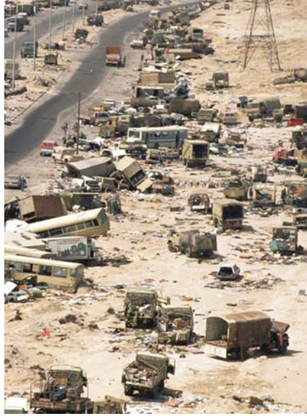
• الأثار المدمرة للاستبداد السياسي

تضيغ في قضاء الاستبداد حياة وبنية مسجونة بمعقّدات ومفاهيم مغلقة، تتغلغل في الوعي واللاوعي الفردي والجمعي، وثقافة دينية لا تعرف معاني الحريات والحقوق، الإنسان