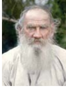
● تولستوي، خداع للنفس ● يستحق الربوة