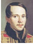
● ليرمانتوف، سفينة الرياح