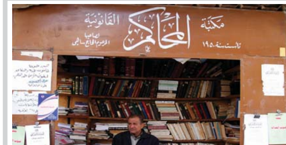
صورة وتعليق أقدم مكتبة قانونية في شارع المتنبى يعود تأسيسها إلى العام 1950 من القرن الماضي...