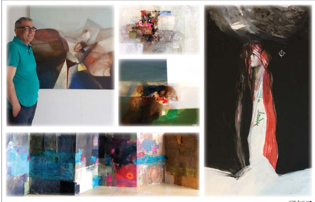
من أعمال الفنان

لوحات التشكيلي المتفرّد حسن عبود التي تؤنّس لضاف جديدة تعري المتلقي بالفقز عليها والتمزّد على أرضه الراسخة أو التي يتصورها راسخة.. ضفاف فعالة تلوح أن تعال.. فتتحرك بسرّنة مدرّوسة - مدرّوسة من قبله طبعاً - نحو قصد وهدف جمالي يراه