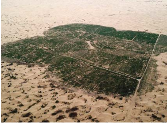
• تشجير صحراء كوبيوكي ساعد في الحد من العواصف الرملية في بكين

ممتدة عبر منغوليا وشمال غرب الصين بمساحة تبلغ مليوناً و200 ألف كيلومتر مربع، تضيف صحراء غوبي، أكبر الصحاري نمواً واتساعاً على وجه الأرض، ما يصل إلى نحو ستة آلاف كيلومتر أخرى لها، كل عام.