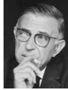
● حاول سارتر كسر منطق الحرب

في حين يرى سارتر أن عصره (يمز بأزمة ضمير أخلاقي) وأنه (ليس مستعداً للتضحية بحياته من أجل الأدب) وليس هذا تناقضاً في صغر كانت تسود الكثير من النظريات الفلسفية والأدبية وتيارات الوعي الجديد، ومن ثم فإن أدب تلك المرحلة التي كان فيها سارتر أكثر نشاطاً وأغنية يجب (أن يكون حساب الأدب، ولعل قراءة النصوص الأدبية الطويلة التي وضعها سارتر في الكتابة وجدواها مستكشف الكثير من هذه الأرواح القديمة، التي ربما سنرى أنها (قد) لا تتطابق مع مفهومات العصر وحداته المتطورة في أشكال الحياة وجوهرها المتغير.