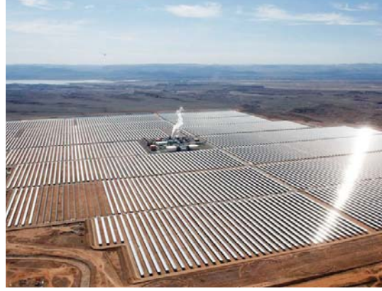
• يمكن تركز الطاقة الشمسية وطاقات الرياح في الصحراء أن تحسن هطول الأمطار

تعمل هذه التناقضات على جفر قنوب في الرمال، كما تقوم، في الوقت ذاته، بري النقل الغضة، مشيداً بهذه الطريقة، كبرى علماء اتفاقية الأمم المتحدة لمكافحة التصحر، بأنها: أدت إلى تقليل زمن زراعة الأشجار من 10 دقائق إلى عشر ثوانٍ، ما يجعلها طريقة فعالة ومهمة للغاية.