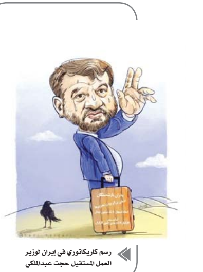
رسم كاريكاتوري في إيران لوزير العمل المستقيل جحت عبدالملكي

الحقيقة أن علي مطهري نجل الممكر الإيراني الراحل مرتضى مطهري، يمثل بنفسه حالة نادرة في الواقع السياسي الإيراني، بجراته ووضوحه وصراحته، فهو يعترض صراحة ولا يخفي اعتراضه وراء عبارتين عامية، ويعلن مواقفه ويتحمل مسؤولية ذلك، ويدفع الثمن كما حصل بعجبه عن الانتخابات التشريعية الأخيرة، ومعاقبته بعدم قبول أهليته في الانتخابات الرئاسية العام الماضي، ومع ذلك لم يثن بل يواصل التصيحة على أعلى مستوى. ففي يوم الخميس الماضي بعث برابع رسالة (بحسب رصدي رسالة) إلى رئيسي الجمهورية، هاجم فيها الأسلوب الشعاري في إدارة السياسة الخارجية، وحذر من المتطرفين والمتخبرين الجامدين في مراكز القرار، وكان جوهر ما ركز عليه أن الاقتصاد الإيراني مرتبط بالاتفاق النووي، وأن هذا الاقتصاد لا يسعه الصمود أكثر أسماء العقوبات المتراكمة، وأن الحل السليم هو العودة إلى الاتفاق، والحل دون عودة ملف إيران النووي إلى مجلس الأمن الدولي مجدداً، كما حصل في مزة سابقة على عهد الرئيس الأسبق محمود أحمدني نجاد، وأن الطريق إلى ذلك يتشمل مبادرة شجاعة يتولاها رئيس الجمهورية، ويتجاوز عنها الشعب التي ردها بعض السذج والجامدين من نوابات التي أن الاتفاق النووي كان خيانة. جاءت هذه الرسالة فيه في ذلك، عندما اقترح مطهري على رئيسي إجماعاً وطنياً في المسألة، يتجاوز إصرار إيران على رفع الحرس النووي من قائمة الإرهاب، وذلك بإحالة الملف برمته إلى المجلس الأعلى للامن الوطني الإيراني، لكي يخرج القرار إجماعاً، تتوزع فيه المسؤولية بين جميع الأطراف، من دون أن يتدخلها طرف واحد أو يتعمّز للحرص شخص بعينه.