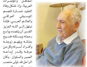
● منذر جميل حافظ

رحل أيقونة الموسيقى العراقية منذر جميل حافظ بهدوء متناً عاش، يوم الأربعاء الماضي، بعد رحلة طويلة مع الموسيقى والتأليف والقيادة ملاً فيها الكتب العراقية والعربية بحال النغم والأفكار الموسيقية الثيرة المخفزة للآخرين على الابتكار والإبداع.