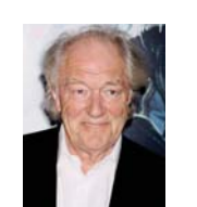
● على جاسون من رهبة المسرح

على النحو الآتي: أيها فلسفة تقوم على فكرتين مركزيين: الوجود حياة الإنسان، والعدم «الموت»، وضمن هذه الثنائية، على الإنسان أن يشعر بالقلق تجاه مصيره، لأن نهايته العتمية في الموت وهذا يعني أن القلق الوجودي المسيطر على الإنسان هو الذي كشف معنى العدم «الموت». وهذا قد ينطبق على مصطلح «رهبة المسرح» الذي يطلق على الأشخاص الذين يتوترن عندما يلتقون حواز أمام جمهور حاشد، وهذا «الرهبة» ورهبة الأداء والتوتر أو قوبسا مستمرة تبدأ عند الشخص والعالم الذي يطلب منه الأداء أمام الجمهور، ويمكن أن يؤدي أمام جمهور غير معروف أقصد من يشته مختلفاً إلى التوتر بشكل أكبر من الأداء أمام جمهور مأروف وفي بعض الحالات، قد لا يعاني الشخص من خوف من هذا، ولكن قد يعاني عند عدم معرفة نحو السوف يتحدثون أمامه. قد يسبق التحدث أمام الجمهور المشاركة في أي نشاط يتضمن التفاعل الذاتي وفي بعض الحالات قد تكون الأمر رهبة جزءاً من تعلم أو يلمس الحدث الاجتماعي، وهذا قد يحدث اضطراباً في هذا الجانب، والعديد من الناس يتكلمون لقلق المسرح عن غير أي مشكلات، فه، غالباً، ما تشاء