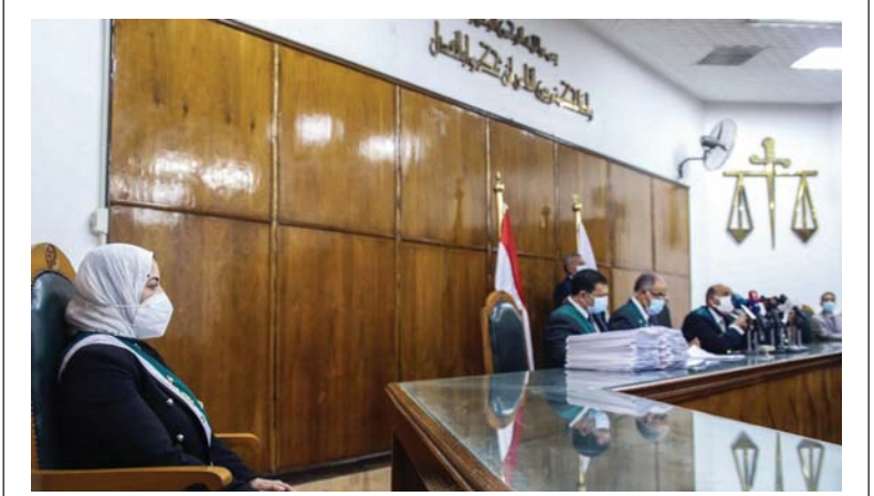
جلست، أمس السبت، القاضية رضوى حلمي أحمد على منصة المحكمة الإدارية المصرية لأول مرة في تاريخها بعد أن كان يقتصر ذلك على القضاة الرجال. ويأتي جلوس أول قاضية على منصة مجلس الدولة المصري، الذي أسس في العام 1946 على غرار مجلس الدولة الفرنسي، تنفيذاً لقرار أصدره الرئيس عبد الفتاح السيسي في تشرين الأول بتعيين 98 قاضية في مجلس الدولة.

انتقد رئيس وزراء أوكرانيا الأسبق محاولات الاستفزاز العسكرية قرب أكبر المفاعلات النووية في أوروبا، فيما أفادت أنباء بمقتل أحد أعضاء الوفد الأوكراني المفاوضات مع الجانب الروسي. وقال رئيس الوزراء الأوكراني الأسبق، نيكولاي أزاروف، أمس السبت، إن ما وقع في المحطة النووية زابوروجيه، عمل استفزازي محمط له ويسمى الرئيس فلاديمير زيلينسكي للاستفادة منه. وأوضح أزاروف في تصريح لوكالة سبوتنيك، أن العمل الاستفزازي الذي تم القيام به بمحطة الطاقة النووية، تم التفتيح