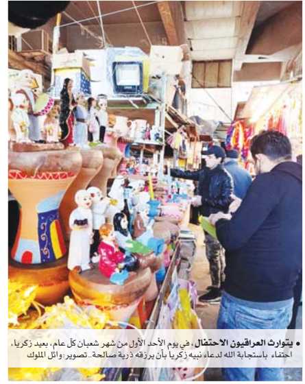
● بتوات العراقيون الاحتفال، في يوم الأحد الأول من شهر شعبان كل عام، بعيد زكريا، احتفاءً باستجابة الله لدعاءه، يهزيه زكريا بأن يرزقه ذرية صالحة.

خرج المؤتمر الدولي الثاني للمياه الذي أقيم في بغداد أمس السبت، بضمانات تركية ومشاركة عادلة ومنصفة. ومع انطلاق المؤتمر، التقى وزير التخطيط خالد البتال كلمة نيابة عن رئيس الوزراء مصطفى الكاظمي، أشار فيها إلى أن العراق أكثر البلدان تعرضاً لتأثير التغير