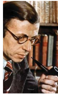
● سارتر، الأخرى هم الجميع

يرى رونو أن سارتر لم يكن - وهذا صحيح - قارئاً فعلياً، بمعنى القول الجامعي للكلمة، إذ أخذ من «فيلسوفاً حقيقياً» لم يكن سارتر أكثر مرهقة من أي يدعبله كليا إلى عمليّة احترام عديمة «القائفة» التي رسمها، لا يمكن إلا الاعتراف به ويكونه خطأ لا تقتصه الفرادة أبدأ. المساهمة الأساسية للظاهرية بالنسبة إلى سارتر، تكمن في أنها تتيح لنا إنقاذ الموضوع الوعي لأن الظاهرية، وفق سارتر، تبقى دائما خارج ذاتها، وهي معكومة بحرية عديمة القائدة، التي تشكل المصدر الوحيد للقيم؛ لأن الإنسان حرّ عنده بطريقة لا يمكن تبديلها وتحولها، وهو شخص مسؤول لهذا يعني الحال كذلك، أن نعدّها «قرءات سطحية»؟