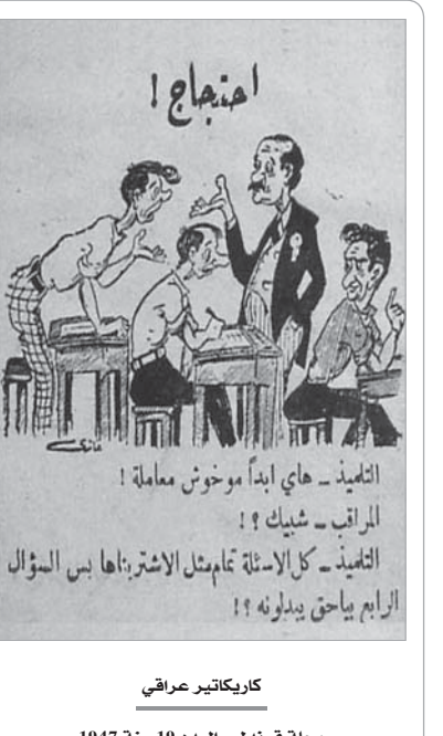
مجلة قردند - العدد 19 سنة 1947

جرائم مختلفة الإخلال بالأمن الحكومي 65 جريمة، الرشوة 111 جريمة، اختلاس 26 جريمة،