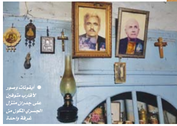
● الأيقونات تصور على جدران منزل الجسري المكون من غرفة واحدة

واحد من ثلاثة طيلة تسعة عقود، تحول الجسري وأشقاءه، ما كونه فردا من مجتمع مسيحي كان سهوا الاندماج مع باقي مكونات التنوع الاجتماعي، إلى واحد من بين ثلاثة مسيحيين معروفين فقط بقوا في إدلب الواقعة شمالي غرب