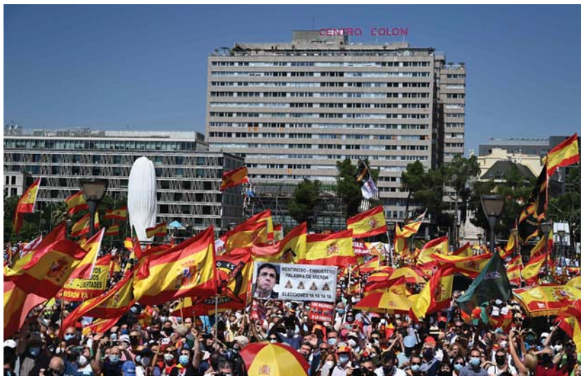
● متظاهرون يمينيون يتدنون بخطط الحكومة الإسبانية المثيرة للجدل بالعمو عن الانصاليين الكتالونيين المسجونين في أعقاب محاولة الاستقلال الفاشلة عام 2017.

قال القائد العام للجيش الإيراني، اللواء عبد الرحيم موسوي، إن الانتخابات الرئاسية في البلاد فرصة طيبة لتعزيز القوة الشاملة للنظام. ووصف اللواء موسوي تلك الانتخابات المقرر إجراؤها يوم الجمعة المقبل الـ 18 من حزيران الجاري بأنها "أمر قوي لحماية إيران من مؤامرات العدو، وهي أيضا فرصة لتعزيز القوة الشاملة للنظام الإيراني، وعدم إمكانية إيران في المنطقة". وأكدت وكالة "إرنا" أمس الأحد، أن تصريحات اللواء موسوي جاءت في لقاء لقادة الجيش الإيراني وكبار المسؤولين العسكريين فيه، عقد افتراضيا عبر الفيديو، الذي شدد خلاله على أن الانتخابات الرئاسية حق طبيعي للشعب، وإن على الشعب الإيراني استخدام حقه الطبيعي والتصرف بحسب مسؤوليته. وأفاد موسوي بأن الانتخابات الرئاسية تعدت بوسائل واضحة ومهمة لأعداء إيران، وتزوع فيها اليأس، معربا عن ثقته في أن للشعب الإيراني الثوري سيوجه صغعة قوية للأعداء، عبر مشاركته الفاعلة والحاسمة في الانتخابات. وتنطلق الانتخابات الإيرانية، في الـ 18 من حزيران الجاري، إذ يختار الناخبون خلفا للرئيس المعتدل حسن روحاني، ويشارك في هذه الانتخابات 7 مرشحين بعد أن حصلوا على موافقة مجلس صيانة الدستور. وينقسم المرشحين السبعة إلى 5 من المحافظين المتشددين في مقدمتهم رئيسي، الذي يعتبر الأوفر حظا للفوز، بجانب اثنين من الإصلاحيين أحدهما مهتم.