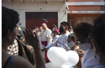
● راعي كنيسة اغويويلا منتقيا لالاهالي