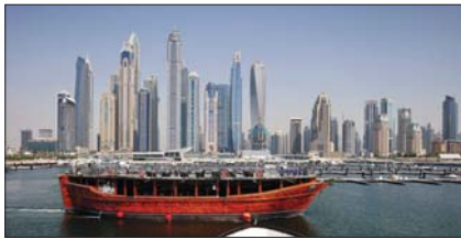
حالة زيادة اللعب الضريبي على الشركات، وتهدد هذه الخطوة الاقتصادية الإصلاحية إلى تعزيز البيرة التنافسية، وبحسب وزير الاقتصاد عدل الله بن عتيق في ترتيب البنك الدولي حول السياسات الاقتصادية لعام 2021.

تستقطب الوعود بحياة من الرفاهية في ظل ضرائب أقل المغتربين والشركات في الإمارات الدولة الخليجية الثرية التي تتطلع لأن تحافظ على هذه الميزة سواء قررت الضريبي في اتفاق فرض ضريبة عالية على الشركات، أم تجتنب ذلك. وتوصل وزراء المال في مجموعة السبع في الخامس من حزيران إلى اتفاق تاريخي، يقضي بفرض ضريبة على أرباح الشركات وتوزيع أرباحها الضريبة للشركات المتعددة الجنسية، في شكل أفضل، خصوصاً للمجموعات الرقمية العملاقة.