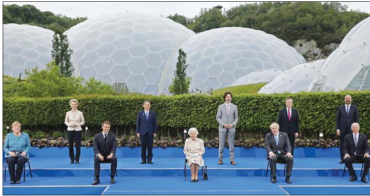
تتوالى قادة القوى العظمى في مجموعة السبع أمس الأحد، حال الطوارئ اللامتناهية في اليوم الثالث والأخير من مقتمهم في إنكلترا، بعدما أبدوا وحثتهم في مواجهة التحديات التي تسببها الوباء في روسيا وتصميمهم على إعادة العالم إلى مساره الطبيعي بعد أزمة كوفيد - 19 .