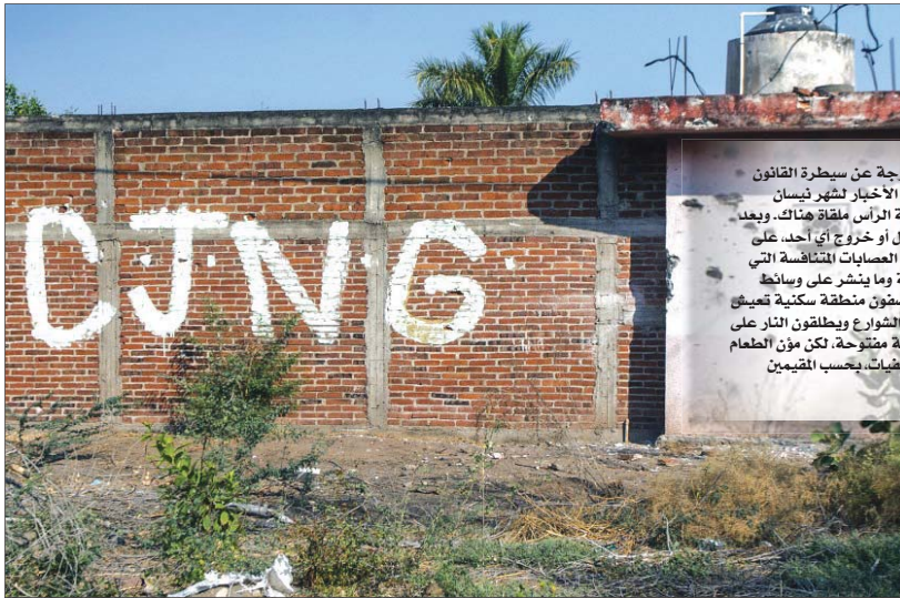
● شعار إحدى عصابات المخدرات المكسيكية مكتوب على الجدران في بلدة اغويويلا

تعد بلدة اغويويلا، من أحد أكثر المناطق الخارجة عن سيطرة القانون في المكسيك فقد تصدرت هذه المدينة منصة الأخبار لشهر نيسان الماضي، عندما عثر على ثماني جثث مقطوعة الرأس ملقاة هناك. ويعد أسابيع تشب قتال، وكان من الصعب جدا دخول أو خروج أي أحد على أقل تقدير من دون تصريح بالواقعة من قبل العصابات المتنافسة التي أغلقت الطرق. ومن خلال الاتصالات الهاتفية وما ينشر على وسائل التواصل الاجتماعي، كان الأهالي العاقبون يصوتون منطقة سكنية تعيش وسط رعب سحابي العصابات الذين يجوبون الشوارع ويطلقون النار على بعضهم البعض، ولا تزال بعض المحال التجارية مفتوحة، لكن مؤن الطعام تتناقص ولا توجد وسيلة للوصول إلى المستشفيات، بحسب المقيمين هناك.