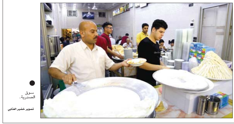
سوق الصردية.

أكد الخائب الأول لرئيس مجلس الكهراء حسن كريع الكعبي، دعم المنظمة التشرية في تعزيز التعاون مع البعثات الأممية التي تقدم خدمات إنسانية وعلمية وطبية للشعب العراقي، وبذل الجهود لإنتاج عملهم داخل البلاد. وذكر بيان للبعثة الأممية الفرق الأممية لمنظمة «أطباء بلا حدود» زوم رئيس المحافظات بهدف تبادل جميع العقبات التي تقف أمام قيام البعثة بواجباتها وخدماتها الإنسانية الكبيرة، مشيدا بما أنجزته المنظمة لحافظة نيوى مؤخرا، والتي تعاني من نقص شديد في الأبنية الصحية والملاكات والأجهزة والأدوية.