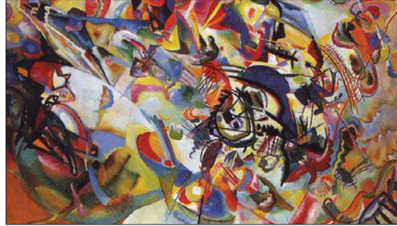
لوحة الفنانة هاني كاندنسيكي

لنا أمثلة من الكتاب كما من الشعراء والفتاين ممن أسسوا حضوراً نال إعجاباً كبيراً وتمتعوا بخصوصية الاحترام، وعلى ما بينهم من اختلاف في نوع الكتابة ونوع الأهمية، هم شهود نقد في تاريخ الأدب أو تاريخ الفن. فمع ذكرهم يحضر ذكر الإبداع والتميز في الأسلوب وفي الانشغال الفكري والموقف من الحياة والألسان. صحيح لنا تعاطفنا وإهتمامنا بهذا أكبر من غير، لكن كلاً منهم مهم وله ما تكبره ونقدرة من أجله، وكلهم صنعوا تقدماً ما تجديداً.