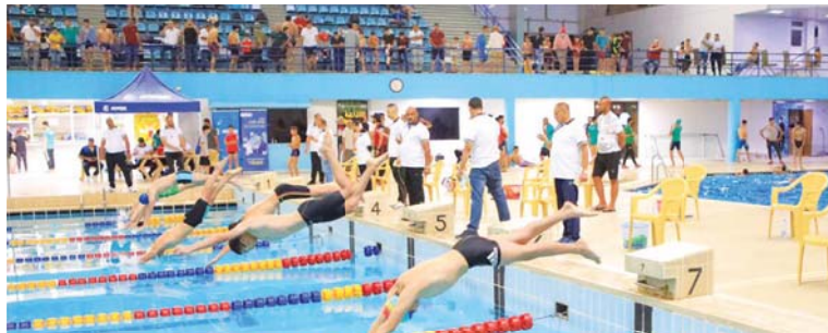
بمشاركة 200 لاعب