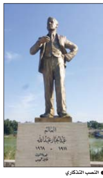
● النصب التذكاري