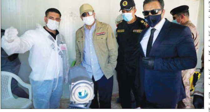
رئيس الوزراء خلال زيارته منفذ مدي