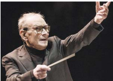
الموسيقار يوسيف يوسف

كان التشويق الاكبر منها الافلام مشهورة، التحصيل فيما بعد الى ايقونات شهيرة، على شاكلة: "الشرس والطيب والقيح" و" من اجل حفة دولارات" و" حدثت مزة في امريكا" و"سينما بارديسو" و" الاسطورة 1900" و" مالينا" و" المنوع لسيم" و" عودة رنكو" وغيرها مئات فضلاً عن 100 مقطوعة كلاسيكية. موسيكوني الذي حاز على جائزة الاوسكار، لأفضل موسيقى تصويرية عن فيلم نورثينج الشهير " القناينة الكروهن" للنتج في العام 2016، قرر ان يكون قوته اللغوي بلا حصة وترك خطاطة توشع بالمشاعر على فيها بخط يده: "انا يوسيف يوسف، اصبحت اياً... صاحب موسيقى احتفالية نهائي كاسي يوسيف يوسف، من عمر ثمانين (90 عاماً)، يولدته لاجرامات هوليوود للعيش في مدينة الشمس.