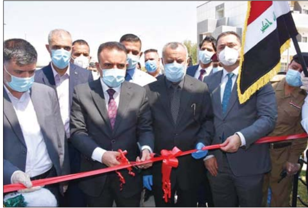
وزير الصحة ومحافظ ميسان يفتتحان مركز الشفاء الطبي