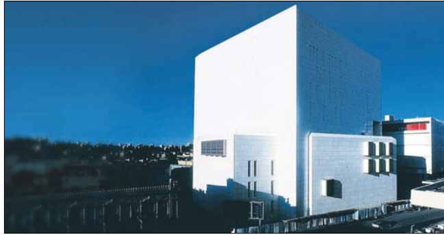
مبنى البنتك المركزي العراقي

التقييم، وقد حصل المكتب على الدعم الفني من البنك الدولي في سبيل إيجاز هذه المهمة. وكجزء من تحقيق استراتيجي المكتب في هذا المجال، فقد صدرت عدة ضوابط خاصة بمكافحة غسل الأموال وتمويل الإرهاب تستهدف أنشطة متنوعة أهمها مسألة إيداع وإخراج العملات الأجنبية والمحلية أثناء سفر المواطنين والأجانب وكذلك الضوابط الخاصة بإبلاغات الحاميين التي صدرت بالتعاون مع نقابة الحاميين مؤخرًا، مع وجود ضوابط أخرى قيد التشريع تتعلق بالحاسبين تم إعدادها بالتنسيق مع نقابة الحاسبين والمدققين العراقيين، وضوابط أخرى مماثلة تتعلق بتجارة الذهب والمعادن الثمينة تم إعدادها بالتنسيق مع الجهاز المركزي للتحقيق والسيطرة النوعية في وزارة التخطيط، ويعمل المكتب مع وزارة العدل لغرض إصدار ضوابط خاصة بدائرة كتاب العدل وبدائرة التسجيل العقاري.