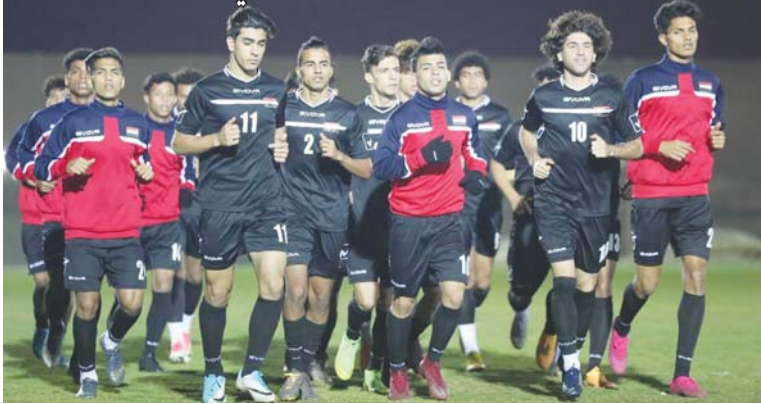
بغداد / الصباح الرياضي