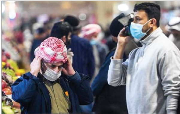
إجراءات مشددة بحق المخالفين لشروط السلامة