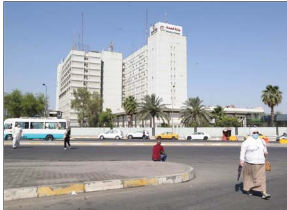
وزارة الصحة تقرر اجراءات وقائية مشددة لمنع انتشار فيروس كورونا..