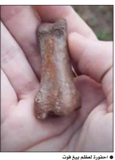
• عظوة لعظم بيغ فوت

وعرض على صفحته في إنستغرام عظمة كبيرة، قائلاً إنها من المستحيل أن تكون لإنسان، مبرراً ذلك بأن المنطقة التي عثر فيها على العظوة لم يقطنها سوى البشر. وأوضح كونور أن العظمة ثقيلة وكبيرة جداً، وبأنها أكبر بمرتين من عظم الإبهام الخاص بالبشر، حسماً نقلت صحيفة «ديلي ستار» البريطانية، وأشار نشر كونور للفيديو أراء متباينة في مواقع التواصل الاجتماعي، إذ اعتبر فريق الكشف عن العظمة دليلاً على وجود «بيغ فوت»، بينما اقترح آخرون إخضاعها للفحص من جانب خبراء وعلماء متخصصين. ويشاع أن «بيغ فوت» العظام يتواجد في الغابات بأميركا الشمالية، إذ تحدث كتيرون عن مشاهدته، رغم غياب الصور والفيديوهات الموثقة التي تحسم مسألة وجوده. وعرضت حكومة ولاية أوكلاهوما الأميركية مكافأة مالية قدرها 500 ألف جنيه استرليني، لمن يعثر على «بيغ فوت» أو يقدم دليلاً علمياً حقيقياً على وجوده.