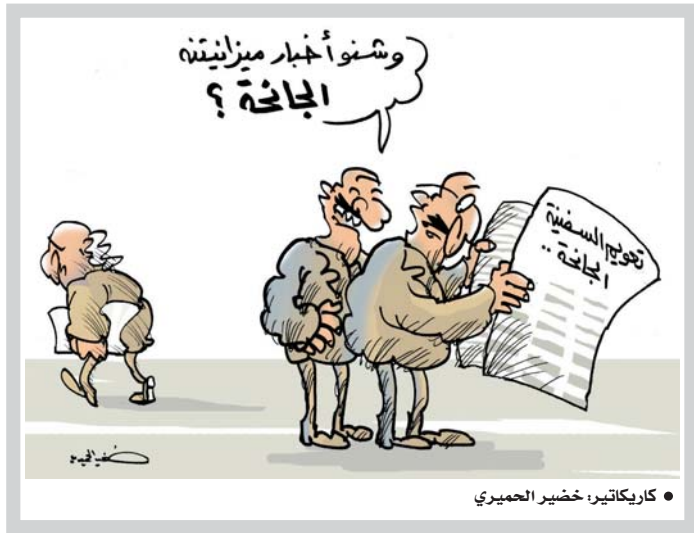
• كاريكاتير: خضير الحميري

الكثير من المؤسسات العراقية شابها عطف ما في أغلب مفاصلها جراء سنوات خالت .. تخللتها كثير مما لا يمكن بعه طائفة القانون والتزاهة والمثالية.. رغم قيام الدولة ومؤسساتها بصرف الكثير من المال معززة بعدد أكبر من قوائم الموظفين الذين يحطلون عنكروين كالكابمية وشهادات علميا وخبراً، ومختلف الاختصاصات .. إذ لا يمكن عد الحال وقمراته إلا ضمن تقييم متراجح على مختلف الأصعدة، وهذا ما لا يحتاج إلى دراسات وجداول ولجان وحساب وكتاب .. مع أننا لسنا بصدد البحث عن التسبب والتسبب بقدر ما نؤشر حالة معينة ينبغي أن تنتهي في في الأقل الحد منها كشرط أساس للانطلاق إلى ما هو أفضل. هنا ثمة سؤال يدور ببعض الرؤوس المتشاكبة والشاكبة والشككة .. منذ مدة طويلة نتحدث عن مسرخر لا نحن فيه.. فهل بالإمكان النهوض بقطاع معين أو ملف دون آخر..؟ بمعنى هل يمكن أن يسود الفساد براس ما .. بينما نذراع أو قدم ان نتعشق وتصلح وتعمل ..