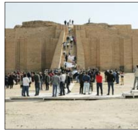
• مدينة اور التاريخية

فرنسيس لمقنا خلال تواجده في العراق، فتمت لنا بوابة جديدة في العزم على تشكيل قافلة لأطفال العراق للذهاب إلى مدينة اور التاريخية، ومن ثم إقامة حفل كبير في منتصف الشهر المقبل. مشيراً إلى أن «الرحلة سوف تستمر لمدة أسبوع واحد، بمشاركة أكثر من خمسين طفلاً من مختلف المذاهب والأطياف والديانات والقوميات العراقية، وستقام تحت شعار «من بغداد إلى أور». إذ ستقدم مجموعة من الفعاليات واللوحات الفنية في المناطق التي ستسجل إليها قافلة الاحتفال، مواصلاً أن «الرحلة سوف تمر لاحقاً على مدن عراقية مختلفة في الموصل وكردستان العراق، إذ ستتم زيارة عدد من الأديرة والكنائس، كما ستضمن الاحتفالية تقديم أشنودة وطنية تحمل عنوان «أور دور» نوحداً في أور، من الحان ماجد العريس، فضلاً عن إقامة معرض تشكيلي وعرض للأزياء العراقية القديمة، التي ترمز للوحدة العراقية والجميعة».