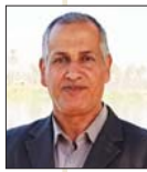
• حسين ياسر

توجد منطقة زخرفية بعرض متر واحد تحوي ثلاثة اشربة زخرفية من الحجر، يشمل الشريط الاول والثالث زخارف هندسية بأشكال نجمة رباعية، أما الشريط الثاني (الوسطى) فيظهر فيه الأفرز الزخرفي على شكل مثلثات، إذ عمد المعمار على التلاعب في وضعيات الحجر، وبين أن القسم الأعلى من المنارة يحتوي على تجاويف بشكل حنيات غير نافذة تبدو على هيئة نوافذ مستطيلة اقرب ما تكون إلى عنصر الزرغل، وهذا ما نلاحظه في الجهة الغربية من المنارة هذا التجويف المستطيل الشكل (الرأس) يتسع من الداخل ويضيق من الخارج، مثلما تحتوي المنارة على مزغل واحد يقع في الجهة الغربية، ولعل السبب في ذلك يعود إلى أن النخل يقع في الجهة الشرقية الذي اكتفي به عن وجود مزغل في هذه الجهة، وتنتهي بعقود أسطوانية مشابهة لما موجود في قاعدة المنارة.