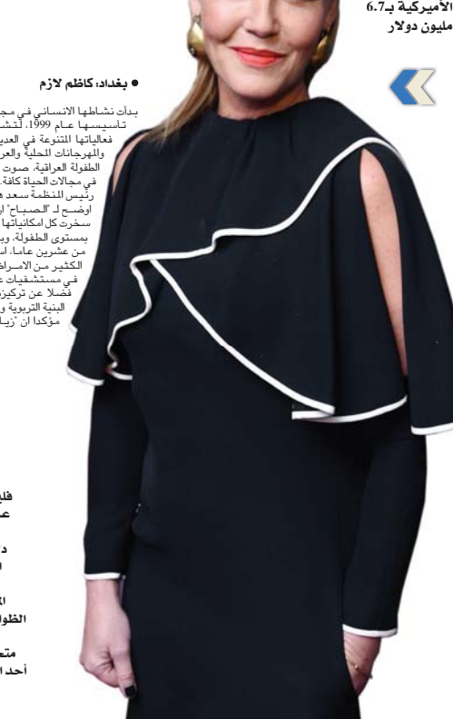
فيلم «لا أحد يظولة النجمة العالمية كوني نيلسن يتصدر إيرادات السينما الأميركية بـ6.7 مليون دولار

• بغداد، وائل الملوك كشف رئيس مهرجان سينما الاميشن، د. عامر صباح السرزوك، خلال حديثه مع «الصباح» أن انطلاق فعاليات مهرجان سينما الاميشن بابل في الخامس من شهر نيسان المقبل بعد أن توقف انطلاقه في الفترة التي تم تحديدها سابقاً، بسبب اجراءات الحظر الصحي والتعليمات التي فرضتها لجنة الصحة والسلامة في العراق.