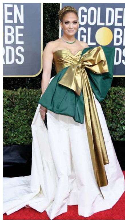
الغنية جنيفر لوبيز الاكثر تأنفا في استطلاع اجري مؤخرا في بريطانيا حول حسناوات تقدمن في العمر، وقد تفوقت لوبيز البالغة من العمر 51 عاما على العديد من المشاهير اللاتي تجاوزت اعمارهن 40 عاما.

المضحك المبكي ان اكثر شخص ناله الاستواء، والتتمر هو عازف الايقاع، واصبحت كلمة طبل اقرب الي الشعبية، بينما كان الطبل قديما هو "ضابط الايقاع" وهذه التسمية دقيقة جدا، ففي التخت الشرقي كان الطبل يأخذ دور الباسيتو، الذي يضبط ايقاع الفرقة الموسيقية، لان الاغنية العربية في ايلست هارمونية انما تعتمد على جارية التنقل بين القامات والاقامات.