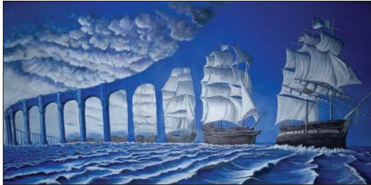
وحة الفنان فلاديمير كوش

يعرف علم السرد بأنه فرع من النقد الأدبي، معرفي، يتعامل مع البنية السردية، وظيفيًا، عبر التزامه بالقواعد والقوانين المقررة مصطلحياً، وأو مفهوميًا. لذلك يختص هذا العلم بكل من السارد، الذي يستمر المؤلف وراء وجهه وتظهر المسرد له، المتقبل ليس المستقبل فحسب، المسرود، ما يصدر عن السارد وادرا إلى المسرد له. هذا الأخير، الثالث، يجب عليه الانتظام تشكيل مجموع أحداث مقترنة بشخصيات مؤطرة الأزمنة وأماكن.