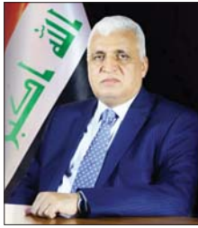
القياض، فتوى الجهاد الكفائي هي صاحبة الفضل الأول في تأسيس الحشد الشعبي

العراقية بان نتيجة الاعتداء لن تمر دون عقاب". ولغت الى ان اطلاق المرجعية الرشيدة للفتوى الجهادية الكفائية جاء في سلسلة جرائم ابادية جماعية ضد ضمة الارهاب الباطني التي تزدت كثيرا ونشر القلا في الاراضي العراقية ولكن حكمة المرجعية السنية على الفتوى الجهاد الكفائي استطاعت ان تقهر الارهابيين وكل من تسول له نفس الاعتداء على الاراضي العراقية. وأضاف: علينا ان نخلد ذكرى الفتوى الجهادية، ونعتبرها من اهم الامام التي تحدر على ارض العراق ونحذر الارهاب وسيدخل شهداء الفتوى من ابناء الحشد الشعبي الابطال في تاريخ العراق، من جانب، بين الثالث عن تحالف سلطون عباس العلوي، ان ذكرى فتوى الجهاد الكفائي تعيد للاذهان صلاة العراقيين من ابناء الحشد الشعبي والنطوين للقتال على اتر الفتوى والذين شوا رحالهم الى ارض المعركة للاستشهاد في سبيل العراق ضد الارهاب الباطني. واكد لـ «الصباح» ان الفتوى كانت يد النجاة لكل العراقيين من عصابات داعش الارهابية واطلاقها كان مصدر الفورة في ذلك التوقيت ومبارك في الاعتراف حيث سجل العراقيون اهم البطولات ضد الارهاب العالمي.