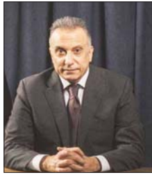
الكاظمي، نداء المرجع السيستاني أوقف امتداد عصابات داعش وأفشل مخططاتها السوداء

رئيس مجلس الوزراء القائد العام للقوات المسلحة، مصطفى الكاظمي وجه أمس السبت، كلمة بمناسبة الذكرى السادسة لفتوى الجهاد الكفائي المباركة، قال فيها: "في مثل هذا اليوم، قبل ستة أعوام، نهض شعبنا بعزيمة أدهشت العالم لصد وحر تلك العاصمة الارهابية الكبرى التي مثلتها عصابات داعش الارهابية، بعد ان تجاسرت على أرض العراق".