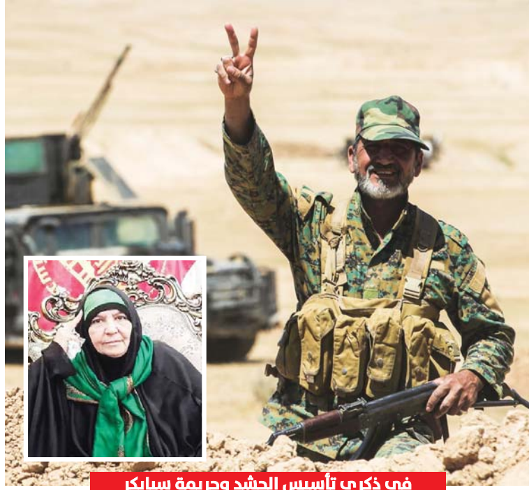
في ذكرى تأسيس الحشد وجريمة سبايكر