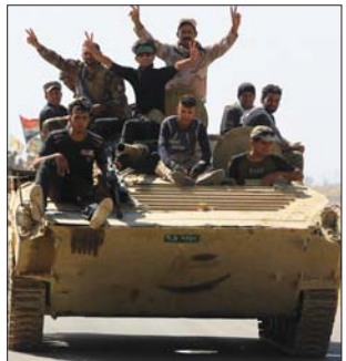
قوات من الحشد الشعبي

وقال مسؤول خلية الاعلام الحربي لقيادة محور الشمال "ان قوات الحشد الشعبي احتفالية بالذكرى السادسة لفتوى فتوى الجهاد الكفائي وتأسيس الحشد الشعبي الذي كان له الدور البارز في التفتي لفتوى الجهاد الكفائي التي اصدرتها المرجعية الراهبية وتحرير المناطق من الاليمية بصحور الشمال