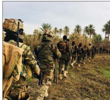
قوات أمنية تظار عميات داخل الراهبية

كثفت قوات الحشد الشعبي انتشاره في الطرق المحلية الواقعة على الحدود العراقية السورية لصد أي محاولات لتسليم لعضيات "داعش" الإرهابية، بينما بدأت القوات الأمنية في محافظة ديال عملية تفتيش واسعة بحثاً عن العناصر الإجرامية التي أقدمت على اختطاف سبعة مواطنين.