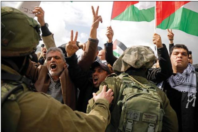
ليلان - استمرار المظاهرات

صواريخ فلسطينية على الأرض، طغمت الفضائل الفلسطينية مساء أمس الأول الخميس، 3 صواريخ من قطاع غزة باتجاه إسرائيل، ما أدى إلى تشغيل سفارات الإنذار في مستوطنات غلظة غزة، وسط دعاة الصواريخ في منطقة كلبية "سامير" قرب مدينة سدويرت، ما أسفر عن اندلاع حريق في المكان، من دون الكشف عن مزيد من التفاصيل بشأن الصاروخين الآخرين. في المقابل، التفت الشرطة الإسرائيلية بمواجهة كبيرة المسجد الأقصى، أمس الجمعة، وبعادت المصلين أثناء خروجهم من الصلاة. وكانت وسائل الإعلام عن أكثر من 15 مصلياً أحيدوا بالحراس المطاطي في ساحات الأقصى، لعدم اضمحاض في راسه، كما اعتدت قوات الشرطة على المصلين عند أبواب المسجد، واعتقلت شاهين عند باب "حطة". ودعت الشرطة الإسرائيلية بتعزيزات كبيرة واستخدمت الكبدرة في شارع الجاهدين في المسجد الأقصى في القدس المحتلة، وكذلك القوات الإسرائيلية في القليل، لئلا، صلاة لأعزب ضمن حملة "الفتح العظيم"، الجمعة العظيمة لمواجهة "صفقة القرن".