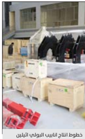
خطوط انتاج انابيب البولي ايثيلين