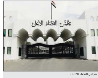
محلس القضاء الاعلى