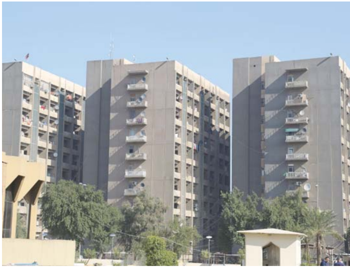
● عمارات سكنية

بغداد / بشير ذرغل < تصوير / نهاد العزاوي