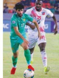
كريلا الدولي وسيفتاحت نادي الشرطة الاتحاد القاري بشأن اعتماد ملعب فرانسوا حبريري في خطوة استباقية الهدف منها قطع الطريق أمام أي ناد يربغ بالعب في كريليا .