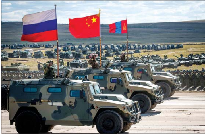
تدريبات عسكرية روسية صينية مشتركة