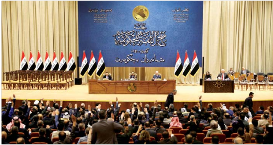
جلسة البرلمان لصنع الثقة للحكومة... أرشيف