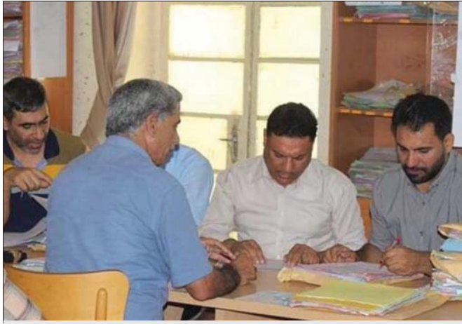
فرز ملفات تعيينات سابقة بالمحافظة

محافظ بغداد المهندس محمد جابر العطا، افاد بتصريح خاص به الصباح بان المحافظة ستطلق قريباً الدراجات الوظيفية للعام الحالي 2020 ضمن حركة الملاك لعام 2019، وذلك بحسب قرار مجلس الوزراء القاضي باطلاق التعيينات بشكل مستمر ضمن حركة الحذف والاستحداث للعام الماضي 2019. واوضح ان هذا الامر جاء على اثر احواله عدد كبير من الملاكات الترتيبية على التقاعد بحسب قانون التقاعد الجديد، إذ تنوّف في كل عام 500 الى 600 درجة وظيفية بكل مديرية. بيد ان هذا العام قد يزداد فيه العدد من الدراجات الوظيفية لاستيعاب أكبر عدد من المتقدمين. مبيناً ان المحافظة بصيغتها دائمة تدرى عملية احصاء المحالين على التقاعد لديها من اجل رفع المحافظة واعادتهم لاطلاق التعيينات. في السياق نفسه، لغت العطا الى ان ملف المحاضرين المجانيين يعد من الملفات المهمة التي ازلتها المحافظة اتمية بالغة، وقد اتخذت اللازم من اجل حسمه بالسرعة الممكنة. مؤكداً ان المحافظة تكتد خلال العام الماضي