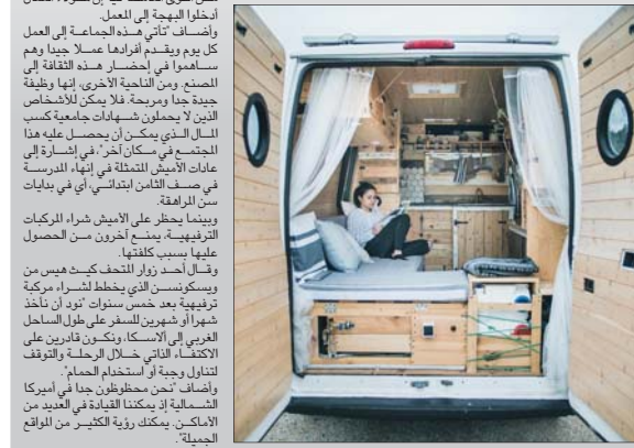
تبدو المركبات الترفيهية التي ينتجها مصنع «يفرسايد» في ولاية إنديانا الأمريكية أقرب إلى البيوت منها إلى السيارات مع الأسقف الخشبية والألياف الزجاجية العازلة ولونها الأبيض اللامع.

أواخر العقد الأول من القرن العشرين، وبعد فترة نمو استمرت ثمان سنوات، فقد هبات كما تفعل كل الصناعات». وأضاف «هناك بعض من ذلك الأمر، لكنني أعتقد أن هناك أيضا تباطؤا عاما في الطلب على هذه الأنواع من المركبات». وأوضح «يمكنني أن أقول إن صناعة المركبات الترفيهية ما زالت بخير، لكن مقارنة بالأنواع القليلة الماضية، هناك بعض الركود».