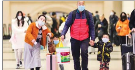
اجراءات احترازية ضد فايروس كورونا