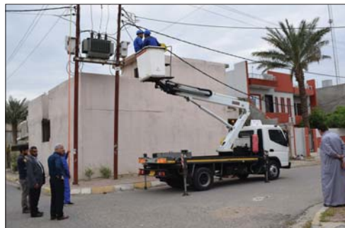
مباني حوالات كهرباء بالمناطق المحررة