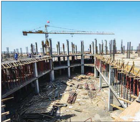
مشروع استثماري في البصرة

النتج الوطني. وأضاف حيايل أن "الشركة العامة للحديد والصلب تواصل العمل في تأهيل المعامل المتوقفة لتي تستهم في توفير النتج المحلي في السوق العراقية وتقليل الاعتماد على الاجنبي المستورد".