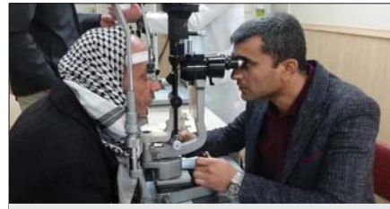
شؤون مستشفى ابن الهيثم