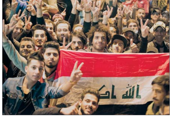
تربق شعبي لتسمية رئيس الوزراء...