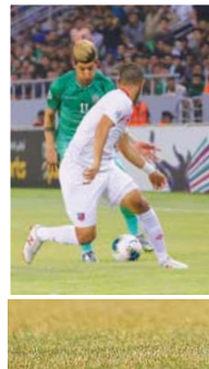
ادارة الشرطة والملوك التدريبي واللاعبين مطالبون بطي صفحة توقيع البطولة العربية والتركز على مسابقتي الدوري العربي ودوري ابطال اسيا