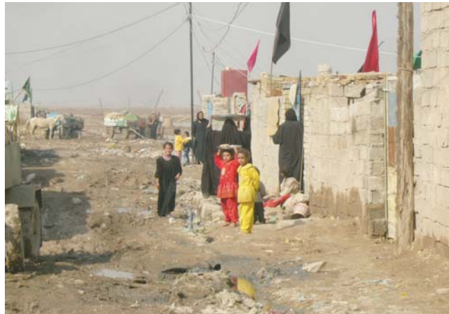
● طفح المجاري، سوء الخدمات، عشوائيات، فقر/ منطقة الحميدية

المرجع، والتي يتم توزيعها من قبل لجنة التخصصات المشكلة بالمحافظة وبمصادفة الحفاظ.