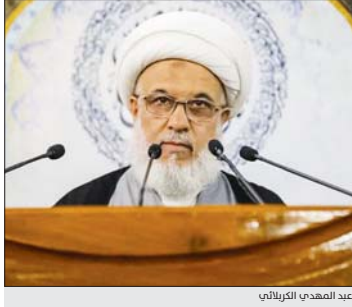
عبد المهدي الكربلائي

أكدت المرجعية الدينية العليا، أمس الجمعة، أن البرلمان المقبل هو المعنى باتخاذ الخطوات الضرورية للإصلاح وإصدار القرارات الصورية التي تحدد مستقبل البلد، مطالبة بالرجوع إلى صناديق الاقتراع «نظراً للاقتضيات التي تشهدها القوى السياسية»، وبينما حذرت من قيام البعض بالاعتداء على القوات الأمنية والأجهزة الحكومية وما يمارس من أعمال تخريب وتهديد ضد بعض المؤسسات التعليمية والخدمية،