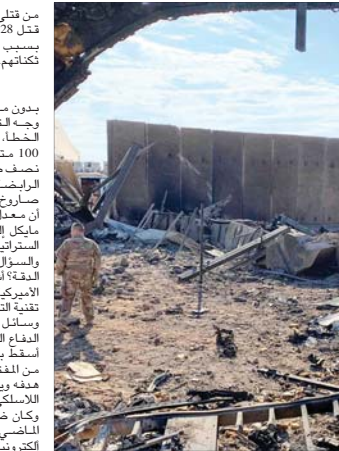
آثار الضربة الإيرانية على قاعدة عين الأسد

وكان ضرب نقطة معينة على الأرض في الماضي يتطلب وجود رؤية بصرية أو الكهرونية للهدف، إما بجهاز التتبع عن بعد عبر كاميرا تلفزيونية مثبتة على الصاروخ أو شخص يوجه الصاروخ بتوجيه الليزر من الهدف. والبدل إذا ما نتج تلك الأساليب هو قطعة تكنولوجية متفحمة تدعى «نظام الملاحة» للصواريخ الذي يستخدم الدورات لتحديد اتجاهه وإحداث قياس تسارع مثبتة على الصاروخ لحساب موقع القذيفة وسرعاناً تسمى إلى نقطة انطلاقها. يقول آرون كارب من جامعة أوك دوميونيو