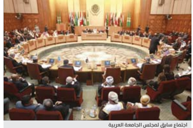
اجتماع سابق لمجلس الجامعة العربية

بغداد / الصباح القاهرة / إسراء خليفة يترأس العراق اليوم السبت اجتماعاً طارئاً لجلسات الجامعة العربية على مستوى وزراء الخارجية لبحث تداعيات صفقة القرن، في وقت أيدت فيه الأمم المتحدة استعدادها لتقديم الدعم لضمان وحدة واستقرار العراق.