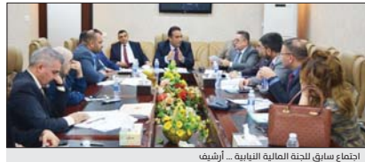
اجتماع سابق للجنة المالية النيابية... أ.رشيد

هذا ذلك سننسخ جميع الاجراءات القانونية بحقه». وكان مجلس النواب قد صوت في جلسة سابقة على مقترح قانون الإدارة المالية الاتحادية رقم (6) لسنة 2019.