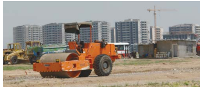
● بناء عمارات سكنية

وأوضح مدير البنيات العامة عن أن ملاكات بالتره تكلف حالياً على تهيئة مشروع المدن الجديدة التي سيتم إنشاؤها في المستقبل القريب بالتعاون مع وزارتي المالية والزراعة من خلال تخصيص آلاف الدونومات في المحافظات و أن بيعها سيتم بموجب القرار 419 لسنة 2019 بديل مقداره 250 ديناراً للمتر