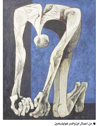
● من أعمال أوزولد غوباسيمان

ولم نتحصل على الخبز وفرغاً للثبي دمعة كبيرة جداً.