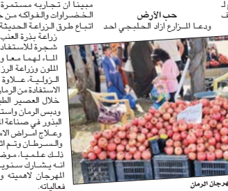
من مهرجان الرمان

حلبجة، عنراء جمعة اختتمت اسس السعيدت فعاليات مهرجان رمان وخريف حلبجة السابع التي بدأت الخميس الماضي في ساحة ملعب حلبجة الرياضي واستمرت لمدة ثلاثة ايام برعاية مجلس المنظمات المدنية وتحت اشراف وزارة الزراعة في الاقليم، استقطب المهرجان آلاف الزائرين من مختلف مدن ومحافظات كركستان العراق. وقال المدير العام لزراعة حلبجة ستار محمود في تصريح لـ «الصباح» ان «المهرجان ذو اهداف اقتصادية وزراعية وهو يسهم بالتعريف بمدينة حلبجة من خلال عرض فاكهة الرمان والعصائر المستخرجة منها، فضلا عن المحاصيل الزراعية الاخرى التي تنتجها المدينة من اجل ترويجها الى الاسواق الخارجية». منوها بسان «مدينة حلبجة تتميز بانتاج آلاف الاطنان من الرمان سنويا لتغطية الحاجة المحلية بالإضافة الى تصدير كميات منها الى الاسواق الخارجية».