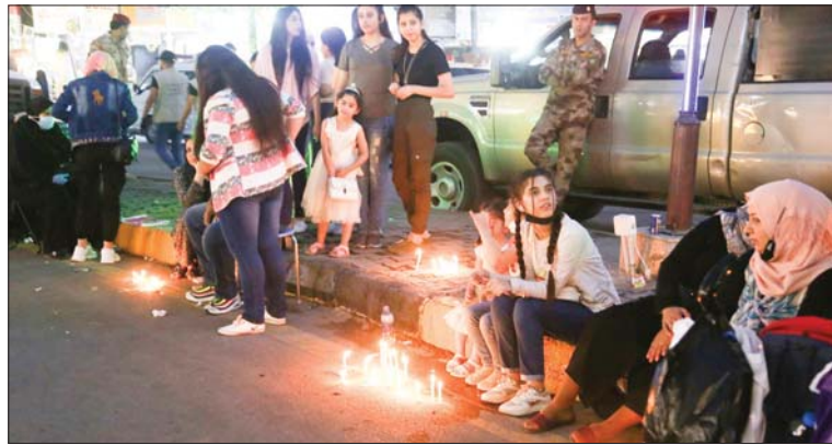
توقد الشموع وتتوهج القلوب بالفرح

يوم متشح بالبياض، هنا تفتتح الارض شموعا وتزين الطرقات بالورود، وتتلون قيب المساجد بالاذاعة والزينة، وتقام الموائد وتوزع حلوى الفرح في الاحياء والازقة، وهناك فرح يصيب الحضور، وبميكبرات الاصوات شمة جو روعي خاص تتشاركه الارواح وان اختلفت الهويات، تتلحق الافراح بعد ان يغمرها هدوء وسكينة، ما ان تطلق الاناشيد وتعلوها الدوقف،