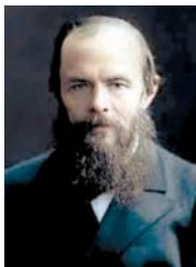
● التوازن محور العالم عند دوستوفسكي