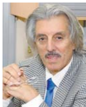
● يتوقف نوري بصمت مرين لسماع صراخ مجانين بوكا

نوري الذي قطع المسافات البعيدة، صزار وجها لوجه مع أمثالات البون التاسع، وتيميز الغنق السعيق، وملاحة هجعة ووضوءة الناطقة وبسطوة الملاحه وسطلان الهجعة ووضوءة وصلابة التماهي وسلطة الوتر والبروق وتآثير النضارة، حتى أقر أن يردع من كاهله أحوال الرتماء، في أحضان الأخر (لمرض) يشوادة أحمد المدني التي ائتمت بكل ما فيه من وعي، من البلاوات والانتقادات والإخواتيات الغنية، والندام الغنوية، والصفاء الشروخة كالنشدان يسي لا يجرعه سوى العهد والمجبة والود، متوجهاً إياها بميثاق الأبداع شاكر نوري السوروني المشهور، المشمر المنهج، والصحفي المستكشف والمعاور ثبت براءته.