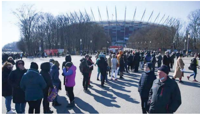
• لاجئون أوروبيون أمام الملعب الوطني في وارشو

وحسب اختصاصيو علم النفس وقبول الخبر التكنولوجي ياكوب نيميك، المسؤول عن السكن والتنقل، "عمل بجد وطاقت، وكانت خطتي السفر إلى المكسيك، لكن الحرب بدأت فيل معادرتي، وفكرت البقاء، تذكرتي والبقاء هنا لتقديم المساعدة".