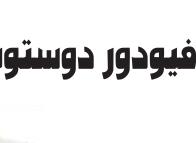
● تخيلته بالرمانج

حققت الرواية نجاحاً باهراً أدى هذا النجاح إلى تبين آراء المجتمع الأدبي بشأنها، لا سيما التقاد الروس وغير الروس، وأسهم هذا الجدل في ترجمتها عالمياً.