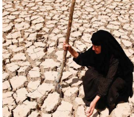
اعتماد الفلاح العراقي على وفرة المياه، لا تقصها

في تقرير صادر خلال شهر كانون الأول الماضي، أطلقت وزارة الموارد المائية العراقية تحذيراً أشارت فيه إلى الاستمرار بقتادان مياه نهري دجلة والفرات، اللذين يعدان العمود الفقري لموارد البلاد من المياه العذبة، يمكن أن يسهم في تحويل العراق إلى «أرض بلا أنهار» بحلول العام 2040.