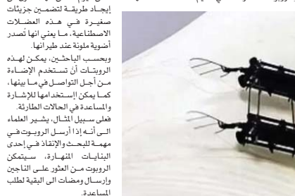
عن موقع تيلر ريبورت الاخباري

ويوضح الباحثون أنه يمكن لهذه اليراعات الروبوتية الصغيرة، والتي تشبه الحشرات عن طريق زفرقة أجنحتها برسمة.