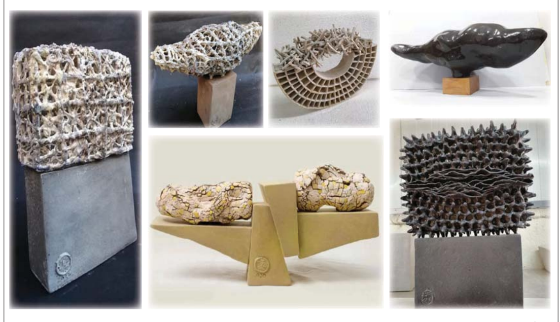
● من أعمال الفنان

لم نع محوى خطاب تلك الأشكال التي تبدو مهمة، وجزء منها تراكم فيه إزاحات شكلية، ولو تخضنا نتائجها المبررة لوجدنا عجزاً في تصوير إنتاجها الداخلي، أعماله تعيل لمن خارج عن الذائقة بخلاف الغالب من فنانين الخزف، إذ يعملون لولائف تقليدية تكن مع شنيار هناك تصور من إنتاج بيانية تجديس حساً داخلها للفنان حتى لو بدت غرائبية تلك الأشكال في السيراميك الذي لا يقبل الغموض، لأنه فن يقرب من حرفة يتعامل معها الغالب منا؟ ثمة شعور بالانتماء لعلامات خالدة وحروف وتكوينات ذات طابع رمزي احتضني بها في عمله، إنه يستعير الإشارات ليقيم الأفكار التي تخضض له، وهذا القول دائماً مع شنيار إن فرادته مثالية لو تضاف إلى الأمر مع غيره، فحقق يديول بأنه يستند فكرة فنه من خلاصات تصلق بفن فريد ويطيعة مميزة، وهنا تعيب المهارة والقدرة وأصل فكرة الاختلاف في الفنان الآخر الدور في تأسيس هذا المعنى.