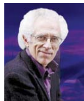
● تزهقان تودروف

العربي الأول يكتب أو يقول قصيدته دولماً تفكير مسبق، باختيار موضوعه (الغرض) وينسج البحر، قبل تعاد الفراهيدي لتظام البحر، فقد ساعد الشاعر في التصريح الأموي والعباسي والعصور التي تلت يفرض الألا، ويعتاد موضوعاً ما، ويلزم نفسه ببحر معين، ويحدد حروف السوي، قبل شروعه بكتابه قصيدته، وعند جبل اليربادة العربية وعند بعض من شعراء الجيل اللاحق فقد اختص حرف الروي، وظل الغرض والوزن قائمين، بوصفهما قوام القصيدة، لكن الوزن وحرف الروي والفرص يعمدهم القديم، ربما اختفت عند شعراء الجيل الجديد (جيل قصيدة التشر) تنقع على فهم وشكل جديد للشعر.