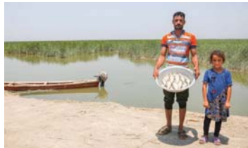
• نقص المياه الأثر الكبير في سبل عيش المزارعين والصيدان

ويوجد طمام مجاني في كل مكان داخل المدن، بدءاً من شاحنات الباصات، على يد اللجوء الوطني إلى قيام المعلم خارج المحطات، وبحث المدارس بالتلاميذ الجدد وفتح عشرات آلاف المستفيدين منازلهم أمام الوافدين، الذين يستطيعون البقاء 18 شهراً على الأقل ويمتلك جميعهم حق العمل.