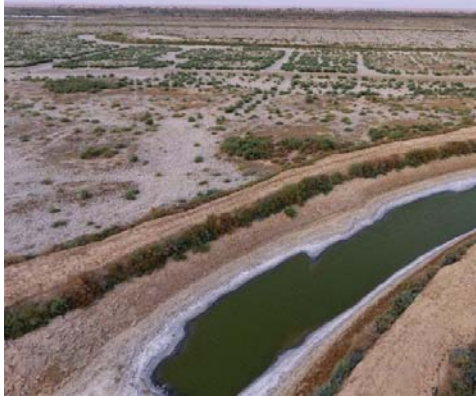
العراق أمام خيارات لمدره لعمود خطير شيخ الجفاف عنه