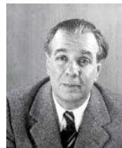
● بورخيس الشعر تجربة جديدة

أعترف بأنه كاد أن يفنى علي، يوماً، وأنا حاضر في ورشة تدريبية صغيرة لتعليم الشعر، فقد كنت جاهداً في إيهام تعريف له، فخرجت في تعريفي عن العرب، عبر الجملة التأهيلية جداً: الكلام الموزون المقفى، ولم جد بيت حطية الشهير «الشعر صعب طويل سلمه، ما أقرته، وانتقبت من ريشاردز وما كليكش وتودروف وغيرهم الأستر الكبرية، محاولاً تقريب صورته إلى