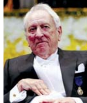
● ترانسترومران يعيش أيماناً من دون أن تتعلمنا الأرض

كان ترانسترومر شخصاً بسيطاً متواضعاً، وقصيدة (البلطيق) التي كتبها عام 1974 تسرد قصة حياة جدوده، أمواج من الصور موسيقية تتدفق في المقاطع، محاولة تجارب البحارة اليومية إلى مجال مهير. دار نقاش بين الشاعر وزوجته ميتيكا عن دور الشاعر وروبرت بلادي في تشجيعه على كتابة قصائد نشر، فقلت ميتيكا بأن بلادي لم يحب قصيدة (البلطيق) التي كرس لها ترانسترومر جهوداً كبيرة مستخدماً أسلوباً مباشراً أسلساً وهو