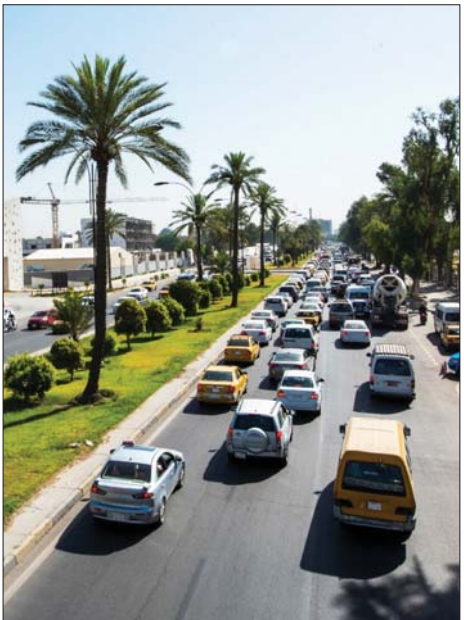
الحظر الجزئي في بغداد