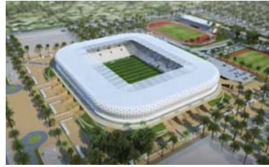
تصميم ملعب الناصرية الأولمبي

خلال تقديم الشركة تجمعا تبادلا بالاستمرار بالعمل وحسب توفر السيولة المالية لرفعها الى وزارة التخطيط لاستكمال الاجراءات والوفاءات المطلوبة باسرع وقت ممكن، من جهة اكد مدير عام الدائرة الهندسية الانحماض تخضع عن اتفاقيات مهمة تشكلت في التاكيد على اكمال ملحق العقد الخاص باستئناف العمل في المشروع من