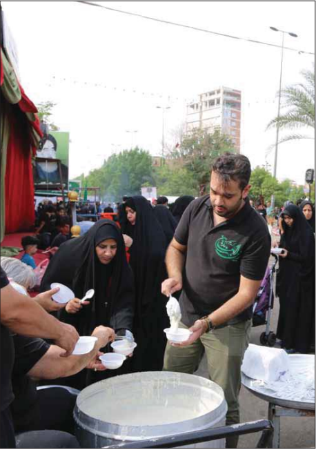
● انطلاق الشعائر الحسينية