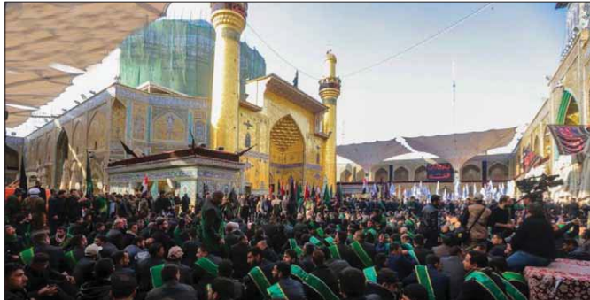
التبج الاشرف / حسين الكبي

انطلقت في العتبة العلوية المقدسة الشعائر الحسينية العشرة الأولى من شهر محرم الحرام، وهي مخصصة لاستذكار واقعة الطف واستشهاد الإمام الحسين بن علي (ع) في العاشر من محرم.