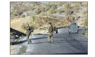
بغداد / الصباح

تواصل الغارات التركية، باستهداف المواطنين في دعوك، إذ أفاد مصدر أمني من المحافظة بتجدد القصف التركي على قرية واقعة شمال العراق وقال المصدر، في تصريح صحفي، ان «الغارات التركية تجددت، مستهدفة قرية دقري بقتضاً، أكدت التابع لمحافظة دعوك» مشيراً إلى «عدم معرفة الحساتن حتى الآن».