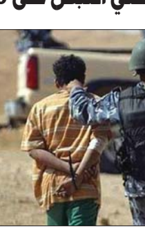
نينوى / الصباح

استخبارات وكالة الاستخبارات، من لقاء القبض على 9 إرهابيين في محافظة نينوى، وقالت الوكالة في بيان تلقت «الصباح» نسخة منه ان «مفتاز وكالة الاستخبارات المختصة باستخبارات نينوى قبضت القبض على (9) إرهابيين منطلقين من المحافظة» مبيناً انهم «مطوبون وفق احكام المادة (1) اهراب،