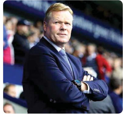
رونالد كومان، مدرب نادي برشلونه.

أكد نادي برشلونه وصيف بطل الدوري الإسباني لكرة القدم أمس الأربعاء أن الهولندي رونالد كومان سيكون مدربا له حتى عام 2022 وذلك عادة إعلان رئيسه جوسيب ماري بارتميو تعيينه على رأس الإدارة الفنية للفرق.