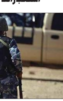
نينوى / الصباح

الجند وفرقة البرموك» وتابعت انه «من خلال التحقيقات الأولية معهم اعترفوا بانتهماتهم للعصابات الاجرامية واشتركوا بعدة عمليات إرهابية ضد القوات المسلحة والمواطنين»، مشيرة إلى «تم ضبط كندس للعثمان من تحلفات مصاحبات داعش الإرهابية داخل أحد الأحياء في قرية زلعة ضمن نينوى، بإخافة (750) قنطرة هاون تستخدم كعيجوات ناسفة».