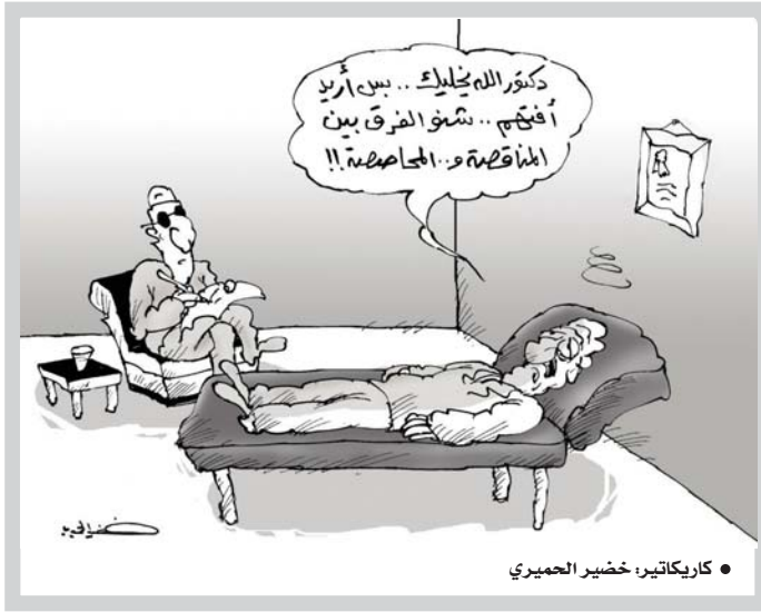
• كاريكاتير: خضير الجميري

ففضلاً عن أسباب أخرى منها الانتقائية والحسوية في تطبيق القوانين ليس في قضية كوروننا فقط بل في قضايا كثيرة في الشهود العراقيين والاستقنات غير المررة لأقراء وجهات كثيرة تجعل المواطن العادي يشعر بأنه الوحيد الذي يحمل أعباء، تطبيق القوانين وتصحيح لديه الرغبة في مخالفتها وفق الوعي الخاطئ الذي يصيب سائنا بسبب أخطاء الجهات التنفيذية والقضائية. وعندما نريد أن نتجح في تجاوز أزمة كوروننا في العراق وتطبيق قوانين الحظر بطريقة صحيحة فعلياً إنسان القوانين الصارمة بإجراءات مستاندة لها، وإهمنا الوصول إلى المواطنين الذين يعيشون تحت خط الفقر وعمهم السواد وإغلاق المتاجر وفرض لبيس الكمامة على المواطنين، وكان التطبيق نسبياً من دولة إلى أخرى نظراً لاختلاف أشياء كثيرة بين الدول. الحظر لم يكن التطبيق بمستوى الطموح بالرغم من وجود قوانين عراقية مهمة لا يتم تطبيقها أو الالتزام بها لأسباب كثيرة في مؤسساتنا ضعيف الأوجهة التنفيذية وغياب الوعي المجتمعي بأهمية تطبيق القوانين.