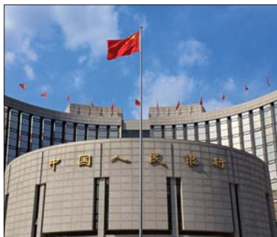
● البنك المركزي الصيني

قال مستشار السياسات لدى بنك الشعب الصيني (البنك المركزي) ليو شي جين إن الناتج المحلي الإجمالي للبلاد قد ينمو 8 - 9 بالمئة في 2021 في ظل «ظروف اقتصادية»، وما يزيد عن 15 بالمئة على أساس سنوي في الربع الأول. وتوقع ليو أن هذا سيكون نتيجة مستوى أساس منخفض للتحديات، والبيانات التي تسمح بتأثيرات عملة العمل، وقبولها للمهاجرين، ومتوسط تكلفة الإيجار لشقة مكونة من غرفة نوم واحدة ودرجة مؤشر السعادة العالمي. وتصدرت كندا القائمة على مستوى العالم، حيث جاءت في المرتبة الأولى، تليها المملكة المتحدة، ثم رومانيا. أما على الصعيد العربي، فتصدرت الإمارات المرتبة الأولى عربياً، والمرتبة 13 عالمياً، لتتبعها الكويت في المرتبة الثانية عربياً ثم السعودية في المرتبة الثالثة، كما سجلت القائمة مجموعة من الدول العربية الأخرى كالبحرين والقطر والجزائر وتونس ولبنان ومصر والبحرين والجزائر.