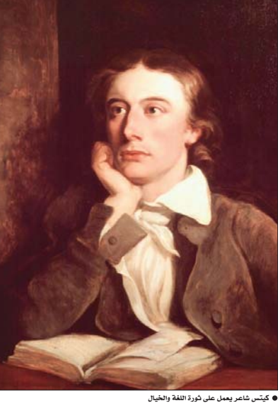
• كيتس شاعر يعمل على ثورة اللغة والفن

«سادف في القبر الهادئ، يكتفي الشعور ببرودة الأرض علي، وازهار الأحوان تنمو فوقه، يا لهنا السكون، ستكون في المرة الأولى بالنسبة لي»، هذه هي الكلمات التي أختارها حين يزار قبره، حيث ذلك منذ ما يقرب من 200 عام، في الثالث والعشرين من شهر شباط من العام 1821، عندما توفي الشاعر الانكليزي، جون كيتس، إصابته بمرض السل. كان كيتس قد أوصي بأن تحفر عبارة «هنا يوقد شخص كُتب اسمه بالما»، على شاهد قبره، إذ لا يزال بإمكان زوار المقبرة البروستانتية في روما، رؤيتها حتى اليوم، لكن بعيداً عن عبارة «كُتب بالما»، لا تزال كلمات كيتس تتردد ولها صداها من خلال مجموعة كتابات وفعاليات تقام للاحتفاء، بالذكرى الثموية لرحيله. يقول أنكوس غراهام كامبيل الكاتب المسرحي والأكاديمي، الذي تروى سيرته «كُتب بالما، Writ in Water» قصة الأسابيع الأخيرة لكيتس: «على مدى 200 عام، كانت سمعة كيتس تزداد سموًا، في الوقت الذي كانت سمعة معاصريه بين علو ووتو». مضيفاً «الهب رحيله المبكر، وحبته المحكوم عليه بالفشل، وشخصيته الساحرة، وإطلاته الجميلة، إلى جانب شعره السهل والترف، ومخيلات الأجيال، وسعته سمعته بالسمو». وامتدًا، بتذكارة السنوية، تعمل جمعية الشعر بالتعاون مع «منزل كيتس» في