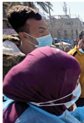
● لائحة تجري مسحات لكشف عن فيروس كورونا في سوق الشورجة.

كشفت الهيئة العامة للضرائب عن حجم إيراداتها خلال عام 2020 التي بلغت ثلاثة تريليونات و800 مليار دينار، بزيادة بنحو 23% عن إيرادات عام 2019 البالغة 3 تريليونات وثمانمائة مليار دينار. وأكدت أن هذه المبالغ تحسّلت رغم جائحة كورونا والإغلاق التام وتأثر التجارة والأسواق وعودة المقاولات فضلاً عن انخفاض أسعار النفط إلا أنها حققت إيرادات قياسية خلال العام الماضي، وتوقّعت الهيئة ازدياد الإيرادات بعد إقرار مقرراتها المتعلقة بهذا الجانب. وعن الأثبات الجديدة لتوسيع واردات الضرائب من الحد من التهرب الضريبي والأتمتة الإلكترونية، قال مدير عام الهيئة العامة للضرائب شاكر محمود حسين لـ"الصباح": "وصممت الهيئة بعد زيادة الحصيلة الضريبية عدة خيارات، منها ما أدرج ضمن البروق البيضاء، العروضة على الحكومة ومنها فرض ضرائب إضافية على السلع الكمالية مثل التبوغ والسكائر والمشروبات الكحولية".