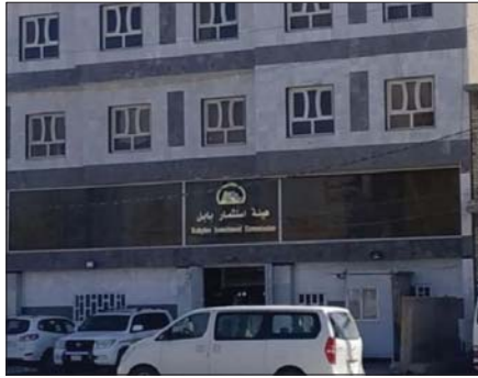
● مبنى هيئة استثمار بابل

وهد أوصرو التعاون والتنسيق بين الجانبين، دعماً للقطاع الاستثماري في المحافظة والاستفادة من تجربة الإقليم في مجال الاستثمار. مبيناً أنه بحث عدة قضايا منها إنشاء مدينة الحلة الجديدة عن طريق الاستثمار بشكل كامل. داعياً لرئيس استثمار الإقليم ونخبة من مستثمريه لزيارة محافظة بابل لتحقيق ملتقى اقتصادي لبناء أوصر عمل وشركات بين مستثمري الإقليم والمستثمرين الفاعلين في بابل، الأمر الذي يسهم في بناء الاقتصاد الوطني وتوفير فرص العمل عبر نافذة الاقتصاد.