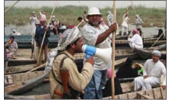
● صالح في أحد مواقع التصوير

وشأن أحدث اعماله كشف عزام عن «الأيام المظلمة» ستشهد تصوير فيلم تلفزيوني عن رواية الكاتب المصري محمود عبد الوهاب والتي تحمل العنوان «سيرة بحجم الكف» سيناريو حسين علاوي، ضمن خطة ومشروع مديرية الدراما التابعة لشبكة الاعلام العراقي.