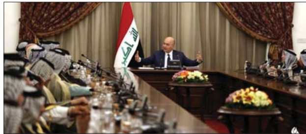
● بغداد، الصباح

أشاز رئيس الجمهورية، برهم صالح، إلى الدور المهم الذي تلعبه النجف والمرجعية الدينية وشيوخ عشائرها ووجهائها في البلاد، عبر الاحتفاظ على التسبب الاجتماعي فيما تمثله المدينة من رمز للاعتدال