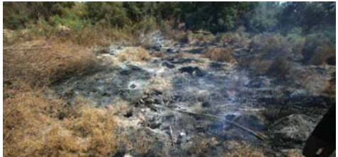
● تفاصيل 3

البياسري إلى استثمار حقول النفط الموجودة بين تكربلا، وبابل والثنى عن طريق جولات الترخيص أو الاستثمار محافظات الفرات الأوسط وتحقيق التنمية الحثيثة. وقال البياسري لـ"الصباح" إن "منطقة الرميان الواقعة في بادية النجف شهدت أكثر من مرّة تشققات في أرضها وخروج غازات وحرارة من باطنها"، مشيراً إلى أن وزارة النفط وبناء على طلب من المحافظة أرسلت لجنة تخصص عدداً من الخبراء لاستكشاف المنطقة. وأضاف "حتى الآن لم تعلن أي نتائج من قبل وزارة النفط، فقد تم إرسال أكثر من