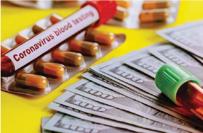
• تلك تشرنجان/عن مجلة فورن بولسي

في الواقع انه شيء مقلق. ان ينتشر فيروس كورونا كل هذا الانتشار بين اوساط طبقة النخبة في دول تتعدى اعمار كثير من سياسيينها الكبار 60 عاماً، الأمر الذي يجعلهم عرضة للخطر بشكل خاص. في بوركينا فاسو، وهو بلد ثقل أكثر من نصيبه المعدل من الاضطرابات في السنوات الأخيرة ويتناضل