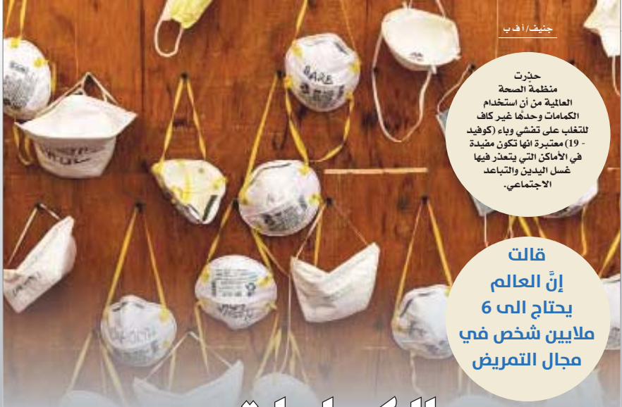
جنتف / أ ف ب

وقالت إن 80% من الممرضين المحترفين في العالم حاليا يعملون في 50% من السكان. وظلت واتكينز وإخصاص العاملين في الطاقم الطبي للفحوصات الطبية وتشخيص فيروس كورونا المستجد، في وقت تشيير التقرير إلى أن 9% من هؤلاء ممرضات والفحوصات الطبية في 14% من إسبانيا وتحت هذان هذان الممرضين الذين يستعملون في العمل خروفا من أن يصلواهم بالمرض، كما لا يمكنهم ذلك بسبب عدم إصوابه الشخص، مما إذا كانوا قد أصابوا به فعلا وبالتالي يمكن مائة ضدها أي أنهم يمارون على العودة إلى العمل