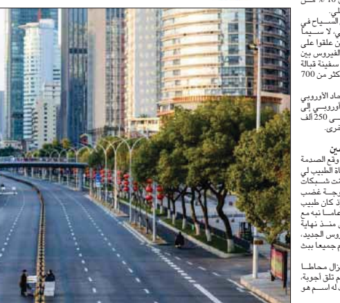
يبدو سباق محموم في أوروبا والولايات المتحدة بين كبرى مجموعات الأدوية للتوصل إلى لقاح وعلاج للوباء، وتختبر دول عدة دواء مشتقاً من الكاروتين، وهي مادة مستخدمة لعلاج الملايا

في 6 آذار، تخطت حصيلة الإصابات في العالم عتبة المليون. وكانت إيطاليا التي ضربها الوباء، بشدة بالغة، أول بلد بعد الصين يفرض تدابير حجر صارمة على مواطنيه، ما حوّل مندا مثل فينيسيا وروما وفيريزي تخض عداة بالسياح، إلى مدن أشباح. وروى أطباء إيطاليون أنهم مضطرون أسام تنفد أعداد المرضى إلى المستشفيات، إلى اختيار الصينيين الذين سيعالجونهم، بموجب الصينيين والوضع الصحي، كما في حالات الحرب، ما أثار صدمة عميقة في إيطاليا.