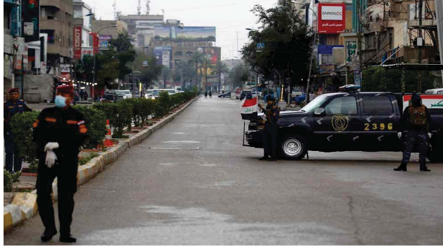
إجراءات فرض حظر التجوال

لتنظيم الإجراءات الخاصة بالوقاية من فيروس كورونا بعد تخفيف حظر التجوال. وقال نائب محافظ اربيل هيمن قادر في مؤتمر صحفي: 'بدأنا بتطبيق آلية جديدة لتنظيم الإجراءات الخاصة بالوقاية من فيروس كورونا بعد التخفيف من حظر التجوال'. منوهاً إلى أنه لغاية العاشر من نيسان الحالي سيكون حظر التجوال بشكل كامل من الساعة السادسة عصراً حتى منتصف الليل، وبقية الوقت سيكون متاحاً وفق ضوابط يتم تحديدها من قبل المحافظات من أجل تلبية متطلبات الحياة اليومية. ولغيت إلى السماح لعربات الخسار بالعمل من الساعة الثانية عشرة ليلاً لغاية الثانية عشرة ظهراً، مضيفاً أن باسكان الاسواق التجارية والأقمار والخايزر ومحطات الوقود، فتح ابوابها من الساعة الثامنة صباحاً لغاية السادسة مساءً، مع تطبيق جميع الإجراءات الصحية والتعليمات الصادرة بشأن العمل فيها. وأضاف أن الضوابط ستبقى مفتوحة مع مراعاة الإجراءات الصحية التي تضمن الوقاية من الإصابة بفيروس كورونا. وقال أيضاً 'حدثنا آلية لتسلم الموظفين وراتبهم، إذ بإمكان موظفي الوزارات التوجه إلى مكاتبهم في اليوم التي تعطى لتوزيع الراتب، منها إلى أن السماح بتجولهم ويستمر لعين الانتهاء، من توزيع الراتب. من جانبها أعلنت وزارة الصحة في الاقليم ان العدد الكلي للإصابات بلغ 288 إصابة ثم شفا، 105 منها وتوفي ثلاثة مصابين.