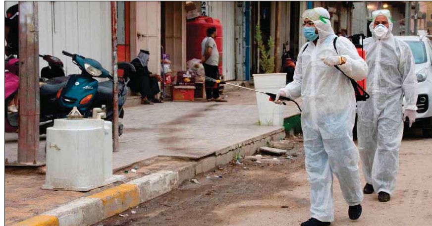
تواصل عمليات التطهير... رشيد

أشادت بعثة الأمم المتحدة في العراق «يونامي» بالإجراءات التي اتخذتها الدولة العراقية وخصوصاً جهود الملاكات الصحية والطبية في سبيل منع انتشار فيروس كورونا والحد من تشرّبه في البلاد، في وقت أكدت خلاله الأزمة الحكومية استمرارها بإجراءاتها الوقائية، مبينة أن هناك تطوراً نوعياً يتمثل بإجراء المسح اليومي الفعّال، والذي أثمر تحرك الفرق الطبية الميدانية بدلاً من انتظار وصول الحالات المشتبه بها. وأصدرت منظمة الأمم المتحدة في العراق «يونامي» أمس الثلاثاء، بياناً بمناسبة يوم الصحة العالمي.