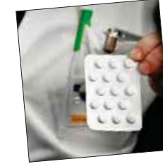
باريس / أ ف ب