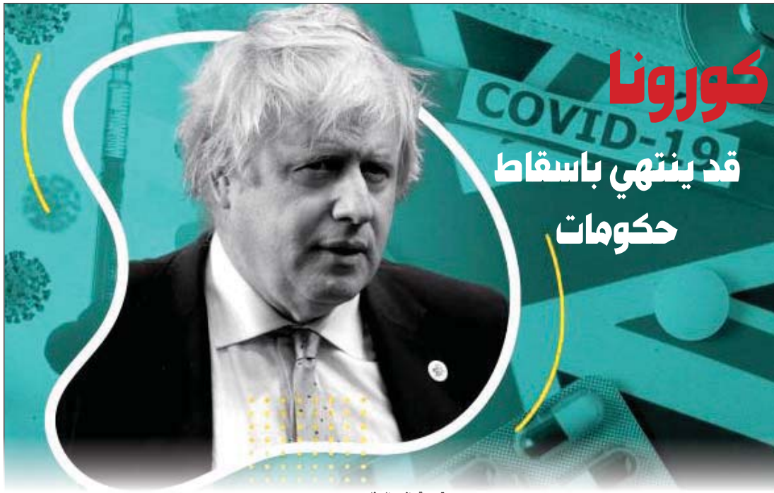
ترجمة - آيس الصغار

في يوم 27 نيسان أعلن رئيس وزراء بريطانيا ذو الصوت الهادر بوريس جونسون على حسابه في تويتر بأن فحص كورونا الذي اجري له قد جاء بنتيجة موجبة (كان هذا قبل أن يدخل الى المستشفى بعد عشرة أيام). سرعان ما تبع جونسون الى العزل الذاتي مسؤولان بريطانيان كبيران آخران هما مات هانوكوك وزير الدولة للشؤون دوميستيك كامنغز كبير مستشاري جونسون. هذه الاخبار حظيت بتغطية اخبارية واسعة وحدثت موجات صدمة في كل ركن من المؤسسة السياسية.