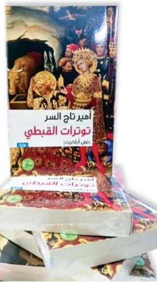
• أمير تاج السر

الأحداث وفق تقنيات وآليات جديدة ترضي مرجعية التلقين الجمالية، كما أن هذا التنويه بعد إشارة إلى عدم التزام الروائي بحرفية الواقع والشخصيات المستقلة التاريخية والتأنيث التي احتفظت بالقيمة سادة لروايته، وأي من ذلك التاريخ والوقائع يصلح ليكون مادة ورائية تحقق هدفها المعرفي والجمالي، وعلى الرغم من كشف نقاد مهمة الرواية التاريخية كمن أدبي، فإن الروائيين العرب قد أسهموا في هذا الحوار والنقاش حول ضوابط نجاح الرواية التاريخية بعدة فنناً سردية يُراد منه تحقيق الفعل الفني الجمالي فضلاً عن الرسالة المعرفية التي أراد توصيلها. ولعل الروائي السوداني أمير تاج السر قد أدرك أهمية الرواية التاريخية بالتنويه الألف الذكر حين جعل مهمته تتجاوز مهمة المورخ في تقديم الأحداث التاريخية، إذ أنه في النهاية يدرك أن ما عليه تقديمه هو ليس وثائق ومرسبات تاريخية وأن ما عليه تقديمه هو رواية، كما كان سردتي متخيلاً، بل أن ينظر الأبطال الآخر ما توصلت إليه الجهود الروائية في معالجة