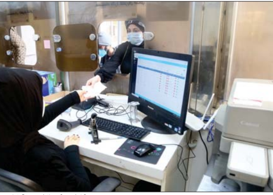
• مركز فحص كورونا في مدينة البو...