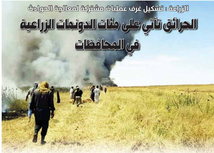
بغداد/ وفاة عامر / المحافظات / مراسلو الصباح