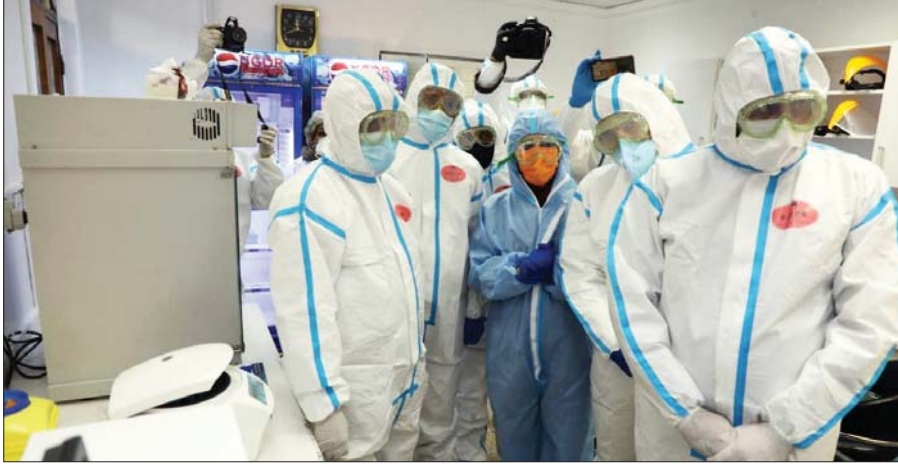
● افتتاح مختبر جديد لتشخيص حالات كورونا

إجراء مسح ميداني إثر اكتشاف حالات إصابة شمالي بغداد