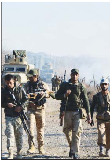
الحشد الشعبي - ارتش