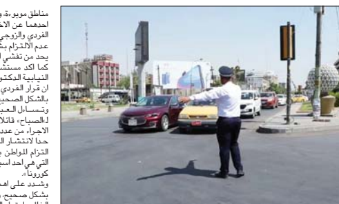
● تطبيق قرار الزوجي والفردي

بين القبول والرفض، وتباينت آراء المواطنين والمختصين ازاء قرار المناوبة في سير المركبات المعروف بنظام الزوجي والفردي. وبينما دافعت وزارة الصحة عن القرار واعتبرته يحد من حركة المواطنين ويحافظ على سلامتهم، انتقد مواطنون ومسؤولون هذا الاجراء، واكدوا انه لا يجدي نفعا في تحقيق هدف التقليل من الاختلاط.