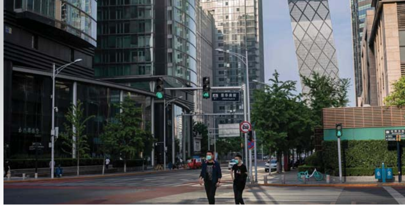
بكين / أ ف ب

تلجأ الصين بإسهاب إلى الوسائل التكنولوجية من روبوتات وكاميرات للسهر على احترام إجراءات العزل وتجنب موجة جديدة من وباء (كوفيد - 19)، فالروبوتات تستخدم مثلاً لتسليم وجبات الطعام وتصبب الكاميرات عند مداخل المساكن لمراقبة الحركة.