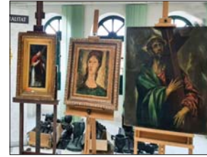
● لوحات مقلدة