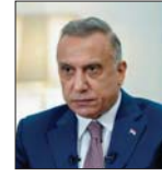
● مصطفى الكاظمي