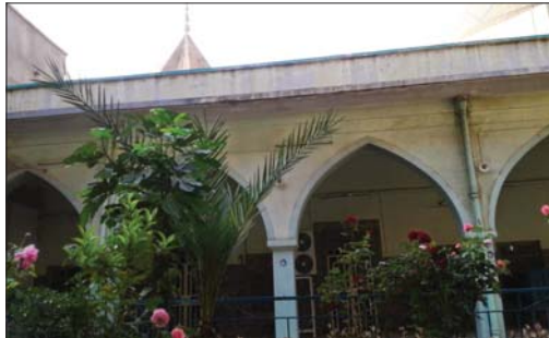
● مرقد وجعم قصب البان