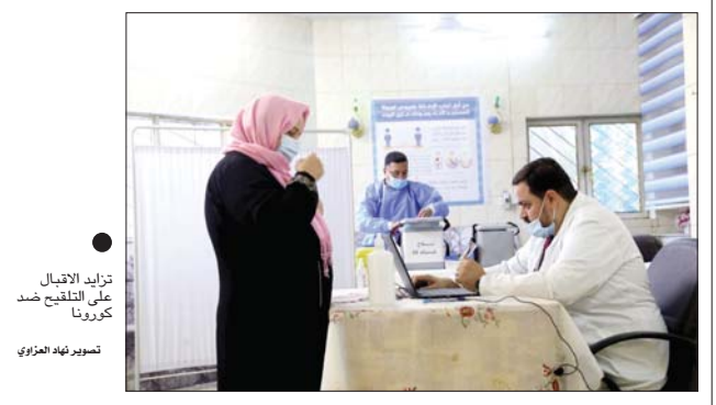
تزايد الاقبال على التلقيح ضد كورونا