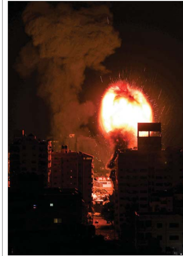
● النار والدمار يتصاعدان فوق مباني الأحياء السكنية في قطاع غزة. بعد قصفت طائرات الاحتلال الحربية، فجر أمس الاثنين، غزّة ليرتفع عدد شهداء القطاع إلى 197 شهيداً، بينهم 58 طفلاً، و34 امرأة.

السعودية مستمرة حتى التوصل إلى نتائج"، وأضاف ريبي، "مباحثاتنا مع السعودية كانت إيجابية، وهناك بوادر إيجابية لحل الخلافات بين البلدين"، مشيراً إلى أن "طهران والرياض بحثتا القضايا الثنائية والإقليمية خلال جولتين من المباحثات حتى الآن". وصرح مسؤولون من الطرفين في وقت سابق، أن المباحثات بين الرياض وطهران تأتي لتخفيف حدة التوتر والتأزمات التي شابته العلاقة بين البلدين خصوصاً في السنوات الأخيرة.