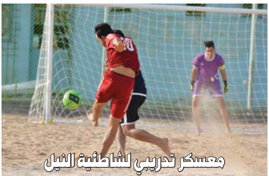
المناريات التجريبية التي يجربها هناك مع اتدبة اربيل. واكد ان القرار في بداية الامر كان للدخول بمعسكر تدريبي خارجي يقام في سوريا بعد تلقينا دعوة من نادي الجيش هناك. لكن تاخر المفاوضات واجراءات السفر المعقدة بسبب الوباء العالمي حالت دون ذلك. وتعتقد ان معسكر اربيل سيكون ديوال ناجعا لهماثنا القليلة.

ولم يوفق حكم المباراة الاتحادي في حسين في العديد من القرارات حيث احتسب ركلة جزاء غير صحيحة لصالح الصناعة في الدقيقة (45) من الشوط الاول بعدما تلطم الكرة بيد ميايل باسم محمد خارج الجزاء لكن الحكم اصصر على احتسابها ركلة جزاء، في ظل رفض الساعدا التدخل تاركا القرار لحكم الوسط ورغم محاولات لاعبي بايل العودة مجدداً الى اجواء المباراة من خلال تسجيل هدف التعادل الا ان عدم التركيز وتضييع الوقت من قبل