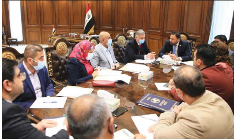
● اجتماع لجنة حقوق الإنسان النيابية برئاسة النائب الأول لرئيس البرلمان حسن الكعبي.. أوشيف