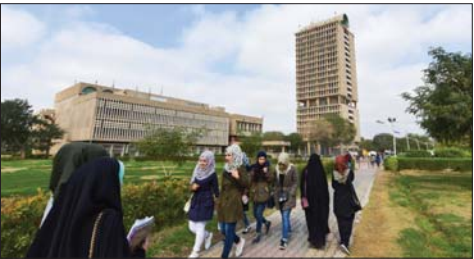
● تصوير على الفريابي

الجامعات تقويمياً واعترافاً عالمياً عن طريق هيئة التقييم التي توغرها التصنيفات العالمية المختصة لأن فلسفة قياس الجودة في التعليم تركزت على بيئة تنافسية عالية تظهر قدرة المؤسسات على مواجهة التحديات ومرواكة التعديب كما ونوعاً واليجاد الحلول العلمية المسؤولة عن معالجة كسبان الصفف وتحسينها في نقاط ارتكاز ستراتيجي.