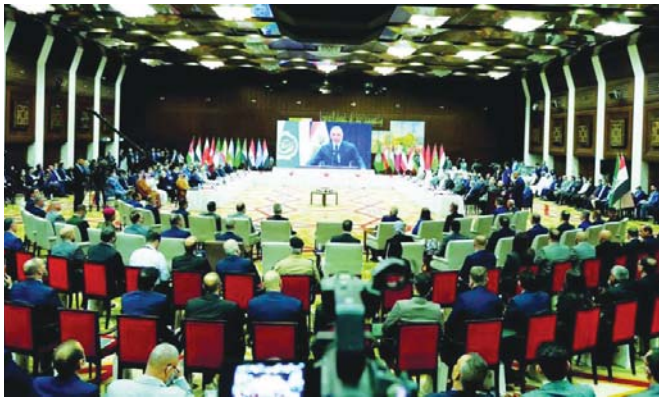
● المؤتمر الدولي لاسترداد الأموال المنهوبة الذي عقد في بغداد منتصف شهر ايلول عام 2021

العراق، فضلا عن أن هذه الأموال المنهوبة قد أدرجت في اقتصاديات هذه الدول واستردادها وتجديدها يعيق الأداء الاقتصادي لتلك الدول. وأوضح أن هناك هفوات واختلاف في التسميات والمصطلحات بين قانون العقوبات العراقي مع القوانين المماثلة في (دول الملاذ)، وهذا يستدعي تعاوننا قانونيا ما بين العراق وتلك الدول، كما أن هناك قانون عقوبات جديداً (أجل قبل أقل من سنة إلى مجلس النواب ونحن نأمل تشريع هذا القانون، إضافة إلى قانون استرداد الأموال، وأشار إلى أنه لا يوجد نظام متابعة تنفيذ المشاريع في السلطة التنفيذية، كما أننا بحاجة إلى سيادة وإنفاذ القانون، إذ إن لدينا تراخياً كبيراً في ملف التعامل مع الاعتداء على الممتلكات العامة، وهو جزء من مشكلة الملف الأكبر.