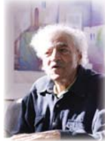
● نوري الراوي

مفابراً، جعل منه نوري الراوي الذي لا يشبه إلا نوري الراوي!! إن الحضور في لوحاته هو حضور هيمنة، بمعنى أن المكان هو البطل الأول والأخير وهو السجال على الكين، لذا لا نجد الجوهري في لوحاته الشهيرة، بل نجد الأمكنة التي تشي عن مكن مفرض له بصمة وهوية وصوت داخل اللوحة.