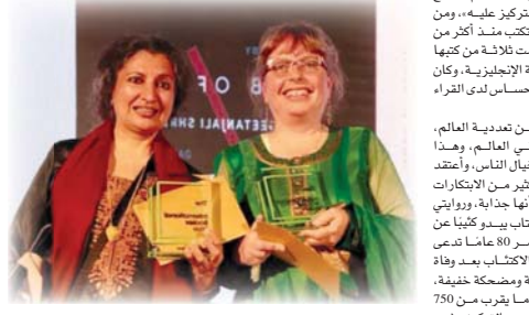
● جيتانجالي شري وديزي وركويل

الانتباه على فكرة، أنها أيضاً أفضل طريقة للعيش للحصول على بعض المرح على الرغم من الأمور الجادة. جيتانجالي شري على جائزة البوكر الدولية عن روايتها (فهر الرسائل) وهي رواية عن الموت - ولكن بضحك، وكانت فحازت منحتها من الهندية إلى الإنجليزية الكاتبة ديزي وركويل بنسب الجائزة البالغة قيمتها 50 ألف جنيه إسترليني لكل من المؤلف والمترجم. وهي صباح اليوم الثاني من فوزهم تحدثوا عن المرح والتسوية والأسلاف المشهورين، فيرمع احتفالات الليل المستمرة كانت وركويل لا تزال تدر عن ذلك حتى الساعة 2 صباحاً تعبيراً عن فرحتها بالجائزة. تقول جيتانجالي شري وهي أول هندية تفوز بالجائزة عن روايتها إذا تعاملت مع شيء تقبل بفضة، فإنك نوعاً ما تزد من حدة الألم، وتضع نوعاً مختلفاً من التركيز عليه، ومن المعروف أن شري تكب منذ أكثر من 30 عاماً، وقد ترجمت ثلاثة من كتبها السابقة إلى اللغة الإنجليزية، وكان هذا ضرب على وتر حساس لدى القراء والناقد. وتحدثت الكتاب عن تعددية العالم، وتعدد الأصوات في العالم، وهذا بطريقة ما يعيد خيال الناس، وأعتقد أيضاً أن هناك الكثير من الابتكارات في اللغة التي يبدو أنها جذابة، وروايتي (فهر الرسائل) هو كتاب يبدو ككثيراً عن امرأة تبلغ من العمر 80 عاماً تدعي (ما) تترقب إلى الاحتفال بمد وفاة زوجها، لكنها مرحة ومضحكة خفيفة، الكتاب مبروع في ما يقرب من 750 صفحة، ومن الضروري التركيز وشد