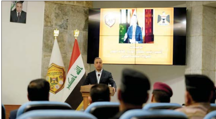
● الكاظمي يفتتح المؤتمر الأمني