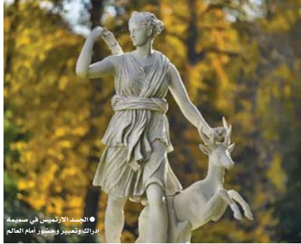
● الجسد الارتيميس في صميمه الإدراك والتعبير وحضور إمام العالم

بنشأ تقوسيات ارتيميس إلى أن رفضاتها تكيد على تمرکز الخير في الحياة، وهيمنة ضوابطها الإلهية المتواترة وهذه الخصائص المهمة التي منححت ارتيميس مكانة متمسمة، ليس في بلاد الإغريق وإنما خارجها برقص ارتيميس، طقس خاص بها، ومن خصائصها المميزة لها وبعثت منه من العنانيات المقدسة جميمة، من خلال حيازتها لعشر عذرات ووضف هذا العدد صفة جمية، ويمتجها مع عذراتها. فرصة التأكيد على الطقس واتساع مساحته والمنوحات لها جنباً بآخر من رب الأرباب زيوس وظل هذا العدد مصاحباً للإلهة في طقوسها وفعاليتها، لكن المهم في دلالة العدد الرمزية، إنه دل على الكثرة، وهكذا وظف في الترواة العهد القديم، لأن الإلهة لا تزيد لجمهورها أن يكون ضئيلاً، وبفضي في جانب آخر إلى أن نظام العذرية وضوابطه الثقافية، والدينية والاجتماعية قاسية وحادة جداً، كما أنها تمنع عدم توسع نظام العذرية لأن الأثري لا تريد تعطيل باطنها المسجلة، بمعنى أنها تحوز صفها الأثوية عبر الزواج والعمل والإنجاب. لم تكشف الأساطير الخاصة بالإلهة ارتيميس حجم طقسها الرقصي، وتم مرة بعدد كوني في أية ظروف يكون؟ لكننا نرى من مزاوتها والتعديلات له يتبدى عن رغبة وسبق إصرار ارتيميس هيمنة الثقافة والدينية على جسدها وأجسادهن ولا يسمح له بالامتداد الخارجي، لأنها ملتبس من الدعا زيوس أن يعجزها عن عذرات ارتيميس. كما أرى حارات تلمين جسدها من اللحظة التي تصاعد بها طاقته الجنسية وتهدت عندها إلى قضاء الرقص، بوصفها نوعاً من الاتصال الرمزي وإشباعاً حاجات المتحضر. وطقس الرقص نوع من إرضاءات الجسد لها وبالطريقة التي تعالجها مؤدبة لتطعمها الديني، هذا الرقص إعلان من الإلهة المحتاج كيميائية قادرة على تخفيف حدة اللذة وطاقته، لأنه بحاجة للاستهلاك حتى يصيبه النساد.