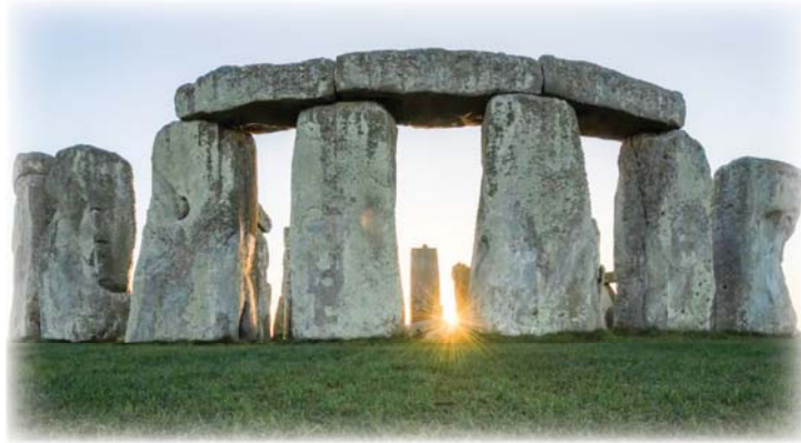
● شيد ستونهينج قبل حوالي 4500 سنة، ليكون (تقريباً) معاصراً لايو الهول وهرم خوفو بالجيزة

هل هو حاسوب فلكي، أم موقع لهبوط سفن الفضاء، أم معبد للأرض الأم؟ أقام المتحف البريطاني معرضاً يهدف لإجراء بحوث عن ماهية «ستونهينج» الحقيقية بعيداً عن النظريات الغريبة.. من تلك النظريات كان تقديم الطبيب «أنتوني بيركز» سنة 2003 تفسيراً تشريحياً لإقامة ستونهينج «معتبراً إياه الموقع الذي أنجبت فيه الأرض النباتات والحيوانات التي اعتمد عليها إنسان العصر الحجري».