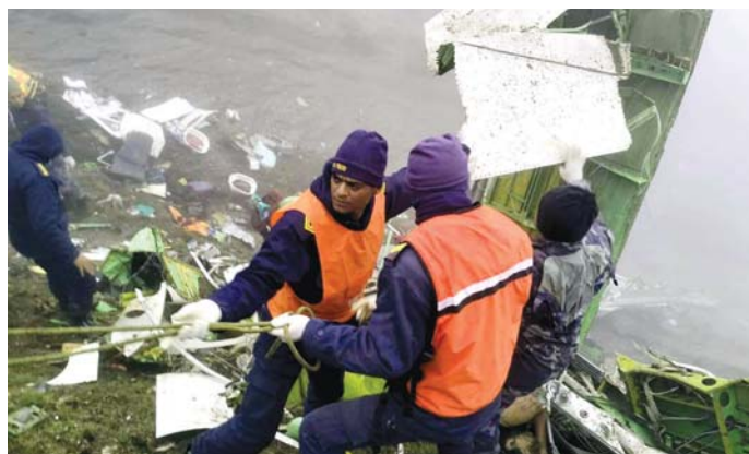
انتشلت فرق الإغاثة النيبالية، أمس الاثنين، 21 جثة من حطام طائرة ركاب سقطت في جبال الهمالايا وعلى متنها 22 شخصاً. وقدف الاتصال مع طائرة نوبن أوتر التابعة لشركة تارا إير بعد وقت قصير من إقلاعها من مدينة بوخارا (غرب النيبال)، صباح أمس الأول الأحد، للتوجه إلى جومسوم.

بدوره ذكر النائب جميل السيد أنه ليس هناك خلاف شخصي بيني وبين الرئيس بري لكنني لن أصوت له، لأنني لست راضياً عن أداء المجلس خلال الأربع سنوات الماضية. بدوره لم يكن يوماً من الأيام محاسبة حكومة أو وزير، ولن أصوت على هذا الأساس. وأوضح أنه ككاتب شعبي أنا مرشح طبيعي لرئاسة المجلس، ولكن لن أشرح ترشيحي لتسجيل موقف فقط، فالرئيس بري سينال أكثر من 65 صوتاً وترشيحي سيمسح عنيهاً وأضاف: لا يجوز أن نصل إلى تشرين الأول من دون حكومة، مؤكداً أن رئيس الجمهورية ميشال عون لن يبقى دقيقة بعد الرئاسة. واعتبر السيد أن ما حصل في الانتخابات ليس تغييراً جذرياً إنما تبادل نوعي بدخول النواب التغييريين، وما أراه اليوم في المجلس إنو عم تركب متارس، ورداً عن سؤل عن إمكانية ترشيح لرئاسة مجلس النواب، أوضح أنه ليس هناك شيء اسمه الترشيح لرئاسة مجلس النواب، إنما ما يحصل هو إعلان فقط، ويمكن أن يصوت الرابون نائب معين حتى لو لم يعلن ترشيحه. كماشفاً عن أن هناك توجهاً لانتخاب الياس بومصوب لمنصب نائب الرئيس، والأجواء تشير إلى أن عدداً من نواب كتل العونيين غير التمسنيين إلى التيار سيموتون للرئيس بري لتأمين نجاحه من الدورة الأولى ويمكن هالتي يتغير.