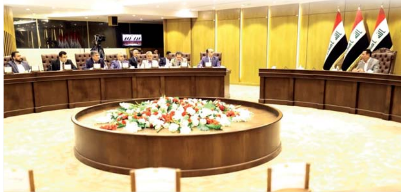
● لجنة الخدمات تستضيف الأمين الجديد

يضغط مجلس النواب على أمانة بغداد للوصول إلى شيء ملموس في عملها خلال مئة يوم بعد إقالة رئيس الوزراء مصطفى الكاظمي للأمين السابق وحلال معاونه البلدي بديلا عنه. وسيكون أمام الأمين الجديد شرط جوهري لزيادة الدعم المالي وهو تحقيق الإنجاز في خمسة محاور أساسية تتعلق بتطوير البنية التحتية للعاصمة وتحقيق تقدم واضح للحد من الزحامات المرورية فيها.