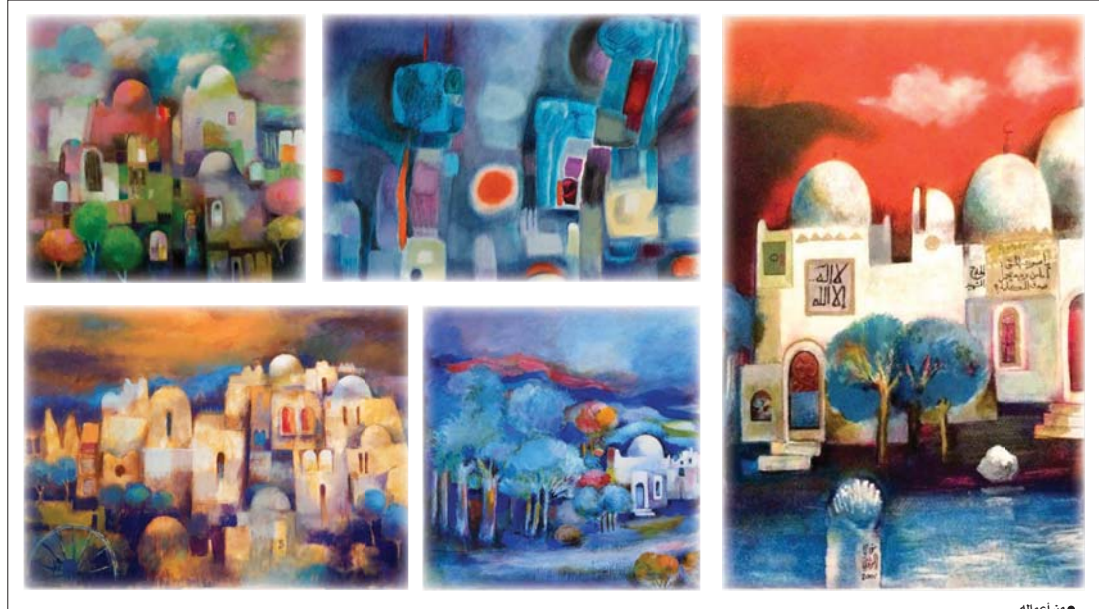
● من أعماله

من (جمل) لونية وفكرية فتكتل اللوحة في ذاته بعد اكتمالها ورسوخها داخل إطارها. هذا الهاجس المنحاز للرسم يتملكني كلما تأملت لوحات الفنان الرائد نوري الراوي (1925 - 2014) فقد توغل في اكتشاف مديبات جديدة للون، وطبقات متكررة لتوزيع الظل والضوء وربما كان ولادته هي بيئة خصبة، غنية الأثر والفرق في خلق هذا الجيل الفطري الذي عمقه في ما بعد بالبحث والدرس والتأمل والتوثيق، حتى يمكن أن نعدّه الآن أحد أهم من أزع للفن التشكيلي العراقي المعاصر، ففي (راوة) و(عانة) الرسام - الحقيقي والأصيل - فلا أظنه يعجز أبداً عن ابتكار لون أو رمز أو إشارة أو دلالة هوية ويبدع ويتقنها حينما يشكّل لوحته ويبدع أبعادها الشكلية والموضوعية والفلسفية في نسق بلاغي مبهو يغزى العين الرائجة التي بدورها تنقل هذا الوخر بسرعة البرق إلى ذات المثقفي فيتمثل المعنى ويتدفق ويشعشعك وتتشتت ما ترشحات قارة كثيرة في ذهنه فتخرج تلك الترشيحات - إلى اسعاف ما ينقص