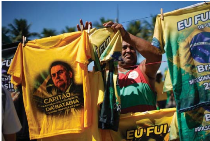
يبيع قسماً تحمل صورة الرئيس بولسونارو وخطبته المثيرة للجدل دانيال سافيرا (ريو دي جانيرو، 1 أياريس، 2022)

قبل بضعة أشهر كان الرئيس البرازيلي الحالي «جائير بولسونارو» (من أقصى اليمين) متأخراً في استطلاعات الرأي للانتخابات الرئاسية المقبلة (تشرين الأول المقبل)، ومتخلفاً عن خصمه الأبرز الرئيس السابق «لويزيناسيو لولا دا سيلفا» وكان الموقف من السوء حتى بدأ وكأنه سيخسر الجولة الأولى من التصويت، لكن بولسونارو رتب التناطف في المسيرة، حتى بات المحللون السياسيون الآن يقولون أنه يمكن أن يعود (من مسار آخر) ليفوز بفتره رئاسية ثانية ذات أربع سنوات.