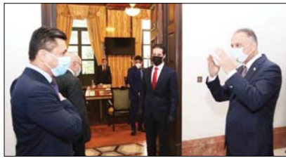
لقاء سابق بين مصطفى الكاظمي وقرباء طالباني

التطوير والذي وضع النطاق على معظم حروف الاستقالات المتعلقة بحصة الاقليم، الذي سينسج على تسليم الاقليم 460 ألف برميل من النفط يوميا مقابل تسليم بغداد لخصم الاقليم من الوزارة ورواتب الموظفين. ويشترط المحطات ان ان هذا الاتفاق قد يتقاطع مع اتفاق الاقليم مع تركيا المعروف الجارية بين بغداد وأربيل، وعودة الوفد