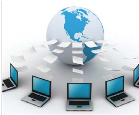
• الحكومة الالكترونية

مؤكداً أن "مشروع الحكومة الالكترونية يحمل بين طياته منافع كبيرة لجمال القطاعات الاقتصادية، ويسهم في إتمام متطلبات الحياة اليومية من مراجعات وغيرها بعيداً عن جميع أشكال الروتين".