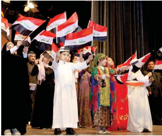
• أغنية الطفل جسر جمالي لتعلم وحب الوطن

«هيا يا رمانة، باي يا بلبلول، شدة يا ورد، اتي وردة بيضة» وأغان أخرى كثيرة لاتزال نابضة بالحياة، تتكرر على ألسنة الأطفال منذ عشرات السنين سواء في المدرسة أو في البيت أو الشارع. كان لها الأثر الكبير في ترسيخ مبادئهم وقيم تربوية للتسامح والسلام والتعاون وحب الوطن. كانت هذه الأغاني بمثابة الجسر الجمالي الذي يوصل العلوم العلمية والتربوية بطريقة مبسطة ومحببة للطفل، وهو ما معمول به في الدول الأوروبية، التي تولي اهتماما كبيرا بتثقيف الطفل وتحضيره لمخيلته للإبداع، إلا أن هذا النوع من الفنون غاب في السنوات الأخيرة، ما عده المختصون والباحثون في مجال ثقافة الأطفال تجاهلا. لأهمية فن مخاطبة الطفل الذي هو ركيزة المستقبل.