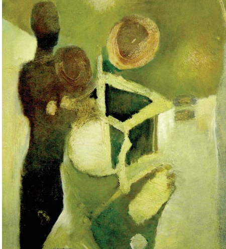
• لوحة لفنان كامل حسين

لطالما راودتنا فكرة الهروب من ضوضاء المدن وتلوث أجوائها إلى ريف لا تزال أصوات البوتقة والصافير تزين صياحاته، وإن أغترت أربابنا موجة الضجيج والبستهة الحداثة وبضاً من شياها لكنها تبقى بريالقياس المدن: فما تتوق إليه النفس لتتعمق بشي من الهدوء الذي افتقدته قنات (أوستاكي) وربما لسنوات طوال عند البعض. لا يقتصر الأمر على الأرياف في انخفاض نسبة الضوضاء، فالسواحل والجبال والغابات وحتى الصحراء هي الأخرى أماكن قد تفوق الأرياف سكوتاً ونقاءً، وتبقى مسألة اختيار واحدة منها رهن ظروف الراغب بالهروب وإمكاناته. الكلام في رغبة الإنسان بنوبات من الهدوء ويحثه عن محطات استراحة يكاد يكون مما أجمعت عليه البشرية وسعت إليه، وكل ذلك لأن المدن لا تهدأ مع نوبتين للعمل في كثير من منشآتها، واكتظاظها بالبشر والآلات رغم مراعاة الجهات المسؤولة فيها لمعايير مهمة في التخفيف من الضجيج المرخص به ومن الضجيج والتلوث البيئي الذي يحدثه الإنسان متجاوزاً به حدود حرية الآخرين وتوسعة مساحة حرته الشخصية، ومع كل هذه المزايا لهذا الجانب في الكثير من البلدان لكن الرغبة