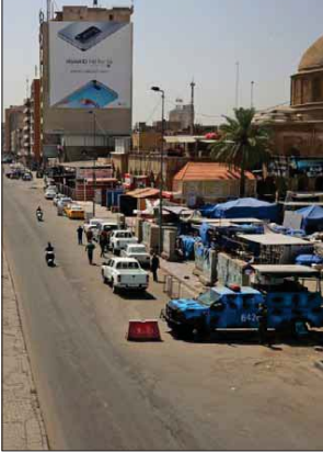
● منطقة الشرجة وسط بغداد في ظل اجراءات التطوير...

كورونا سارعت الشركات بتوفير العديد من إجراءات السلامة انطلاقاً من حرصنا على سلامة وصحة جميع عمالنا الذين يستخدمون التطبيق كإجراء وقائي قصوى بالنسبة لنا فقد اتخذنا مجموعة من الإجراءات السلامة والوقائية منها على سبيل المثال وليس الحصر نظافة السجلات واستخدام العمامات والكمامات من قبل عمالنا، كما تم توفير وسائل تعقيم الاصلح المباشر من خلال الطلب من الزبون الجلوس في المقعد.