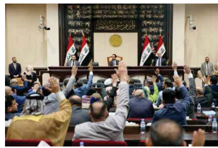
● جلسة سابقة للبرلمان

انتقد مشروعون نوابا استحداث وزارة جديدة في حكومة رئيس الوزراء مصطفى الكاظمي، لافتين إلى أنه سيضيف عبئاً جديداً على الموازنة الاتحادية خصوصاً وأن العراق يمر بأزمة مالية كبيرة مع انخفاض أسعار النفط والتضخم والبطالة وقيام كورونا، وفي حين أوضحو أن الاستحداث لأراضاء معين أو كتلة سياسية وبلا جدوى اقتصادية، أكدوا أنه لن يرى الثور لتضمته جنباً ماله.