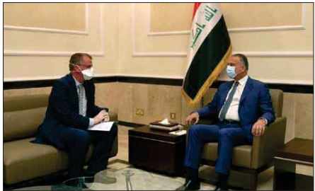
الكاظمي يستقبل السفير الألماني

تلقت رئيس الوزراء، مصطفى الكاظمي، أربع رسائل خطية من المستشارة الألمانية، والرئيس الكوري الجنوبي، ونظيره الياباني والاسترالي، أكدت جميعها مساندة العراق في مختلف المجالات، لاسيما التعاون العسكري، والاقتصادي، والتعاون في مجال مكافحة جائحة كورونا.