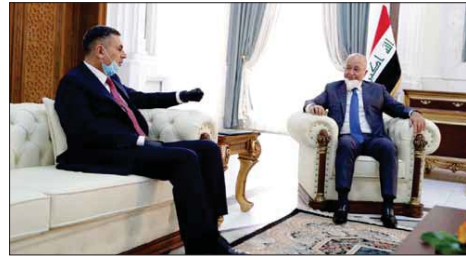
رئيس الجمهورية يستقبل محافظ البصرة