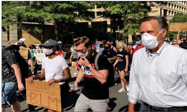
روني واحتجاجات واشنطن