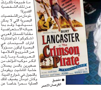
● لخص الفرص الأحمر

لا يد لك التفتيت بتومان عازف الناي، ما طبيعة ناكترت عن تلك الشخصيات؟ تومان من الشخصيات البصرية التي لا يمكن تسميتها، وقد بدأ حياته الاستعراضية مبكراً (شكوك)، ثم اختارته البصرة ليكون مسؤولاً عن الترويج للأفلام المعروضة، وما زالت أكثر موكبه المؤلف من صغرى بالنسب يحملان خشية المشائين ويقومون بالجلوس في شوارع المدينة. وكان تومان يضيف تلك العلية مسراً خلاصاً عن