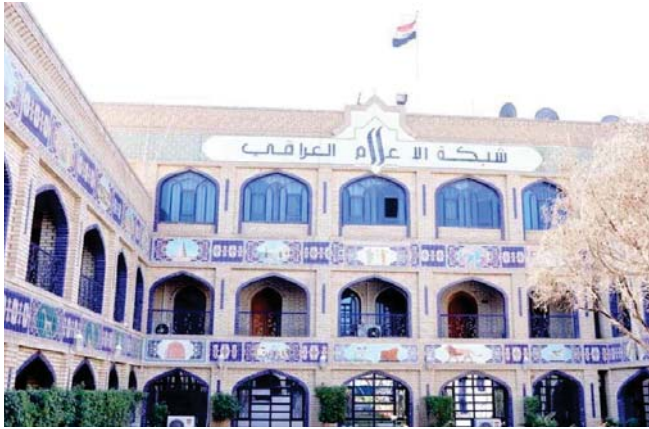
● مبنى شبكة الاعلام العراقي

أشاد أعضاء بمجلس النواب بالمبادرة الوطنية، التي أطلقتها مجلس أمناء شبكة الإعلام العراقي لمواجهة وباء كورونا، وبينما أكدوا أهمية المبادرة وخصوصاً في توقيتها الحرج الذي تمر به البلاد، دعوا المؤسسات الإعلامية المحلية إلى مساندة المبادرة والانضمام إليها والوقوف في صف وطني وخطاب واحد لتوعية المواطنين وتقويتهم لعبور الأزمة الصحية الحالية.