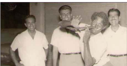
● تومان يعزف الفيلماً بياضه

هل من خلاصة ما اخترعته ناكترت؟ - السينما لونت حياتي وأضحت رغباتي وأحلامي، مثلما كانت مصدر رزق كنت واعتاش عليه، أجل كنت شامها على تائق وإندثار عوالم السينما الساحرة، كما أن السينما اعلمتني تصورا أرحب للعباة بشتي وجهها الاستقرائية الشعبية. * هل لديك تصور عن استعادة أنوار تلك الصور الخالفة بالكاميرات؟ سمعت بوجود دور للسينما بصالات عرض داخل بعض مولات المدينة لكنني لست مقتنعا بأنها ستعطي نفس الأثارة التي كانت تمنحنا سينمات أبو أرعين والى وأبو سيعين حين تطفن أنوار الصالات لتندما حياها ساحة مملونة أو بالأسود والأبيض صموية. ساحة العرض بالموسيقى الكلاسيكية أو أغاني محمد عبد الوهاب وأم كلثوم وفريد وعبد العظيم.