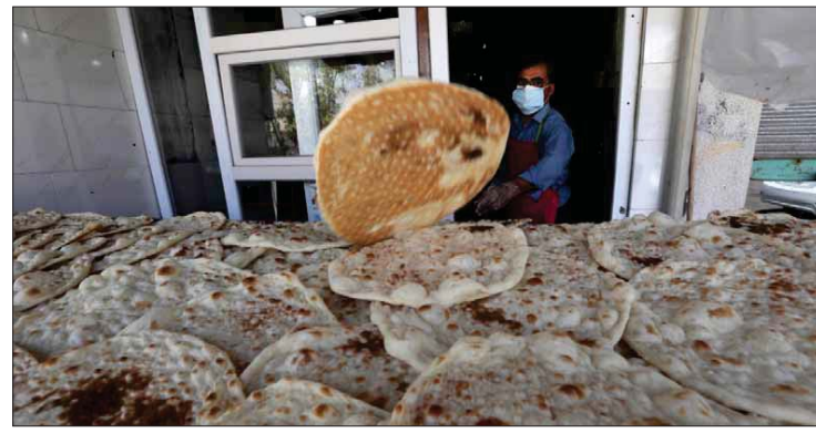
● محل خبز العاصمة بغداد...

دعا مختصون في الشأن المالي والاقتصادي الى ضرورة دعم القطاع الخاص والمنتج المحلي من خلال توفير كل سبل الدعم له، بينما اقترحوا تخفيض سعر صرف الدينار مقابل الدولار بنسبة ٢٥ بالمئة من قبل البنك المركزي لدعم المنتج المحلي ليكون سعر المنتج المستورد، ما يولد فرصة أمام المنتجين لزيادة وتنويع إنتاجهم المحلي الداخلي وطرحها الى السوق المحلية شرط زيادة الدعم الحكومي للأفراد لمنع التضخم.