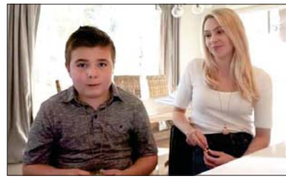
ترجمة: شيما ميوان

المفصلة للعناية بشترتهم في أي زمان وبأي مكان. كما يمكن استخدام فلاند الأحجار الكريمة للأشخاص الأطفال بالتوحد مثل مالاخي الذي يستمتع بمحفزات اللمس، أو كنهدي للضغط العصبي اللين يشعرون بالتملأ، وحتى كوسيلة للتنمية التركيز الكامل للذهن والوعي.