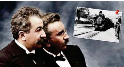
● الأخوان لومير، ما لويس جان، وأوغست ماري لويس نيكولاس الذين اخترعوا أول آلة تصوير في العام 1895

لا تدين السينما تقريباً بأي شيء، الروح العلمية كما كتب الناقد السينمائي الفرنسي المؤثر أندريه بازين في كتابه «الأسطورة (ما هي السينما؟)» عام 1967. إن آباء الفيلم الذين هم بنصفه باتجاه للمشاهدين منظور الكاميرا المستخدم جعله يبدو كما لو أنه سيوهش للمشاهدين، تزعج الرؤية التي كثيراً ما كان يتم سردها، إن أفراد الجمهور، يعتقدون إن القطار كان يدخل بالفعل إلى المنهي، فقفزوا من مقاعدهم وفرروا وهم في حالة من الذعر، سواء كانت تلك القصة خرافية أم حقا، اختراعاً مهماً لأول مرة.