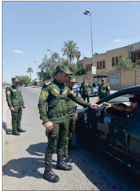
تشديد الاجراءت في الشارع