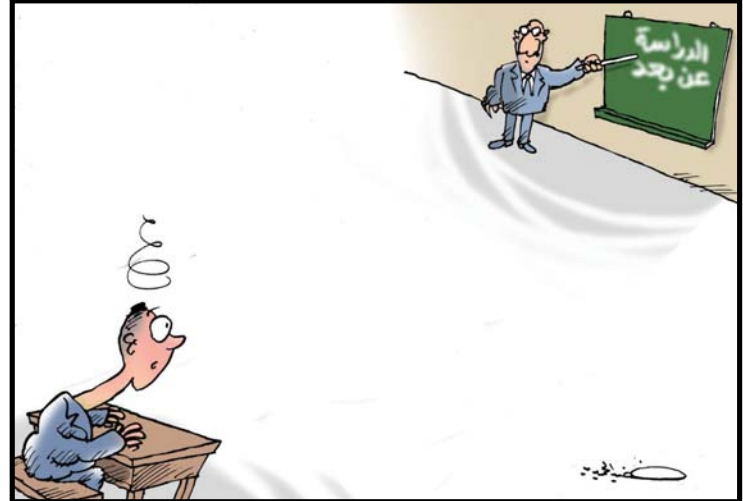
كاريكاتور: خضير الحميري

عندما استكون هذه الدولة هي دولة للمواطنين لا للرعيا، دولة التقديرية وليست دولة اوحدية الشمولية. دولة الانتخابات لا الانتخابية، دولة اللدنية من التأميم والتخريم والتجريم لا إخاء دولة مانصرة للتفكير وبمعاينة التفكير، دولة الانتساقية واولمها بالاجنبي كيمسا لا يوزي هذا الانتساق، أي الاستباحة الخارجية لوراخها من البشر والحوجر.