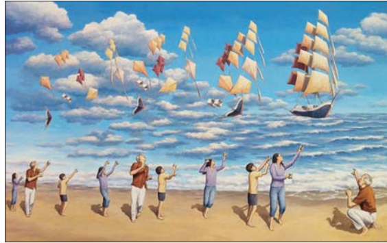
• من أعمال الفنان روبرت فونستافيس

تعد الواقعية السحرية مذهباً أدبياً لا يستهان به، نشأ وازدهر خلال القرن العشرين، فبدأ تحديداً عام 1935، وتجلّى بين أربعينيات وخمسينيات القرن العشرين، وتعرّضت نشأتها إلى التغيرات الاجتماعية والسياسية في أوروبا، وما جاء به عصر النهضة من وقوف ضد كل ما هو سحري ومجانبٍ باعتباره من مخلفات عصور الظلام.