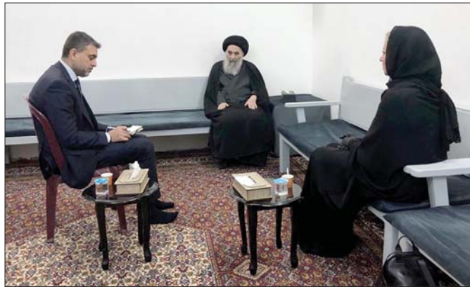
● السيد السيستاني يستقبل بلاسغارت

أكدت المرجعية الدينية العليا في التجف الأشرف ضرورة إجراء الانتخابات في موعدها كما طالب بتوفير شروط نجاح الانتخابات بتنظيم قانون عادل منصف لها وتمهئة الأجواء الآمنة بعيدة عن الضغوط لضمان مشاركة واسعة للشعب العراقي. المرجع الديني الأعلى السيد علي الحسيني السيستاني وخلال استقباله في التجف الأشرف، أمس الأحد، رئيسة بعثة الأمم المتحدة في العراق، جينيفر بلاسغارت، دعا