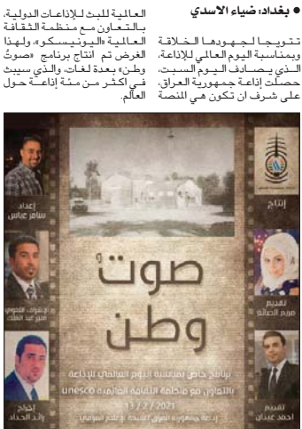
بوستر برنامج صوت وطن

مختتما بالقول ان «اليونيسكو» تختار في كل سنة بمناسبة اليوم العالمي إذاعة بولية لتكون هي المنصة العالمية للبيت، وتم تشريف إذاعتنا بهذا لأول مرة، وذلك لتاريخها العريق، ودورها البارز والتطور الذي حصل بها».