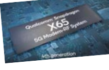
• كاليبورنيا، وكالات

طرحت شركة كوالكوم أحدث مودم Snapdragon X65 5G، خليفة Snapdragon X60 للعام الماضي، الذي بناه للتو بالوصول إلى الأجهزة كجزء من مجموعة شرائح Snapdragon 888، وإلى جانب X65 5G، فقد أعلنت الشركة عن مجموعة واسعة من منتجات 5G لتساعد المصنعين على تقسيم سرعة اتصالات أسرع بشكل ملحوظ وتتمكن حالات الاستخدام الجديدة عبر أجهزتهم من الجيل التالي. وتتضمن قائمة المنتجات Snapdragon X65 5G ووحدة mmWave الجديدة، ومجموعة من حلول الأجهزة الأمامية الجديدة للتردد اللاسلكي، والرادي. وتتقدم كوالكوم بأن يوفر الجيل الرابع X65 الجديد سرعات تنزيل أعلى بكثير، مع دعم سرعات تصل إلى 10 غيغابت في الثانية عبر كل من شبكات 5G المسقطية وغير المسقطية، ما يجعله أول نظام مودم 5G متصل في هذه السرعات. وتعد سرعة التنزيل القصوى الجديدة البالغة 10 غيغابت في الثانية أعلى من 7.5 غيغابت في الثانية في نموذج العام الماضي. كما يعد X65 5G الورد الأول الذي يدعم Release 16 من 3GPP. وهي المجموعة الثانية من المواصفات التي تهدف إلى تعزيز توسيع ونشر 5G NR في جميع أنحاء العالم. ويتميز المودم أيضاً بقائمة قابلة للترقية، ما يسمح للشركة بإضافة الميزات الجديدة المقترحة في Release 16 من 3GPP. أيتم طرحها بسرعة عبر تحديثات البرمج. ويستعين هذا بإطلاق المرحلة الثانية من الجيل الخامس 5G المصممة لتحسين الشبكات، مثل اتصال MIMO الهائل واستهلاك الطاقة والريز. ويهدف Release 16 من 3GPP أيضاً إلى المساعدة على تعزيز 5G من الجيل التالي إلى الرابع من الاستخدامات التجارية، وذلك بفضل دعم أفضل للطفيل المرخص والشبكات عبر العائمة.