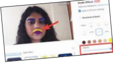
• نيويروك، وكالات

تتيح ميزة Studio Effects من منصة Zoom للمستخدمين إضافة ألوان الخواجاوب والشاراب واللحية والشاهة إلى صورهم أثناء مكالمات الفيديو. وبينما تم إنشاء Zoom من أجل تسهيل تطبيق اجتماعات جاد للشركات فقد أصبح منذ ذلك الحين أحد أكثر الخدمات استخدامًا أثناء الوباء، ولا شخص يريد إجراء محادثة افتراضية وجها لوجه ونتيجة لذلك، قامت الشركة بإضافة المزيد من الألباء الممتعة مثل الخلفيات الغريبة لاستخدامها في الاجتماعات العالمية عبر الإنترنت، ومحادثات الأصدقاء، وكذلك واجهات العمل. وبالرغم من أن الميزة لا تزال في مرحلة تجريبية، إلا أنها ليست جديدة حيث قدمت Zoom ميزة Studio Effects في شهر أيلول 2020. ومع ذلك يبدو أن المستخدمين يولون المزيد من الاهتمام لها الآن ويبدو أنه يتم طرحها قريباً من الأشخاص ومن قبل الأجهز التي لا تحتوي على الكاميرا، مثل الهاتف، يمكنك اختيار أي لون تريده لتغييرات الوجه. وملاوة على ذلك يمكنك حفظ تغييرات الوجه التي اخترتها بشكل تلقائي لجميع الاجتماعات المستقبلية. ولقد أعلن عن الميزة للمرة الأولى بواسطة Zoom في شهر أيلول 2020 لتطبيقات التشغيل ويندوز وماك، لكن يبدو أن المستخدمين لاحظوها حديثاً فقط، مما يشير إلى أنها تستعد للإطلاق واسع النطاق.