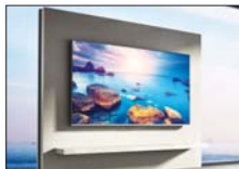
• شنهافي، وكالات

كشفت شركة 'شاهوي' عن Mi TV Q1 75، وهو جهاز التلفاز OLED 4K التميز في السوق العالمية حتى الآن. وتقدم 'شاهوي' تجربة التلفزيون الذكي بدقة 4K التي تقضي الحدود بفضل لوحة شاشة بقياس 75 إنشاً، وتكنولوجيا النقاط الكمية بالإضافة إلى نظام Android TV 10 وتجربة التلفزيون الذكية المسندة ويوفر Mi TV Q1 75 اختياراً من شهر أيار المقبل 2021 في مناطق معينة بسعر موهبي يبلغ 1300 يورو. وقال (المدير باب) Emory Babl، مدير تسويق المنتجات في 'شاهوي'، تعد فئة التلفاز من الأولة المسقطية، ويعني آخر تطور التسعة بالسماح لك بالتمتع بالحاسبات المحمول الزود بسبع شاشات العرض والظاهرة ويبدو جهاز Mi TV Q1 75 أكثر خضرة بشأن الخاف من الحاسبات المحمول Project Valerie ذي الشاشات اللائحة مع Razer. ومع ذلك تدعى Expanscape أنها على استعداد لبيع الترويج الأولي من الحاسب المحمول. والفيرة للطيران في طائرة، وتقول شركة Expanscape إنها تعمل على معالجة هذا الأمر في المتاح الأولة المسقطية، ويعني آخر تطور التسعة بالسماح لك بالتمتع بالحاسبات المحمول الزود بسبع شاشات العرض والظاهرة ويبدو جهاز Mi TV Q1 75 أكثر خضرة بشأن الخاف من الحاسبات المحمول Project Valerie ذي الشاشات اللائحة مع Razer. ومع ذلك تدعى Expanscape أنها على استعداد لبيع الترويج الأولي من الحاسب المحمول.