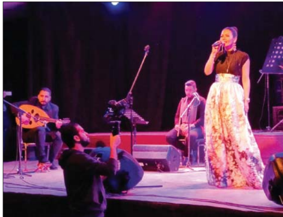
عباس من حفل سابقية الصاوي