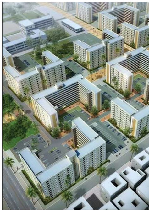
• مجمع بسماية

ولفتت النجار إلى أن «مجموع الشقق في مجمع بسماية يبلغ 35 ألف وحدة تتراوح مساحتها بين 100 إلى 140 متراً، مؤكداً أن «الهيئة تحمل حالياً مع جميع المحافظات على إعادة إحياء مشروع اللبنة وحدة والتي سطره بأسعار مدعومة وبشروط ميسرة».