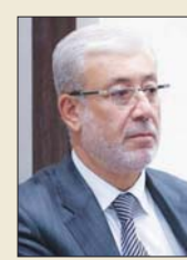
حداة: المرحلة تتطلب جهوداً استثنائية للسلطة الرابعة في تعزيز الخطاب الوطني الجامع