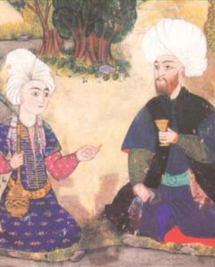
● تراث اسلامي

كان هناك في زمن قديم ملك عظيم وفي احد الايام حضر رجل شان امامه وقال: يا ملكي، سامس لك عمامة من النسيج الابيض يمكن ان يراه الملوك من ابدن معروفين، بينما تعجب الملك من ذلك واصدر أمراً