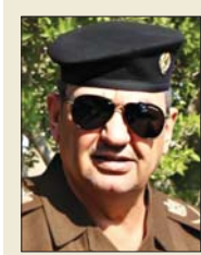
القائد شرطة بغداد: إن صحيفة «الصباح» راقت الحقيقة ويبحث عنها قدامتها لكل القراء... وخطت منذ خدامتها الأولى صوب الاحتراف والمهنية والحيادية