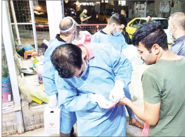
اجراءات فحص - ارضيف