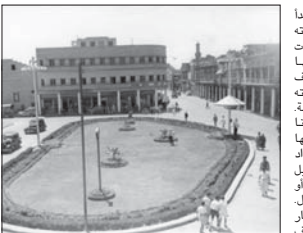
● من ساحات بغداد القديمة

فقال سوف نشقائق للروح مع الاحبة لا ابد من العودة اربح الصبا، ويطوي ويرح الخضر ليفوق .. عيشه بجنت كل طيرة ثم يكمل طريقه العائري سوف نشقائق لؤبة لذي من يبعاد في ذاكه الطريق، لا يرد بينه الهوى لبغداد .. يهي الايام تخصي بكما مع ذكري شوارع بغداد العطرة التي تذكرنا بانتماسه للقاء ومتابع السياسة وفرحة الأهل (واشي بشراح السععودن ... عراق الخير لو تترنن ... وبعي ان العمر يمضي بسرعة لا يعاني الشوق لا من يكابده: يترقب العائري ومازال حرد: ماكنو اجعل وطن غيره ... تخرق الشوك يا طوية.