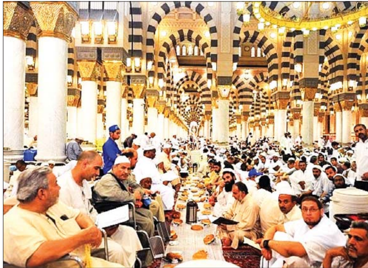
● افطار جماعي

جاء في لسان العرب في (باب رمض) الرَّمَضُ والزَّمْضَاءُ شِدَّةُ الْحَرِّ والرَّمَضُ حَرُّ الْحِجَازَةِ مِنْ شِدَّةِ حَرِّ الشَّمْسِ، وَارْمَضَ الْحَرُّ الْقَوْمَ، اشْتَدَّ عَلَيْهِمْ وَرَمَضَتْ قَدَمُهُ مِنَ الرَّمْضَاءِ أَي أَحْرَقَتْ، وَارْمَضَ الرَّجُلُ مِنْ كَذَا أَي اشْتَدَّ عَلَيْهِ وَاقْلَعَتْ.