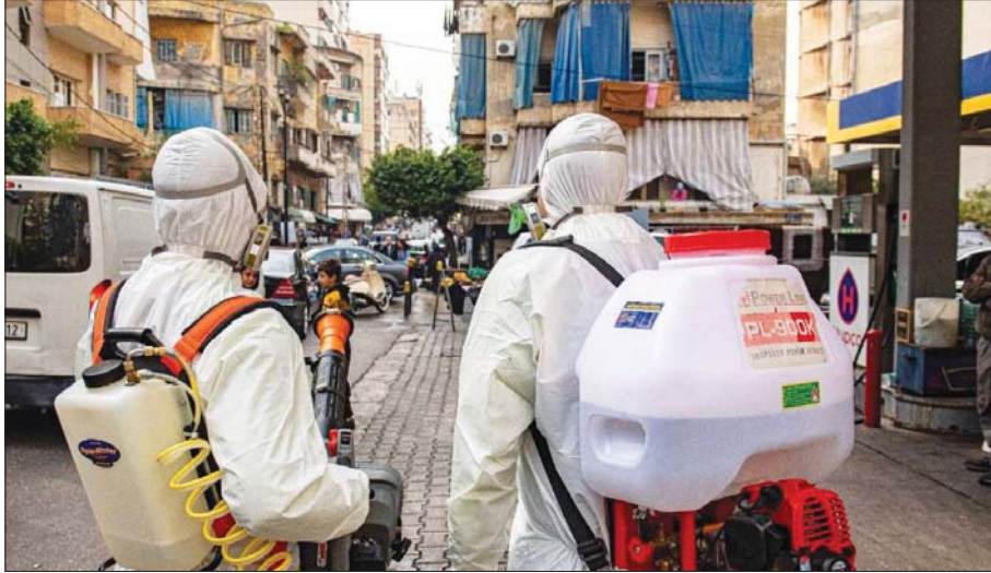
● تعقيم الشوارع بالمطهرات ... أرييف

بينما يقترب عدد الإصابات بفيروس كورونا من خمسة ملايين إنسان، حذرت منظمة الصحة العالمية أمس الأحد، من أن عمليات رش المطهرات في الشوارع على غرار ما يحصل في بعض الدول لا تقضي على الفيروس، مؤكدة أن ذلك يتطوي على مخاطر صحية، وفي وقت أعلنت فيه غالبية البلدان الأوروبية انخفاضاً ملحوظاً بأعداد الإصابات، شهدت بريطانيا وألمانيا وفرنسا تظاهرات كبيرة احتجاجاً على إجراءات السلطات وقيود الحجر والتباعد الاجتماعي التي تفرضها منذ ظهور جائحة كورونا.