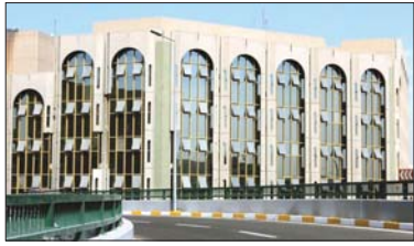
مبنى وزارة العدل