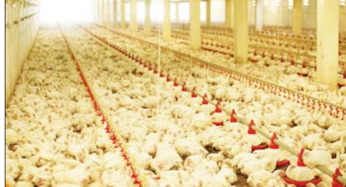
دواجن - وكالات