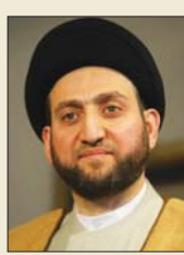
الحكيم: تؤكد على إبقائها صحيفة للدولة العراقية ومصدراً خبيراً متميزاً للقرائ