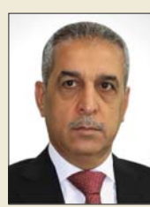
فائق زيدان: يتقدم مجلس القضاء الاعلى بازكي التهناتي والتبريكات بمناسبة ذكرى تأسيس الصباح