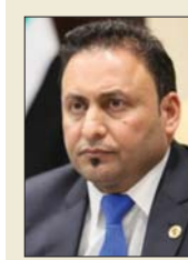
الكبي: أثبتت أنها صحيفة الوطنية التي تنقل مشكلات المواطن وهمومه وتطلعاته

بغداد / الصباح / مهتد عبد الوهاب وشيما رشيد