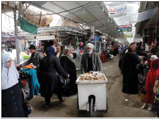
● سوق النبي يونس ... الرشيف