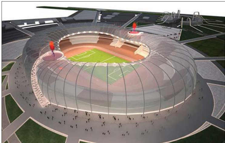
• نموذج لمعب التاجيات