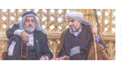
منهده من مسلسل احلام السنين

أؤ تتعاطف معها، ذلك لانتنا لم نتعرف عليها أساساً، فإن الزفاف يعاود هنا القوم والتقاطل بزواج جوده اهور الذي كتبه شوقي القفيور، بزعم جوده اهور الذي كتبه شوقي كريمة حسن وبلاست من حيد مساعدات من التيشبهات والكسور والتعبير اللينق والبيت اهور وحسن سيانقه تراثياً واستخذاد (الحسنة الجنوبية للبيبة، لأن في البيبة الابانية قد طفقت على السرد التراسي، كما أن المؤلف قد اعتمد كثيرول بالرجوع الى الاساس في كتابه السيناريول على تقنية (الوارج) (الوارج المالحلي) وتبثت معالمها إجرائية بالريشة السمرية القديمة، وأصبحت أصالة المثل تعاطف بصوت مسودع في أكسمة من خلفه المساق فعارضها كالتدرا امامنا من غير رجعة، وبسببه هذه التقنية الدرامية في معالجة المثل أخذ الإيقاع قوامه للممسلسل بالتشتقل والبط، خاصة عندما يتزامن ذلك مع سرد ولراء المنزاع الكافية عن الحاجة كي ياثق أخذ من السارد العراشي الكثير، ومع توالي هذه المشاهد وتكررها ومحابحة الأقطاع الغناثية لها بدأ المسلسل يفتق الإحساس بالزمان داخل السرد الفاني، يبقى موضوع الهمجة التوظيفية وطريقة إخراجها من قبل المنتجين صعبة وشاقة ومعقدة، وفي ظل عدم اعتماد الدراما العربية على ما يعرف بالخيير الهمجي) تهيئ الاجتهادات الشخصية للممثلين بطريقة التعامل مع تلك الهمجة وقدمتهم على تنوير ابيكاتبهم الفنية ماثلة أمامنا.