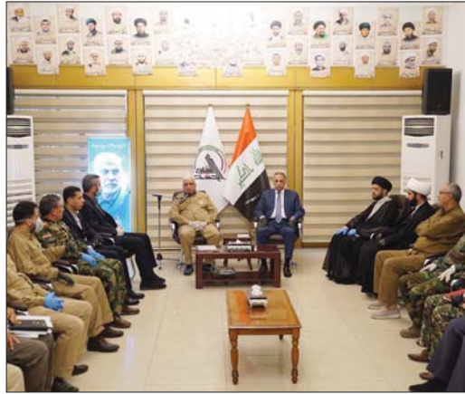
الكاظمي خلال زيارته هيئة الحشد الشعبي