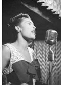
المغنية بيلى هوبداي

بخشي الفراق .. وجيء الخوف فأنكسرا وكان دمع الجهات السبع منتظرا (الله أكبر) حتى قيل فراجها وراج يبحث عن فرض يقوم به وصاحبت الفروض فرض ليس مبتكرا فيا علياً علو اللا ابوع به أفتت فوالله فيما شاء، أو أمرا خذ ياعني بلط الأرض فاعتذرا وكان ينزف ماء .. كلما روح وقلبت على احقارهم عبرنا كنت قالك لولا أن علف بيد سنكت جينهي ففاضت على دمي غمرا العزم عزم يامولي كان له قائلنا .. وقد أجلبت. وما زال أتى أوسات رهن دمي وتأتزل الحجة القلب حيث برى وانتهقا والتفتا على الحياء وفاضا موعدا / بشرنا وعندما لم يظل لنا قال له لانتظرن في قد استبدلتنا القفرا لا والعلمي الذي علاقك لن تعلقا من كلام اله وانسكابا على الاثام عجبنا يمنع الخظرا بقا أعنيك جرحا كي أعوذ منكم وسار لابل لا صخرأزم منعت عنوة الطهر... لا للبل الذي كفرا سبال الغرانتان من كفيبه واربتنا وبعدو حمره مسودة كذرا وجي بالارض .. جحي الضوء .. ان الاميز له اتباعه الا صرا جحي عد