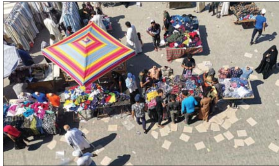
● إحدى أسواق ذي قار ... في آب

العديد من الواردات السلعية والخدمية والأفاداة منها لأغراض الاستهلاك والاستثمار من قبل القطاع الخاص، كما أن يقلل العجز في الموازنة العامة و يقلل الطلب الكلي الذي يعكس في انخفاض معدلات التضخم. و أكد أن اعتماد تقنية الاتفاق الحكومي بإمالة سيسمح للقطاع الخاص بالعمل بحرية أفضل ويقلل من أثر المزاجية التي تنشأ نتيجة تدخل الحكومة في الأنشطة الاقتصادية المختلفة.