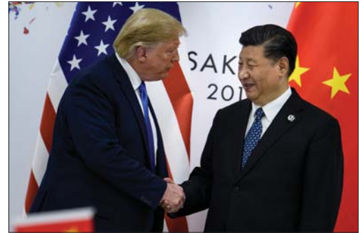
● الرئيسان الاميريكي والصيني لدى توقيعهما اتفاقية التجارة ... في آب