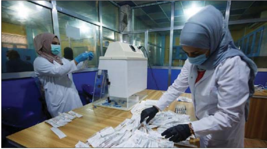
● أحد مختبرات فحص عن حالات كورونا...