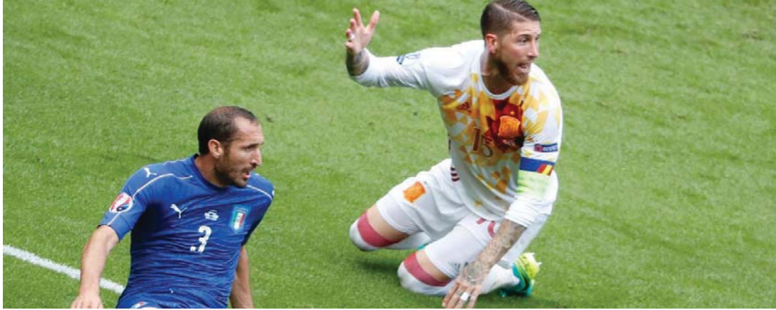
● كيليني وراموس في مباراة سابقة... أرشيف

لم يتعمد ذلك (الإصابة). لكنه يعرف انه في تسع مرات من أصل عشرين الإسقاط بهذه الطريقة وعدم إيلتق الناس يهدد بالتسبب له بكسر... أما الفكرة الشاذة التي يراها كيليني لدى راموس فهي حاضرة الطاغية مقارنة مع زملائه في خط دفاع النادي الملكي الإسباني وأوضح "لقدوة التي يعكسها مجرد حضوره منزهة من دون راموس بعض الأبطال مثل (زيملة قلب الدفاع الفرنسي رافيل) فران داني كارخال والبرازيلي مارسيلو بيدون مثل الثلاثة، وإن غيابه يجعل الفريق بلا دفاع