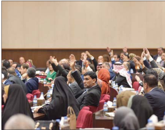
● مجلس النواب... أريفت