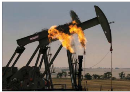
● غاز مصاحب، أرييف

أعلنت وزارة النفط انخفاض الكميات المحروقة من الغاز المصاحب لشهر آذار الماضي، مبيئة ان انتاج الغاز الجاف بلغ 1217 مققاً يوميا. وقالت الوزارة في محصلتها نشرت على موقعها الرسمي وطلعت عليها «الصباح» ان انتاج الغاز المصاحب من قبل الشركات النفطية في عموم العراق لشهر آذار بلغ 2764 مققاً باليوم، مبيئة ان المحروق من الغاز انخفض بواقع 1460 مقق يوميا مقارنة بـ 1594 مقق باليوم خلال شهر كانون الثاني. وأضافت الوزارة ان انتاج شركة نطق الشمال والوسط من الغاز المصاحب بلغ 335 مقق باليوم والمحروق منه بلغ 123 مقق باليوم، موضحة ان انتاج نطق البصرة ونطق ذي قار ونطق ميسان بلغ 2429 مقق باليوم والمحروق 1337 مقق باليوم. وأشارت الوزارة إلى ان انتاج الغاز الجاف بلغ 1217 مقق يوميا، بينما بلغ انتاج الغاز المسائل 6324 مئنا يوميا. وتفيد التقديرات الأولية لوزارة النفط بأن العراق يمتلك احتياطياً يقدر