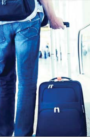
الاستعجال طلب منع المدعي عليه بالسفر، فإذا كانت هناك أسباب جديده نزل ذلك استنادا لاحكام المادة 142من قانون المرافعات وتطلب إعادة الدور أو المياه أو الخدمة الهاتفة. الع

وإشار إلى أن "معظم هذه الحالات كانت بسبب وجود ديون على المدعي عليه وعدم معرفته بتفاصيل الدعوى القائمة ضدّه أو عدم التزامه بالإجراءات القانونية حيالها، وذلك دعوى الأحوال الشخصية والحضانة أو النفقات تكون في بعض الأحيان موجبة على السفر خارج العراق من الحالات الأساسية لمنع السفر الطويلين بنهم جنائية أو إرهابية أو فساد، وكذلك المشتكات التي ترواح المواطن في أوقافهم الرسمية أو تشابه الأسماء، وغيرها من القضايا الواضحة.