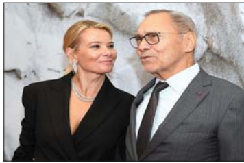
• المخرج كونشالوفسكي وزوجته واشنطن، نافع الناجي

الفيلم تم تصويره باللغة الإيطالية ترجمة إلى الإنكليزية ويبدئين الفيلم عندما ينتهي مايكل أنجلو من كتيبة سينسنت، إذ كان مايكل أنجلو مشهوراً بالفعل - بفق رافيدو - أمام قصر فيكتوري في فلورنسا - ليخوض معركة عندما يجبره عمال الفاتيكان على إزالة السنقالة، ولكن عندما تمكنا البابا بوليوس الثاني (ماسيمو دي فرانكويفنتش) ، يتحرك مايكل أنجلو في البكاء، ويمجد موت بوليوس سرعان ما تم استبداله بابالياهو لي العاشر (سيمون فرتواتين) ، وهو عضو في كتيبة ميديشي الأكثر قوة التي يحمدر عودته الي السلطة. استعان مايكل أنجلو اليه سلسلة من المشاريع الجديدة بما في ذلك الواجهة (فني لم تكتمل أبداً) لكاتدرائية سان لورينزو في فلورنسا، والشكله الجديدة أن مايكل أنجلو ترمز بالفعل، يحصل على أموال مقابل التقير التصح البابا بوليوس الثاني، وكانت الشهيرة، ويعايرها أخرى أنه تصوير مرته، سنة ديلا زوفيري على وشك الانتهاء، مرة.