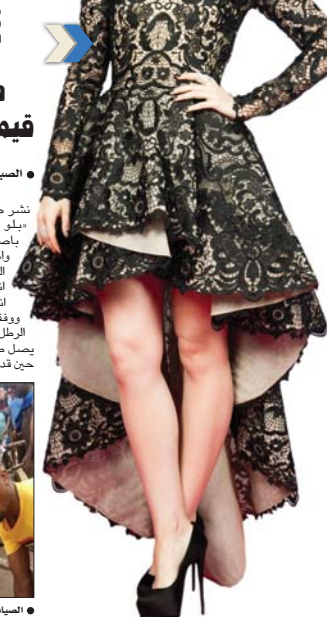
• المياد التجريبي

اعلنت جائزة جمعية المصورين السينمائيين في اميركا ترشيح فيلم «مناك» من بطولة النجمة ليبي كولنز لجائزة افضل فيلم روائي