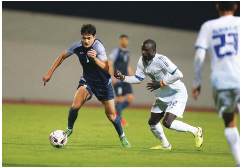
● بغداد: الصباح الرياضي

تستأنف اليوم الأثنين منافسات الجولة الـ 24 من دوري الكرة الممتاز بإقامة أربع مباريات ثلاث منها في ملاعب بغداد بينما المباراة الأخيرة سيستضيفها ملعب الفيحاء في البصرة.