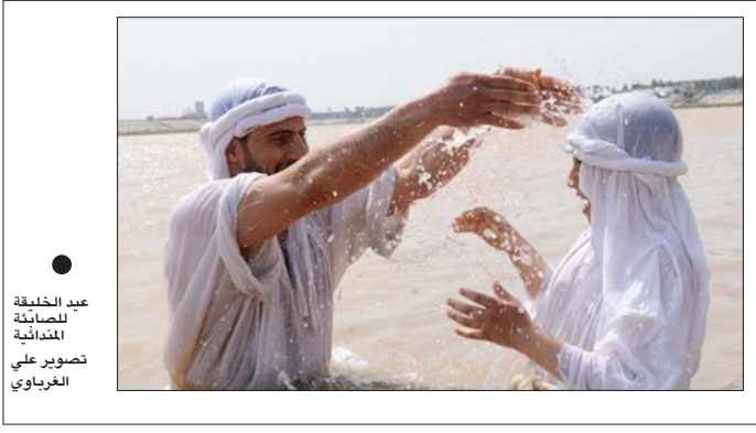
عيد الخليقة للصابئة المندائية