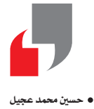
حسين محمد عجيل

تشكل رواية «جلال خالده» الثورة الفنية في أعمال محمود أحمد السيد، رائد القصة العراقية (1903 - 1937)، يعد محاولات مستميتة استنزفت طاقته الحيوية وكل سني حياته القصيرة بلوغ هدفه الاستثنائي؛ وهو وضع الأدب القصصى على خارطة الإبداع في بلادنا فخلت تتنفس الشعر طوال قرون مديدة. ولأجل بلوغ هذه النروة، كان لا بد للسيد الذي تحل هذه الأيام الذكرى 118 لولادته، من مثابات نصية تجريبية يكتشف فيها قدراته ويتمسك من خلال أصداه تلقاها طريقه، كان أولها قصته الطويلة البكر «في سبيل الزواج» الصادرة سنة 1921، التي زامت ميلاد الدولة العراقية، تلتها بعد عام قصته الطويلة أيضاً «مصر الضعفاء» وسنحاول في هذه المقالة قراءة شفرات ورسائله التي بثها في «مصر الضعفاء» وتلمس دوره الزائد لأجل بلورة هوية وطنية في وعي قرائه. وجعل أمهات مدن البلاد رموزاً ضمائرهم، التي كانت تترص بعضها دول مجاورة لا يتلأخها، وإنها لمشاركة مؤثة أن يدور الزمان بالبلاد دورة كاملة مداها قرن كامل، فتعود إلى نقطة الصفر نفسها، وتواجه من حيث ابتدأت التحدي القديم، وكأنها في دورة سديمية مفرقة.